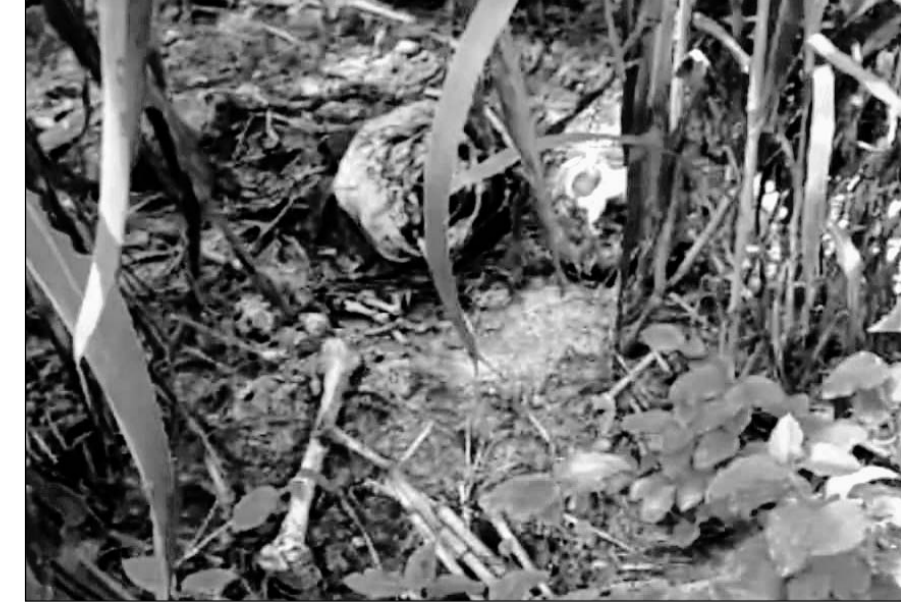
बिलोची स्थित बावड़ी की ढाणी के एक खेत में नर कंकाल मिला।

कंकाल मिलने की जगह के पास ही पेड़ पर एक फंदा भी लटका मिला