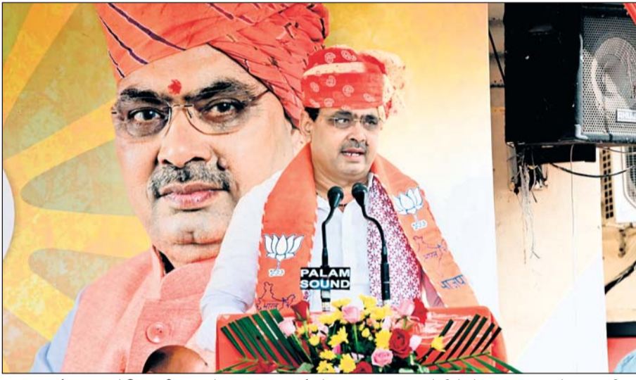
जापान और उत्तर कोरिया की यात्रा के बाद वापस लौटने पर जयपुर एयरपोर्ट से लेकर भाजपा प्रदेश कार्यालय तक मु. मंत्री भजनलाल शर्मा का भव्य स्वागत किया गया। भाजपा प्रदेश मुख्यालय में मु. मंत्री ने कार्यकर्ताओं को संबोधित करते हुये कहा, जापान के निवेशकों ने राजस्थान में निवेश के विषय में बहुत ही पॉजिटिव प्रतिक्रिया दी है।

और भाजपा कार्यकर्ताओं ने ढोल नगादों, बैड-बाजों के साथ पुष्प वर्षा के बीच भाजपा प्रदेश कार्यालय में मुख्यमंत्री भजनलाल शर्मा का अभिनंदन किया। भाजपा के कार्यकर्ताओं का अपार प्रेम, स्नेह और भरोसा देखते हुए मुख्यमंत्री भजनलाल शर्मा ने सभी को धन्यवाद देते हुए यह विश्वास दिलाया कि भाजपा की सरकार प्रदेश के विकास की दिशा में नए आयाम