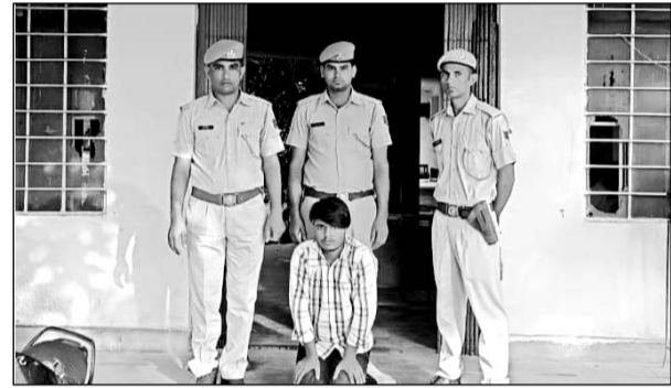
पुलिस ने एक व्यक्ति को अवैध देशी कट्टे के साथ पकड़ा।