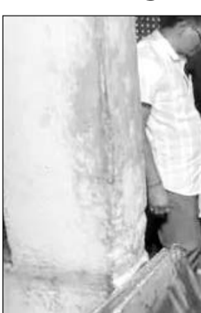
चिकित्सा एवं स्वास्थ्य विभाग की टीम ने पिपलाई व गंगापुर सिटी में खाद्य सामग्रियों के सैपल लिए।