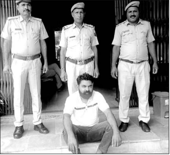
सिंधाना पुलिस ने डीजल व पेट्रोल की खरीद फरोख्त मामले में एक व्यक्ति को गिरफ्तार किया।

खेतड़ी, (निर्स)। सिंधाना पुलिस ने देर शाम को हरियाणा से लाकर क्षेत्र में डीजल व पेट्रोल की खरीद फरोख्त करने के मामले में कार्रवाई करते हुए एक व्यक्ति को गिरफ्तार किया है। इस दौरान पुलिस ने आरोपी के कब्जे से साढ़े तीन सौ लीटर डीजल व पेट्रोल बरामद किया है।