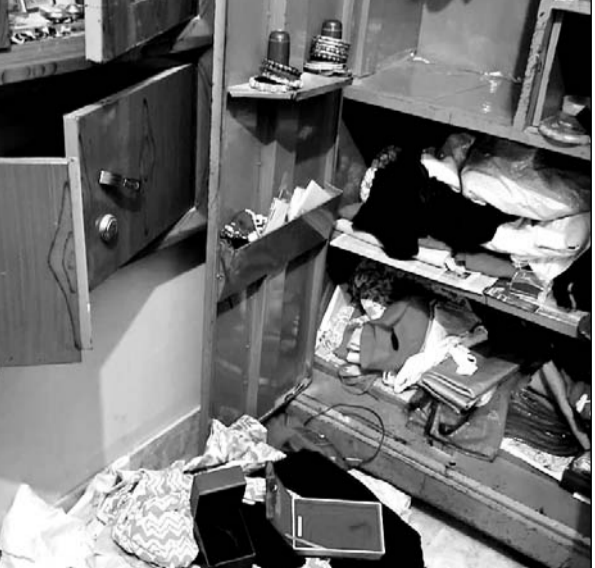
चोरी की वारदात के बाद सामान बिखरा पड़ा है।

बीदासर, (निर्स)। कस्बे में पूर्व में हुई चोरियों का खुलासा आज तक हुआ ही नहीं कि चोरों ने पुलिस गश्त को चुनौती देते हुए एक ही रात्रि में तीन घरों के ताले तोड़कर कीमती सामान पर हाथ साफ कर दिया। जानकारी के अनुसार शुरुवार की रात्रि में कस्बे के वार्ड 7 में दो सगे भाइयों के बंद मकानों के ताले तोड़कर चोरों ने