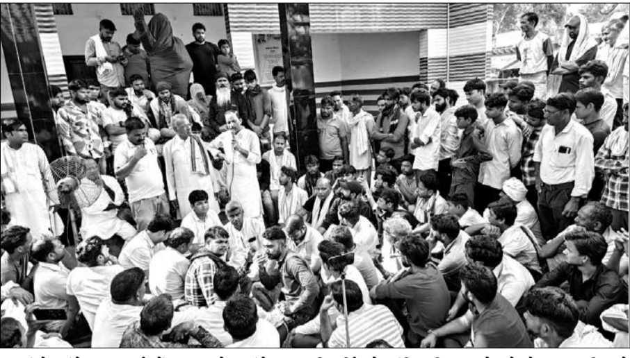
कामां के अंबेडकर पार्क में बाबासाहेब अंबेडकर की मूर्ति को खंडित किए जाने को लेकर छह दिन से चला आ रहा धरना शनिवार को भी जारी रहा।

आंदोलन बड़े स्तर पर किया जाएगा। साथ ही कहा कि सीसीटीवी कैमरे उच्च क्वालिटी के क्यों नहीं लगावाए गए जिन सीसीटीवी कैमरों से आरोपी की पहचान नहीं हो सके फायदा उन सीसीटीवी कैमरों के लगवाने से हमारा समाज इतना कमजोर नहीं है। साथ ही भाजपा सरकार पर निशाना साधते हुए कहा कि भाजपा सरकार दलित विरोधी सरकार है, हमारे