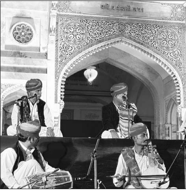
"कल्चरल डायरीज श्रृंखला" के तहत रामनिवास बाग स्थित अल्बर्ट हॉल पर शनिवार को दो दिवसीय सांस्कृतिक संध्या का आयोजन किया गया।

जयपुर। रामनिवास बाग स्थित अल्बर्ट पर शनिवार की शाम जैसे-जैसे ढलने लगी, वैसे-वैसे पश्चिमी राजस्थान के विश्वप्रसिद्ध लंगा-मांगणियार कलाकारों का गायन-वादन श्रोताओं के सिर चढ़कर बोला। बाइमेर-जैसलमेर क्षेत्र के प्रसिद्ध लंगा-मांगणियार कलाकारों ने गायन-वादन की प्रस्तुतियों से वातावरण गुंजायमान कर दिया। लोक गायकी के इन सुरिले हुनरवाज कलाकारों ने अपनी मधुर स्वर लहरियों से श्रोताओं मंत्रमुग्ध कर दिया। गायन वादान के बेहतरीन संयोजन से श्रोतागण झूम उठे। वंस मोर... वंस मोर की ध्वनियाँ हर प्रस्तुति के बाद गुंजने लगी। दर्शकों की डिमांड पर प्रसिद्ध लोक गीत "निम्बूड़ा" की आकर्षक प्रस्तुति दी गई। इन कलाकारों ने एक से एक अद्भुत लय ताल के साथ कर्णाप्रिय गीतों से कल्चरल डायरीज के पन्नों पर यादगार छाप छोड़ दी।