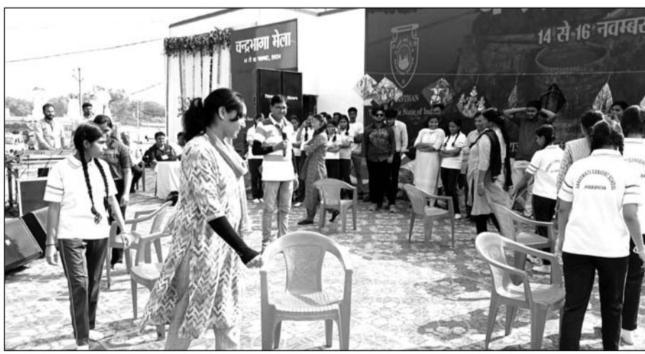
श्री चन्द्रभागा (कार्तिक) मेले के तहत विभिन्न गतिविधियों एवं खेल प्रतियोगिताओं का आयोजन हुआ।

झालावाड़ (निर्देश) श्री चन्द्रभागा (कार्तिक) मेले के तहत जिला प्रशासन एवं पर्यटन विभाग के संयुक्त तत्वावधान में आयोजित किए जा रहे कार्यक्रमों के तहत शनिवार को विभिन्न गतिविधियों एवं खेल प्रतियोगिताओं का आयोजन किया गया।