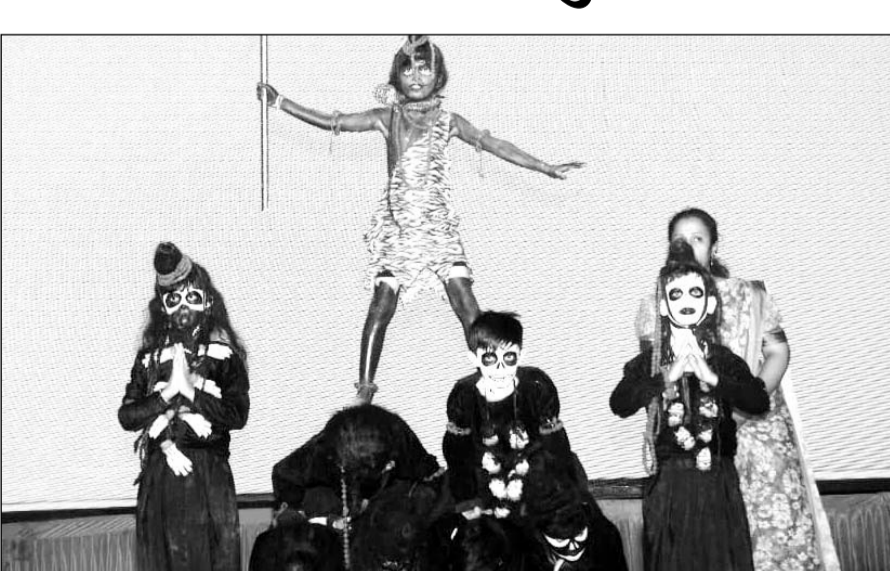
झालावाड़ में श्री चन्द्रभागा (कार्तिक) मेले में मेला मैदान में "रंगीलो झालावाड़" सांस्कृतिक कार्यक्रम आयोजित किया गया।

झालावाड़ (निसं)। राज्य स्तरीय श्री चन्द्रभागा (कार्तिक) मेले के दौरान जिला प्रशासन एवं पर्यटन विभाग के संयुक्त तत्वावधान में आयोजित किए जा रहे कार्यक्रमों की श्रृंखला में शुक्रवार रात्रि को मेला मैदान में "रंगीलो झालावाड़" सांस्कृतिक कार्यक्रम आयोजित किया गया। कार्यक्रम में विभिन्न विधाओं में स्थानीय कलाकारों द्वारा अपनी प्रतिभा का प्रदर्शन किया गया।