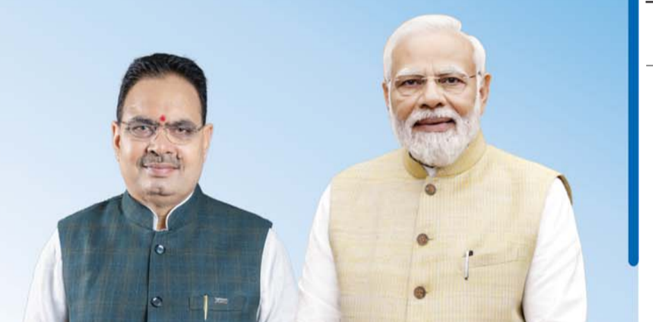
SH. BHAJAN LAL SHARMA Hon'ble Chief Minister, Rajasthan