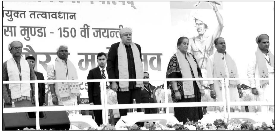
कोटडा में भगवान बिरसा मुंडा की जयंती कार्यक्रम में उपराष्ट्रपति जगदीप धनखड़ शामिल हुये।

उपराष्ट्रपति जगदीप धनखड़ ने कहा कि बड़ा अच्छा लग रहा है, जो हमारे मन में है और सदैव प्रातः स्मरणीय है उनका आज सम्मान हो रहा है। उनकी सोच दूरदर्शी थी और उनका संकल्प था कि हमारा घर आएगा और उनका राज जाएगा। सांस्कृतिक सोच को बड़े बालक योद्धा ने तीन शब्दों में समाहित कर दिया जल, जंगल और जमीन-उन्होंने बिरसा मुण्डा को इस धरती का पुत्रा और पर्यावरण का हितैषी बताते हुए कहा कि आपने दृढ़ संकल्प को सच बना देखा कर मेरा मन अति प्रसन्न है कि अब अपना देश बदल रहा है। देश के सर्वोच्च पद राष्ट्रपति के पद पर जनजाति की महिला द्रोपदी मूर्मू विराजमान है और यह हम सभी के लिए गौरव का बात है। यह सम्मान कोई बक्शीस नहीं है, आपका है हमारा अधिकार और उस अधिकार को प्राप्त कर पद को सुशोभित किया है। उपराष्ट्रपति ने कहा कि संसद में स्थगित भगवान बिरसा मुंडा की प्रतिमा हमें हमेशा प्रेरित करेगी। राष्ट्र धानका का संचार करेगी। उपराष्ट्रपति जगदीप धनखड़ ने कहा कि आजादी की लड़ाई में हजारों लाकों लोगों ने योगदान दिया। पता नहीं क्यों इतिहासकारों ने बिरसा मुंडा के योगदान, मानगढ़ धाम के बलिदान को भूला दिया। आजादी के अमृतकाल में आजादी की लड़ाई के भूले बिसेरे नायकों को सम्मान दिया जा रहा है। हर वर्ष 15 नवंबर को बिरसा मुण्डा की जन्म जयंती को राष्ट्रीय जनजाति