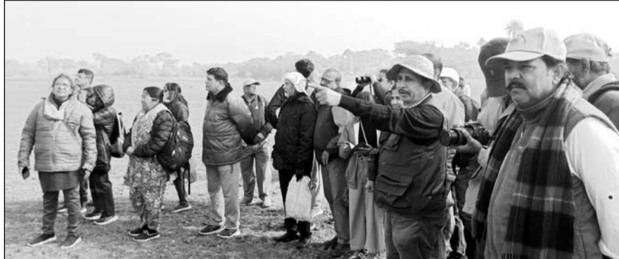
पक्षी प्रेमियों ने परिदों की अठखेलियों को अपने कैमरे में कैद किया।

एवं कहा कि सरकार जल्द इस तालाब में पानी की आवक के लिए नहर का अतिशोध निर्माण करें जिससे इस तालाब का परिदों के संरक्षण का पुराना स्वरूप बना रहे।