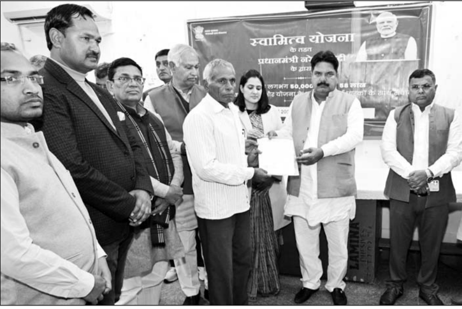
झुंझुनू के ग्रामीण इलाकों में वर्षों से जमीन के मालिकाना हक से वंचित लोगों को स्वामित्व योजना के तहत स्वामित्व कार्ड का वितरण किया गया।

झुंझुनू, (निसं)। ग्रामीण इलाकों में वर्षों से जमीन के मालिकाना हक से वंचित लोगों को स्वामित्व योजना के तहत स्वामित्व कार्ड का वितरण किया गया। झुंझुनू के सूचना केंद्र सभागार में जिला स्तरीय कार्यक्रम हुआ। कार्यक्रम के मुख्य अतिथि राजस्व उपनिवेशन एवं सैनिक कल्याण राज्य मंत्री विजय सिंह थे।