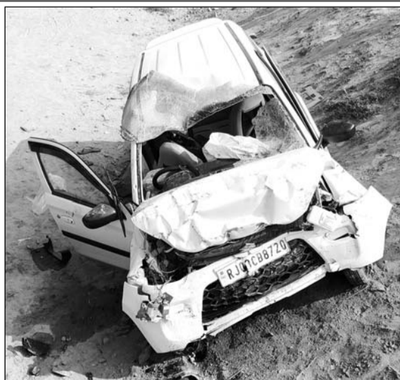
दीवार से टकराने के बाद कार क्षतिग्रस्त हो गई।

बांसवाड़ा, (निर्स)। आनंदपुरी कस्बे के नाना भुखिया गांव के पास स्टेट हाइवे-10 पर शुक्रवार रात्रि को विवाह समारोह से लौट रहे आनंदपुरी निवासी जैन परिवार की कार घर से दो किलोमीटर की दूरी पर सड़क किनारे दीवार से जा टकराई। हादसे में कार चालक व उसकी बेटी की मौत हो गई, जबकि पत्नी व बेटा गंभीर रूप से घायल हो गए।