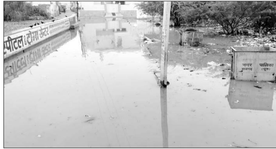
गंदे पानी की निकासी नहीं होने के कारण रास्ते में भरा गंदा पानी परेशानी का सबब बना हुआ है।