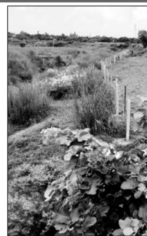
एक व्यक्ति ने अपनी जमीन को आगे बढ़ाते हुए नदी के बहाव क्षेत्र पर तारबंदी कर ली।

अलवर, (निस्)। मालाखेड़ा तहसील अन्तर्गत गांव महुआ के पास सोहनपुर गांव के पास से रूपारेल नदी निकल रही है वहां पर एक व्यक्ति ने अपनी जमीन को आगे बढ़ाते हुए नदी के बहाव क्षेत्र पर तारबंदी करते हुए मिट्टी डाल कर उसे खेती के लिए तैयार कर लिया है। ग्रामीणों का आरोप है कि, इस अतिक्रमण के कारण नदी का बहाव रूक जाएगा और अन्य गांवों में खेत सिंचाई करने में किसानों को पानी नहीं मिल पाएगा, आगे के क्षेत्रों में पानी की कमी उत्पन्न हो जाएगी। ग्रामीणों ने इसकी शिकायत मालाखेड़ा प्रशासन को दी है। मामला सामने आने के बाद जब यह प्रकरण सामने आया तो आरोप प्रत्यारोपों की झड़ी लग गई। मालाखेड़ा प्रशासन का इर कर्मचारी और अधिकारी अपने आपको बचाने में लगा हुआ है। ग्रामीणों ने अधिकारियों पर भ्रष्टाचार का आरोप लगाए। मामले के अनुसार गांव सोहनपुर के पास से एक नदी निकलती है जिसे रूपारेल कहा जाता है। यह नदी नटनी