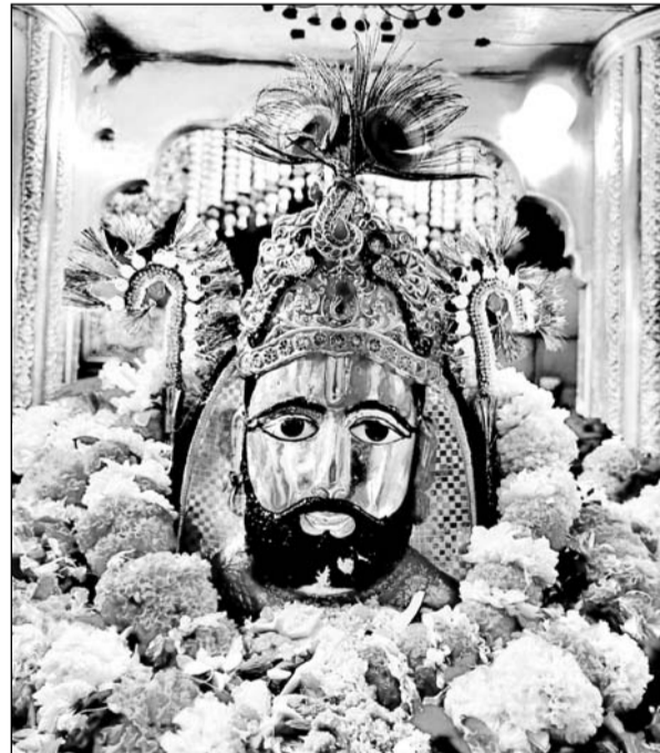
रामदेवरा में बाबा रामदेवजी की दूज पर भक्तों ने दर्शन किया।