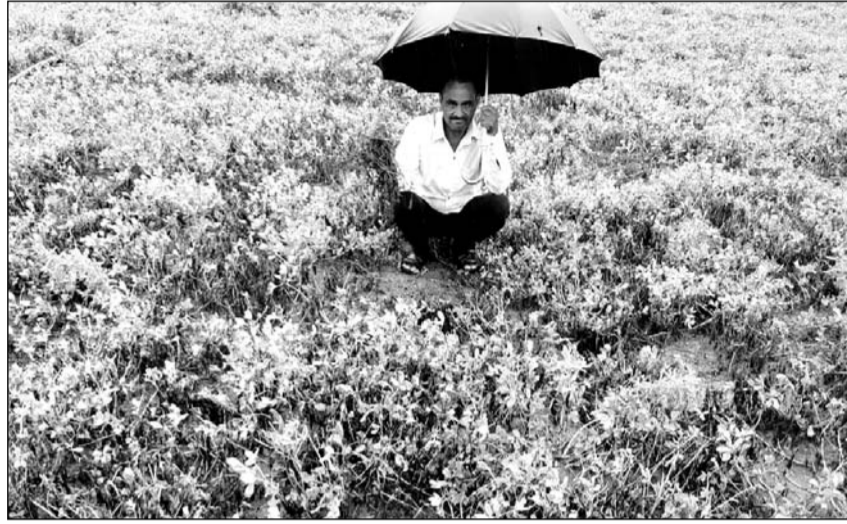
बारिश के कारण खराब हो रही फसल दिखाता किसान।

लेकिन इस बार समय पर बरसात न होने से फसले चौपट हो गई। अब लोगों से लिया हुआ कर्ज चुकाना भी मुश्किल है। अनेक किसानों ने अपने खेतों में बाजरी की लावणी (कटाई) कर ली है, लावणी की गई बाजरी की फसल जमीन पर पड़ी है। खेतों में बरसात का पानी भर जाने से कड़वी खराब होने के साथ-साथ बाजरी सिट्टो में काला पड़ रहा है। निकटवर्ती गाँव साण्डवा के