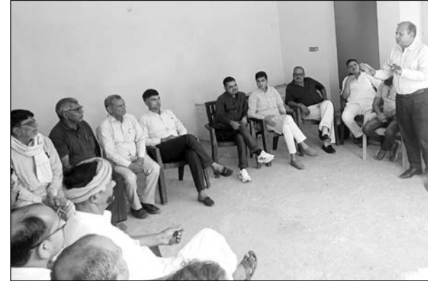
झुंझुनू बंद की तैयारियों को लेकर विभिन्न संगठनों के प्रतिनिधियों की बैठक हुई।

■ विश्व हिंदू परिषद के आह्वान पर विभिन्न हिंदूवादी संगठनों, बस, आटो, व्यापारिक व सामाजिक संगठनों की बैठक आयोजित