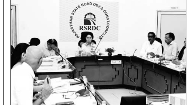
उपमुख्यमंत्री दिया कुमारी ने अध्यक्षता में आरएसआरडीसी की 128 वीं बोर्ड बैठक ली।