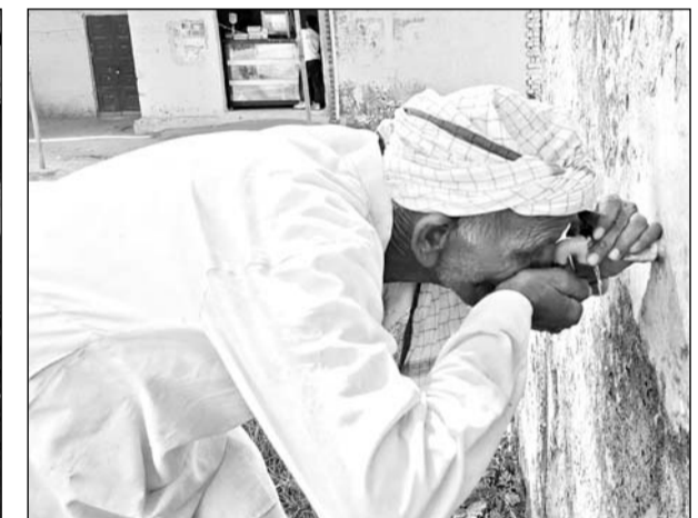
दशकों से झुंझुनू के शिवपुरा गांव में लोगों को पेयजल को लेकर भारी परेशानियों का सामना करना पड़ रहा है।

खेतों पर भी पड़ गई है। कई लोगों ने अपने खेत हरियाणा के लोगों के लिए दिए। हरियाणा के लोग अपनी हरियाणा की जमीन में खुदे ट्यूबवैल से उनके खेतों तक पानी लाकर फसल करते हैं। एक फिसस पैदावार खेत मालिक को देकर उनके खेतों तक को एक तरह से किराए पर ले लिया है। जिन