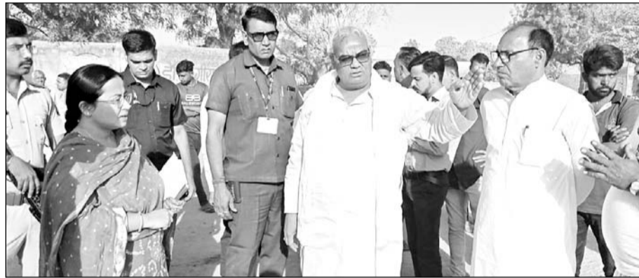
शिक्षा एवं पंचायतीराज मंत्री मदन दिलावर ने गांवों का दौरा कर जानकारी ली।