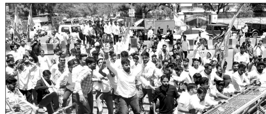
अजमेर में यूथ कांग्रेस की ओर से जिला कलेक्ट्रेट पर उग्र विरोध प्रदर्शन किया गया।

अजमेर, (कासं)। अजमेर में स्मार्ट सिटी प्रोजेक्ट के तहत हुए विभिन्न निर्माण कार्यों में कथित भ्रष्टाचार के विरोध में गुरुवार को यूथ कांग्रेस की ओर से जिला कलेक्ट्रेट पर उग्र विरोध प्रदर्शन किया। प्रदर्शनकारी कांग्रेसियों कार्यकर्ताओं ने कलेक्ट्रेट पर लगे बेरीकेड्स गिरा दिए और अंदर प्रवेश करने पर पुलिस से धक्का-मुक्की की गई। उग्र प्रदर्शन के मद्देनजर पुलिस ने हल्ला बल प्रयोग किया। यूथ कांग्रेस के प्रतिनिधि कलेक्टर चेम्बर पहुंचे और जिला कलेक्टर को ज्ञापन सौंप कर भ्रष्टाचार की जांच की मांग की।