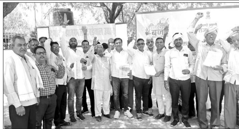
ट्रक व डंपर मालिकों ने झुंझुनू डीटीओ कार्यालय के बाहर प्रदर्शन किया।

जानकारी के अनुसार परिवहन विभाग और वाहन मालिकों के बीच टन गई है। ई-रवना के आधार पर पूरे प्रदेश में परिवहन विभाग ने वाहन मालिकों के पास ओवरलोडिंग के चालान भिजवाए थे, जिसमें ना केवल वाहन को चैक करवाने तथा राशि का 95 प्रतिशत एनमस्टी स्क्रीम में जमा करवाने की बात कही गई थी। कुछ वाहन मालिकों ने पैसा जमा करवाया और वाहनों को चैक भी करवा लिया, लेकिन 647 वाहन मालिक ऐसे थे, जो ना तो पैसे जमा करवा रहे हैं और