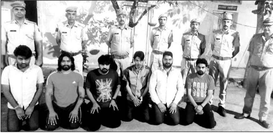
पुलिस ने आरोपी को छुड़ाने के मामले में आठ जनों को गिरफ्तार किया।

टीम द्वारा घटना स्थल के आसपास के सीसीटीवी फुटेज खंगालते हुए आरोपियों की पहचान करते हुए साइबर सेल से टेक्निकल साक्ष्य प्राप्त कर आरोपियों के छुपने के ठिकानों पर दबिश देते हुए आरोपी