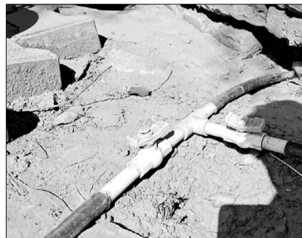
झुंझुनू जिले के शिवपुरा गांव में हरियाणा के लोग पाइप लाइन डालकर पानी की सप्लाई करते हैं।

झुंझुनू जिले के शिवपुरा गांव में जहाँ दशकों से जमीन में पानी नहीं है। ग्रामीण बूंद-बूंद पानी को लेकर भी तरस रहे हैं। सरकारी सिस्टम भी यहाँ पानी पहुंचाने में बेबस है। शिवपुरा गांव के लोगों ने खेती की आस छोड़ दी है। पशु भी पाले, ऐसी हिम्मत अब इनमें बची नहीं है। कारण है पानी। ग्रामीणों की मानें तो शिवपुरा ही नहीं, बल्कि हरियाणा बॉर्डर के लगभग गांवों में जमीन का पानी खत्म हो चुका है। 1000 से लेकर 1200 फीट तक भी जमीन खोदने के बाद भी बूंद तक पानी की नहीं निकलती। सरकारी पानी व्यवस्था यहाँ आकर फेल हो जाती है। यही कारण है कि अब हरियाणा के लोग राजस्थान की इस लाचारी का जमकर फायदा उठा रहे हैं। पड़ोस के हरियाणा में पानी का स्तर काफी अच्छा है। नहरी पानी भी मिलता है। ऐसे में अब हरियाणा के लोगों ने अपनी परसल पाइप लाइन इन गांवों तक पहुंचा दी है। दो से 10 किलोमीटर लंबी पाइप लाइन शिवपुरा जैसे गांवों में पहुंचाई गई है। घर-घर परसल लाइन से कनेक्शन दिए गए हैं। महीने के 300 से 400 रूपए वसूलने के बाद एक घंटे पानी देने का वादा किया जाता है, लेकिन असल में पानी आता