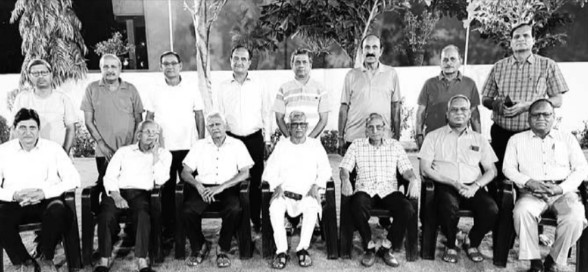
निर्माण नगर ए बी उत्तर पश्चिम नागरिक विकास समिति, जयपुर की ओर से शोक सभा का आयोजन किया गया।

जयपुर। निर्माण नगर ए बी उत्तर पश्चिम नागरिक विकास समिति, जयपुर द्वारा जम्मू-कश्मीर के पहलगाव में 22 अप्रैल को हुए भीषण आतंकी हमले में शहीद हुए निर्दोष पर्यटकों एवं नागरिकों की स्मृति में एक आपातकालीन शोक सभा का आयोजन किया गया। इस सभा में समिति के पदाधिकारियों, संरक्षकगण, वरिष्ठ नागरिकों एवं बड़ी संख्या में स्थानीय नागरिकों ने भाग लिया।