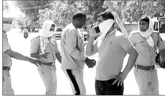
पुलिस ने मामले में आरोपी को गिरफ्तार किया।