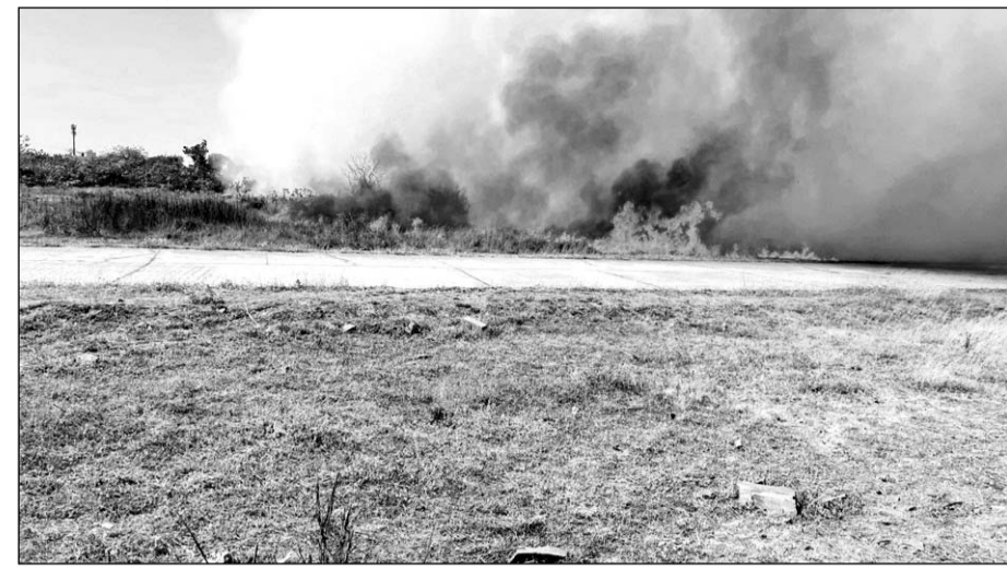
कोटा के एयरपोर्ट परिसर में लगी आग पर मशकत के बाद काबू पाया जा सका।

कोटा, (निर्स)। शहर के झालावाड़ रोड स्थित एयरपोर्ट पर गुरुवार को भीषण आग लगी। आग की लपटों ने एयरपोर्ट परिसर में ही बनी एक बिल्डिंग को चपेट में ले लिया। घटनास्थल के पास ही पेट्रोल पंप है, लेकिन गनीमत रही कि आग वहां तक नहीं पहुंची। इस बीच अग्निशमन की एक दर्जन दमकलें मौके पर पहुंचीं। उन्होंने 45 मिनट की मशकत के बाद आग पर काबू पाया।