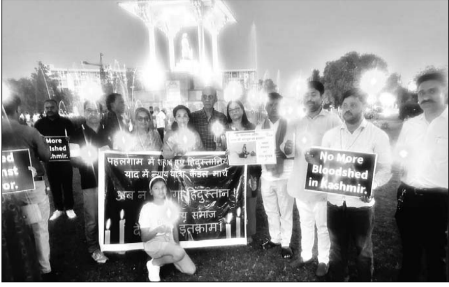
जम्मू-कश्मीर के पहलगाव में हुए आतंकी हमले में मारे गए 26 निर्दोष लोगों को श्रद्धांजलि देने के लिए लोगों ने स्टैच्यू सर्कल पर शोक सभा और कैंडल मार्च का आयोजन किया।