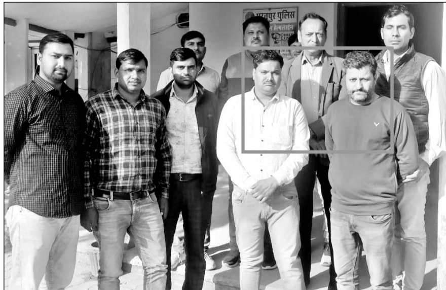
एसीबी भरतपुर की टीम ने पहाड़ी सीएचसी के डॉक्टर व दलाल को गिरफ्तार किया।