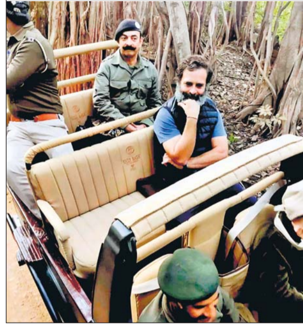
राजिव गांधी अपने 76वां जन्म दिन मनाते 37 साल बाद अपने बच्चों प्रियंका गांधी और राहुल गांधी के साथ रणथम्भौर आईं। सोनिया गांधी 1985 में अपने पति राजीव गांधी के साथ रणथम्भौर घूमने आई थीं।

प्रियंका और राहुल गांधी गुरुवार शाम जोगी महल पहुंचे, जहां सोनिया गांधी ने अपनी पुरानी यादें ताजा की, जब वे अपने पति राजीव गांधी के साथ यहां