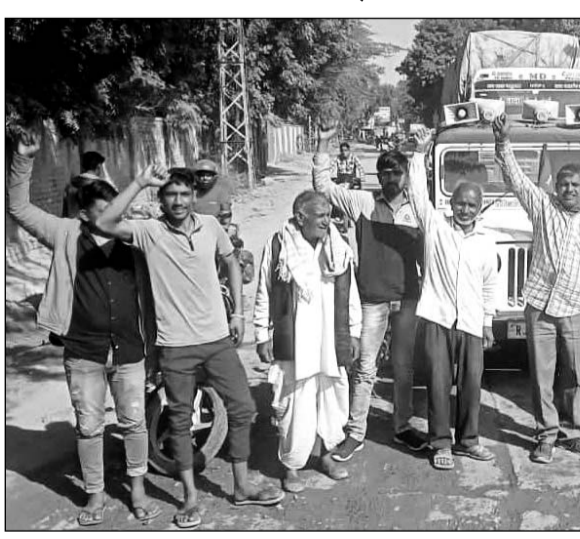
सड़क को रिपेयर करवाने की मांग को लेकर प्रदर्शन करते लोग।