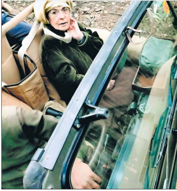
सोनिया गांधी अपना 76वां जन्म दिन मनाते 37 साल बाद अपने बच्चों प्रियंका गांधी और राहुल गांधी के साथ रणथम्भौर आईं। सोनिया गांधी 1985 में अपने पति राजीव गांधी के साथ रणथम्भौर घूमने आई थीं।

गांधी के साथ न्यू इयर सेलिब्रेट करने के लिए रणथम्भौर आई थीं। उस समय उनके साथ उनके परिवारिक मित्र अमिताभ बच्चन भी थे। करीब 37 साल बाद सोनिया गांधी अपने बच्चों प्रियंका गांधी और राहुल गांधी के साथ रणथम्भौर आई हैं, जहां उनका जन्मदिन मनाया गया। सोनिया,