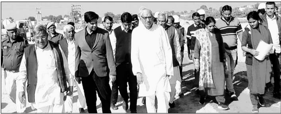
समसपुर में निर्माणधीन मेडिकल कॉलेज का परिवहन मंत्री बृजेंद्र ओला ( बीच में ) ने निरीक्षण किया।

झुंझुनू, (निसं)। झुंझुनू जिले के लिए मेडिकल कॉलेज से जुड़ी एक और अच्छी खबर है। परिवहन मंत्री बृजेंद्र ओला ने विश्वास व्यक्त किया है कि अगले साल 2023 में झुंझुनू के मेडिकल कॉलेज के लिए मेडिकल स्टूडेंट्स का पहला बैच आ जाएगा। यही नहीं राज्य सरकार ने मेडिकल कॉलेज के निर्माण के लिए जो समय सीमा तय की है। उसी समय सीमा में इसका काम भी पूरा होगा।