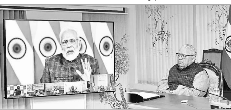
राज्यपाल कलराज मिश्र ने जी-20 की तैयारी बैठक में ऑनलाइन भाग लिया।

जयपुर, (का.सं.)। राज्यपाल कलराज मिश्र ने शुक्रवार को जी 20 की अध्यक्षता की तैयारी के संबंध में प्रधानमंत्री नरेन्द्र मोदी के नेतृत्व में आयोजित बैठक में राजभवन से ऑनलाइन भाग लिया।