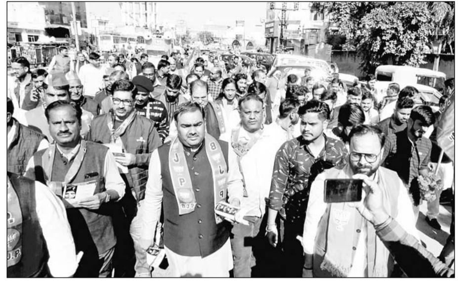
भाजपा के संगठन महामंत्री चंद्रशेखर ने शुक्रवार को विद्याधर नगर विधानसभा में जन आक्रोश यात्रा के दौरान जनसंपर्क किया।

जयपुर। भाजपा जयपुर शहर की सभी विधानसभाओं में भाजपा के कार्यकर्ता बंद-चढ़कर हिस्सा ले रहे हैं। भाजपा जन आक्रोश यात्रा के दौरान भाजपा द्वारा जारी मिस्ट्र कॉल नंबर पर आम जनता द्वारा मिस कॉल कर भाग लिया जा रहा है।