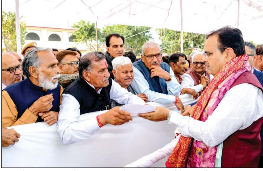
मुख्यमंत्री भजनलाल शर्मा शनिवार को भरतपुर दौरे पर रहे। जिले के विभिन्न सामाजिक संगठनों व आमजन ने सर्किट हाउस में उनसे मुलाकात की और बजट में भरतपुर एवं डींग जिले को दी गई सौगातों के लिए आभार जताया।

मुख्यमंत्री ने सर्किट हाउस में जनसुनवाई भी की और संबंधित अधिकारियों को आमजन की समस्याओं के शीघ्र निस्तारण के निर्देश