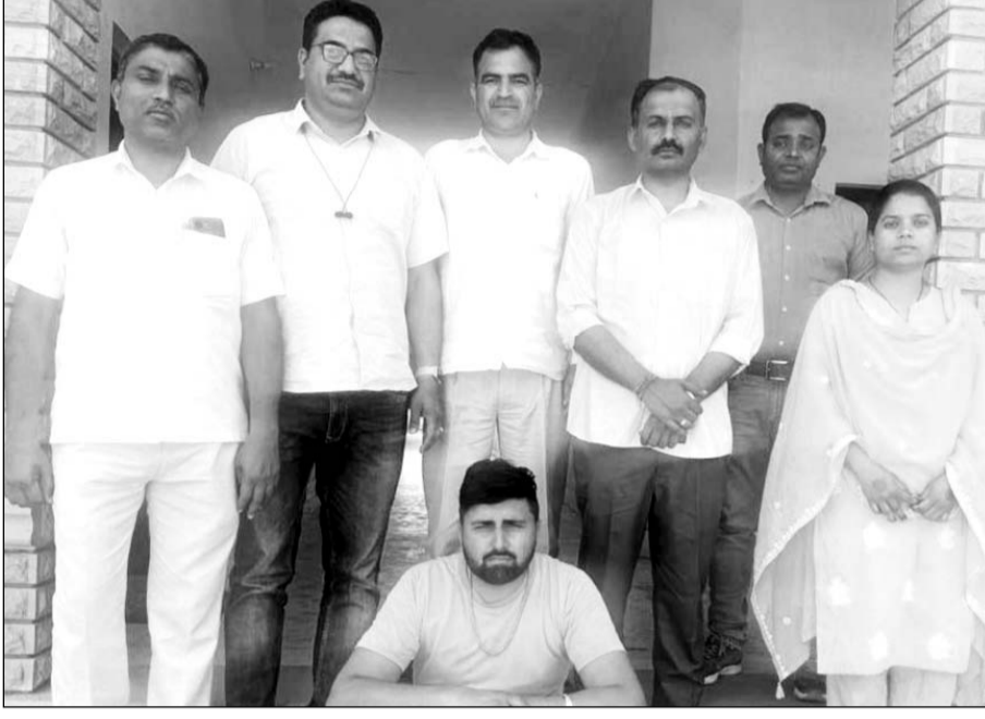
श्रीगंगानगर जिले की पुलिस ने पंजाब का हेरोइन तस्कर को गिरफ्तार किया।