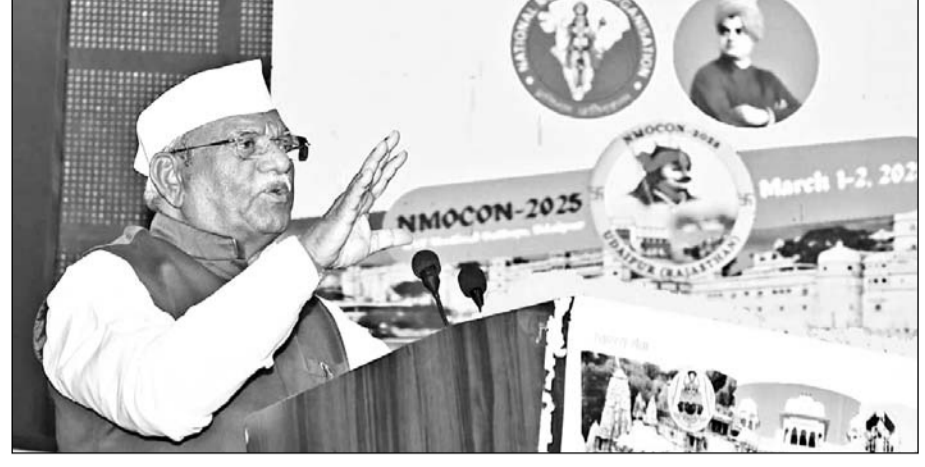
राज्यपाल हरिभाऊ किशनराव बागडे ने उदयपुर में अधिवेशन को सम्बोधित किया।

उदयपुर, (कांस)। राज्यपाल हरिभाऊ किशनराव बागडे ने कहा कि आम समाज के लिए चिकित्सक भगवान के समान होते हैं। व्यक्ति की चिकित्सा के प्रति श्रद्धा और आत्मीय भाव अत्यंत महत्वपूर्ण है, क्योंकि वह चिकित्सक की सलाह पर पूरी आस्था रखता है। ऐसे में चिकित्सक की जिम्मेदारी अहम हो जाती है।