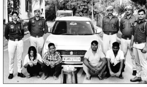
बगरू थाना पुलिस ने कार्रवाई करते हुए 22 फरवरी को प्रेम प्रसंग में बाधा बन रहे पिता पर फायरिंग करवाने वाला पुत्र व उसकी प्रेमिका सहित चार आरोपियों को गिरफ्तार किया गया है।

जयपुर। बगरू थाना पुलिस ने कार्रवाई करते हुए 22 फरवरी को प्रेम प्रसंग में बाधा बन रहे पिता पर फायरिंग करवाने वाला पुत्र व उसकी प्रेमिका सहित चार आरोपियों को गिरफ्तार किया गया है। साथ ही पुलिस ने गिरफ्तार आरोपियों के कब्जे से वारदात में प्रयुक्त हथियार एक देशी कट्टा, 4 जिन्दा कारतूस, 1 खाली केस व वाहन कार स्विच कार भी बरामद की है। फिलहाल आरोपियों से पूछताछ की जा रही है।