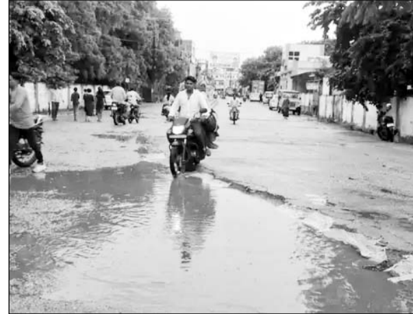
गंगापुर सिटी में बरसात होने से सड़क पर पानी भर गया।

■ किसान भी बारिश नहीं होने से खरीफ की बाजरा और तिल की फसलों को लेकर चिंतित थे बारिश नहीं होने से फसलें सूखने के कगार पर पहुंची