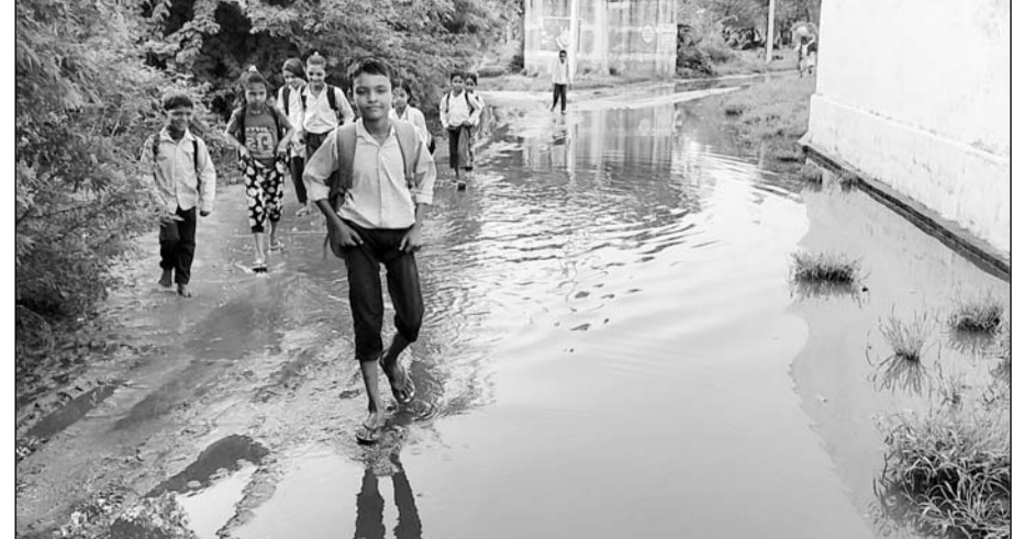
गंगापुर सिटी में कीचड़ में से होकर स्कूल जाते विद्यार्थी।