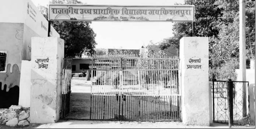
पीपलू क्षेत्र के जयकिशनपुरा का राजकीय उच्च प्राथमिक विद्यालय।