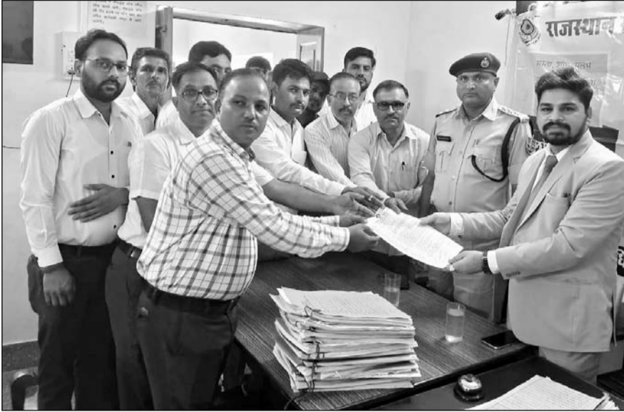
न्यायिक मजिस्ट्रेट को ज्ञापन सौंपते अधिवक्तागण।