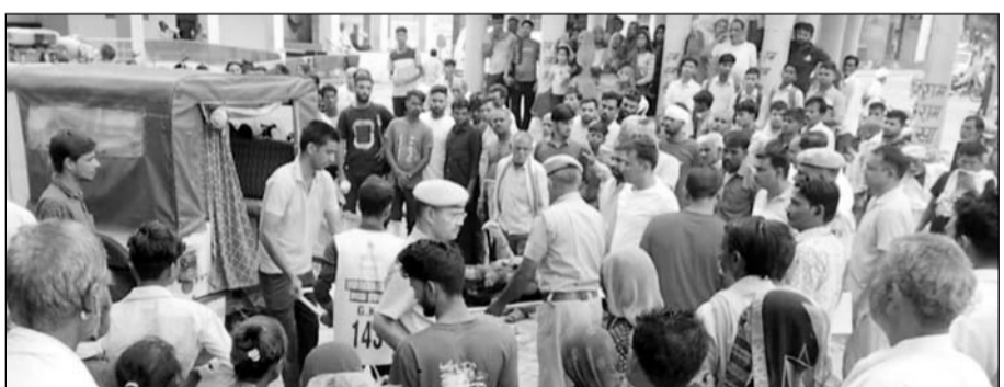
तालाब में महिला के शव को पुलिस ने निकलवाया।

मालपुरा, (नि.सं.)। धर्मनगरी डिग्गी के विजय सागर तालाब में शनिवार की सुबह एक महिला का शव मिलने से क्षेत्र में सनसनी फैल गई।