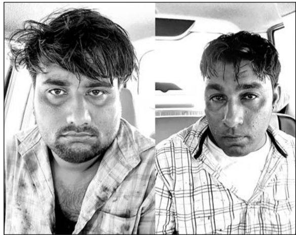
पुलिस गिरफ्त में दो तस्कर।

जयपुर/चित्तौड़गढ़। संगठित अपराध के विरुद्ध सीआईडी क्राइम ब्रांच पुलिस मुख्यालय की टीम ने लगातार कार्रवाई करते हुए चित्तौड़गढ़ जिले के बेंगु थाना क्षेत्र में मादक पदार्थों की बड़ी खेप पकड़ी है। स्थानीय पुलिस के सहयोग से रामपुरिया गांव में दबिश देकर दो तस्करों को डिटेन कर 75 लाख कीमत की 2 किलो अफीम, 8 किलो अफीम का 260 लीटर घोल, 24 किलो अफीम डोडा-चूरा समेत एक स्कॉर्पियो, तीन बाइक और दो मोबाइल जब्त किये गये।