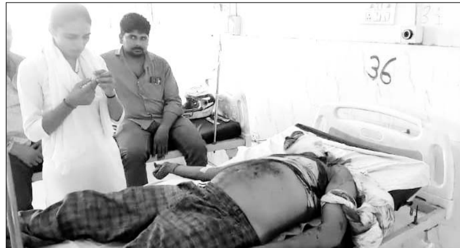
घायलों को अस्पताल में भर्ती कराया।

सड़क हादसे में कांवड़ियों की मौत, एक दर्जन घायल