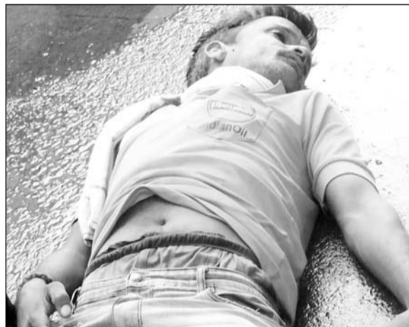
भीलवाड़ा के सुभाष नगर थाना क्षेत्र में रोडवेज बस स्टैंड परिसर स्थित गन्ने की चरखी के निकट करंट से दो लोगों की मौत हो गई।

भीलवाड़ा, (निसं)। शहर के सुभाष नगर थाना क्षेत्र में रोडवेज बस स्टैंड परिसर स्थित गन्ने की चरखी के निकट करंट लगने से दो लोगों की मौत हो गई। मृतकों को परिजनों ने मुआवजे की मांग को लेकर एएजी मोर्चरी के बाहर जमकर हंगामा किया।