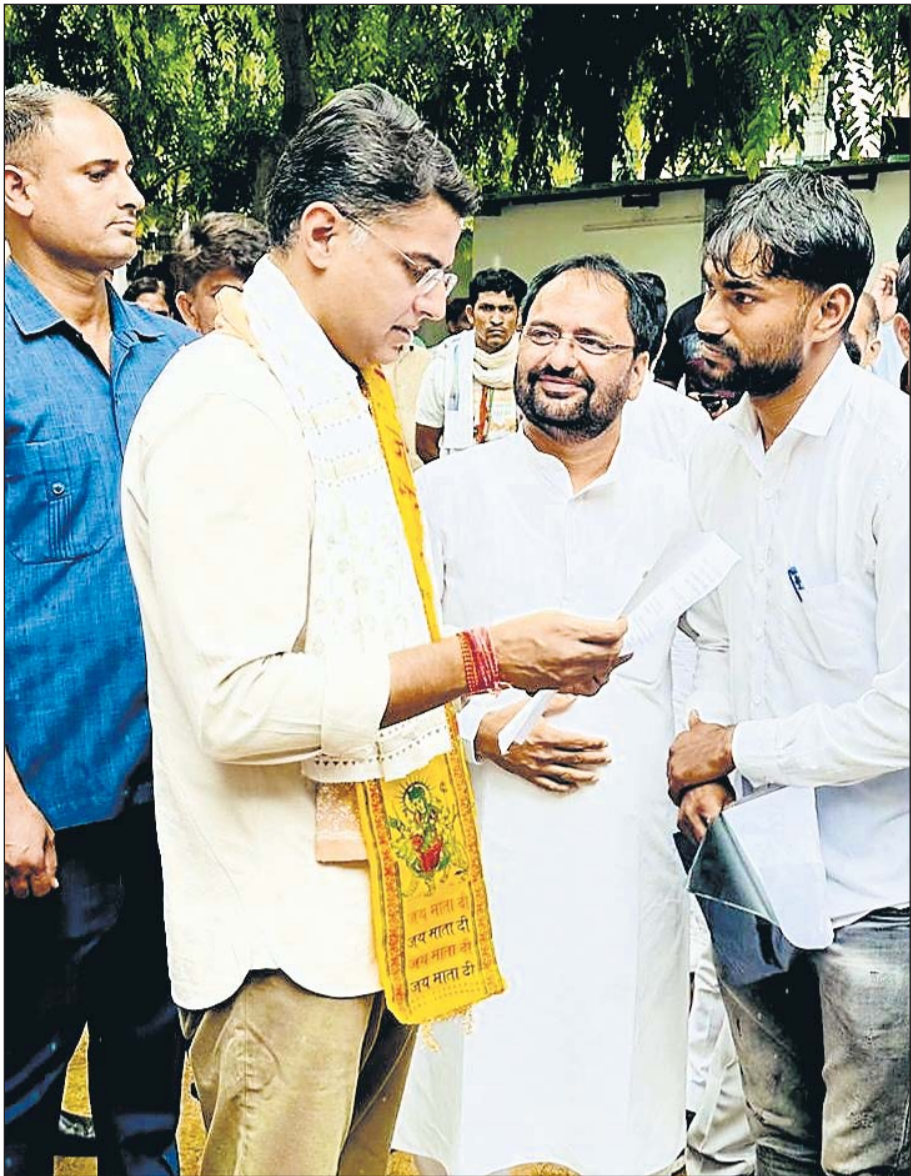
सचिन पायलट ने बुधवार सुबह अपने निवास पर प्रदेश के विभिन्न हिस्सों से आए कार्यकर्ताओं से मुलाकात कर उनकी समस्याएँ सुनीं।