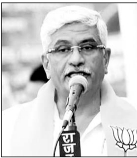
केंद्रीय जलशक्ति मंत्री गजेंद्र सिंह शेखावत ने प्रेस वार्ता की।