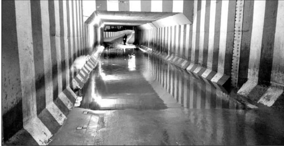
फुलेरा अण्डरपास में बारिश का पानी भरा रहने से राहगीर परेशान।

फुलेरा, (निर्स)। रेल नगरी फुलेरा के फुलेरा-मेड़ता रेल मार्ग पर स्थित एल सी गेट नम्बर 1 पर प्रशासन द्वारा बनाया गया अण्डरपास बारिश के दिनों में प्रशासन की अनदेखी का शिकार हो रहा है।