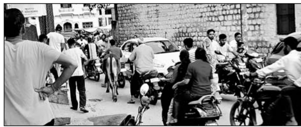
फुलेरा में आम रास्तों पर आवारा गौवंश के जमावड़े से लोगों को बहुत परेशानी हो रही है।

हर रोज कई बेकसूर जन्दिगीयां मौत के मुंह में जाते-जाते बच जाती हैं। इसका मुख्य कारण यह है कि वाहन चालकों द्वारा वाहन चलाने के दौरान सड़क पर घूम रहे आवारा पशुओं को बचाने के चक्कर में किसी दूसरे वाहन या व्यक्ति से जाकर टकरा जाते हैं। कई बार तो टक्कर इतनी तेज होती है कि इस दौरान सड़क दुर्घटना में किसी ना किसी की मृत्यु हो जाती है। इस कारण भरे पूरे परिवार में मातम छा जाता है। कभी-कभी तो वाहन दुर्घटना में स्वयं आवारा पशु भी मौत के घाट उतर जाते हैं। इसके साथ ही जान व माल दोनों को ही नुकसान पहुंचता है। फुलेरा क्षेत्र में आवारा मवेशियों को यह समस्या किसी एक व्यक्ति को ही नहीं है, बल्कि इनकी वजह से कई व्यक्ति और वाहन शिकार