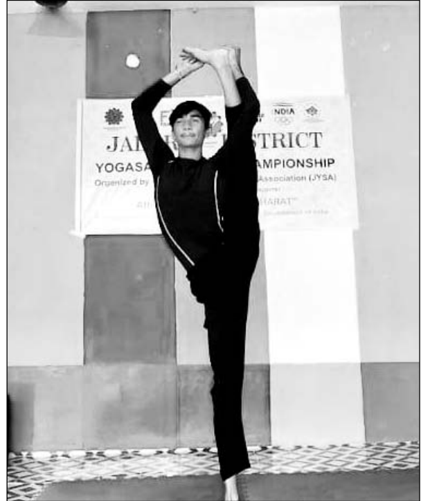
जालोर में जिला स्तरीय योगासन प्रतियोगिता में 150 खिलाड़ियों ने भाग लिया।

जालोर, (कासं)। जिला योगासन स्पोर्ट्स एसोसिएशन की ओर से जिला स्तरीय योगासन प्रतियोगिता का आयोजन हुआ।