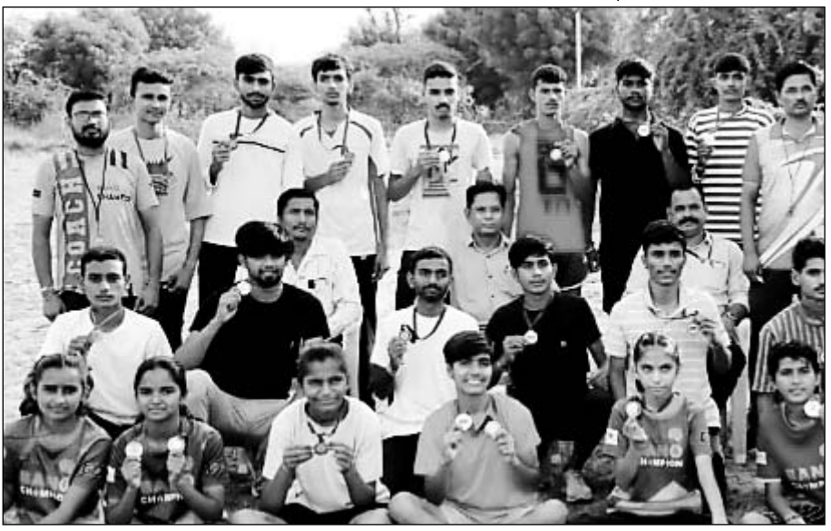
जालौर के निकट राजकीय उच्च माध्यमिक विद्यालय बादनवाडी में जिला स्तरीय एथलेटिक्स प्रतियोगिता के विजेताओं को अतिथियों ने पुरस्कार प्रदान किए।

बालकों के 20 वर्ष आयुवर्ग की मस्तिष्क निवास करता है, इसलिये हर बच्चे को किसी न किसी खेल का नियमित अभ्यास करना चाहिए।