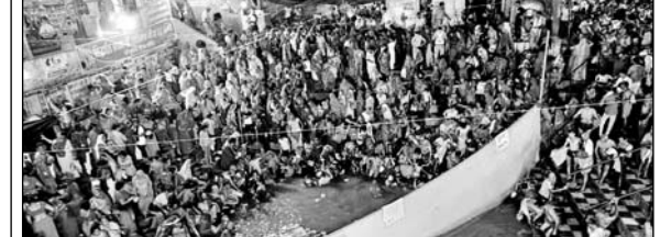
24 कोसीय परिक्रमा पूर्ण करने के बाद श्रद्धालुओं ने डूबकी लगाई।

नवलगढ़, (निसं)। मालकेतु की 24 कोसीय परिक्रमा पूर्ण करके लाखों की संख्या में परिक्रमार्थी व अन्य श्रद्धालुओं ने तीर्थराज लोहागल धाम सूर्यकुंड में सोमवती अमावस्या पर आस्था की डूबकी लगाई। इसी के साथ लोहागल में सोमवार को दो दिवसीय लखड़ी मेला शुरू हुआ जो मंगलवार तक चलेगा।