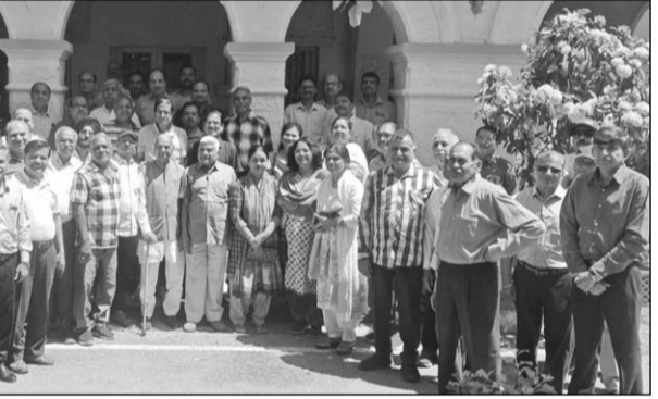
कोटा में सौ से अधिक आक्रोशित पेंशनर ने एसपी को ज्ञापन सौंपा।