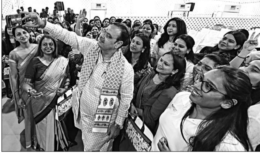
मुख्यमंत्री आवास पर आयोजित नारी शक्ति वंदन कार्यक्रम में पहुंची महिलाओं और छात्राओं के साथ सीएम भजनलाल शर्मा ने मोबाइल में सेल्फी ली।

जयपुर (कांस)। मुख्यमंत्री भजनलाल शर्मा ने कहा कि यशस्वी प्रधानमंत्री नरेन्द्र मोदी के नेतृत्व में विकसित भारत के संकल्प के साथ देश आगे बढ़ रहा है और नारी शक्ति इसके केंद्र में है। केंद्र सरकार ने नारी शक्ति वंदन अधिनियम के माध्यम से विधानसभा और लोकसभा में महिलाओं के लिए 33 प्रतिशत आरक्षण का मार्ग प्रशस्त किया है। इससे इनकी राजनीति में अधिक से अधिक भागीदारी सुनिश्चित होगी। उन्होंने कहा कि हमारी डबल इंजन सरकार ने महिला सशक्तिकरण को जीवन के प्रत्येक पहलू से जोड़ा है। उन्होंने महिलाओं को प्रोत्साहित करते हुए कहा कि आप अपने सपनों को पंख दीजिए, हमारी सरकार आपके साथ खड़ी है। शर्मा शुक्रवार को मुख्यमंत्री आवास पर आयोजित नारी शक्ति वंदन कार्यक्रम को संबोधित कर रहे थे।