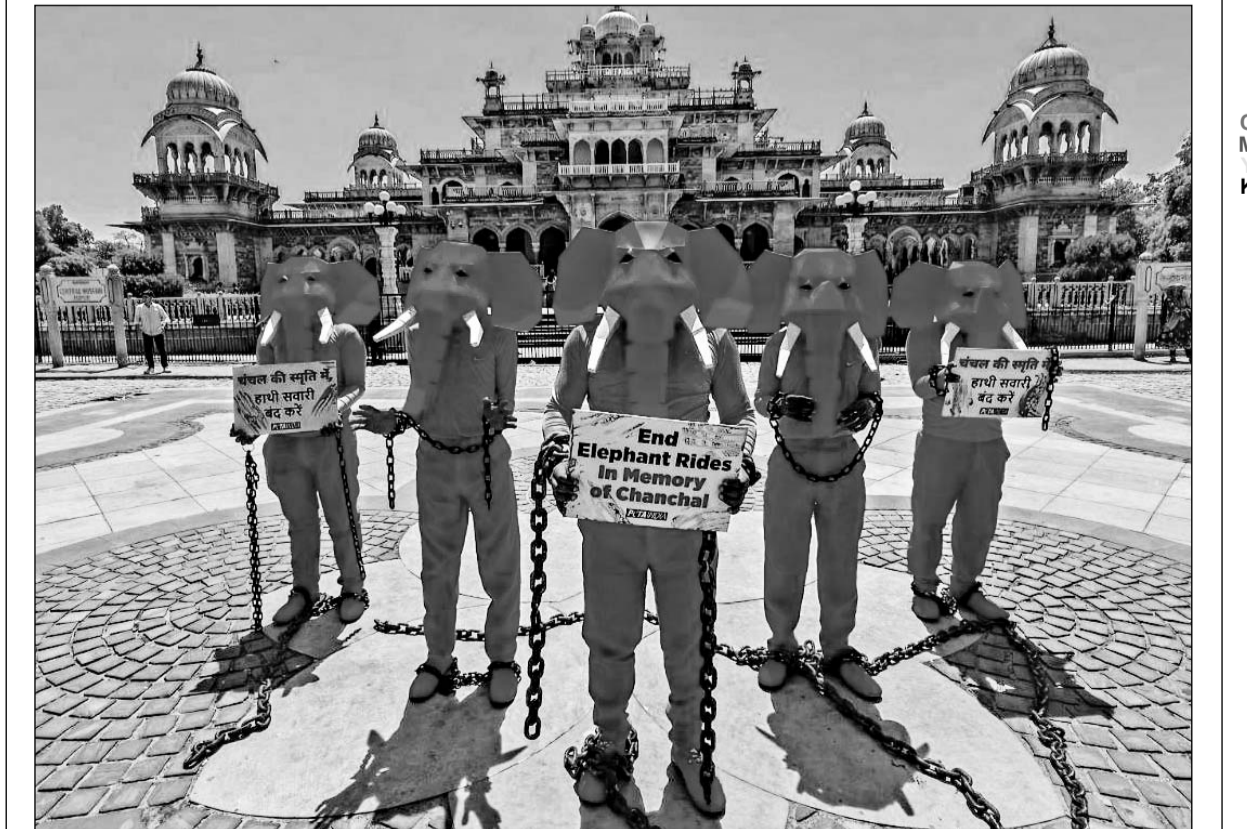
राजधानी जयपुर में हथिनी चंचल को गुलाबी रंगने और उसके बाद विदेशी फोटोग्राफर द्वारा फोटोशूट किये जाने के विरोध में शुक्रवार को घेटा द्वारा अलबर्ट हाल पर प्रदर्शन किया गया। ज्ञात रहे कि यह फोटोशूट करीब 1 साल पहले हुआ था, हथिनी चंचल की मौत भी हो चुकी है। पिछले दिनों जब यह तस्वीरें सोशल मीडिया पर सामने आयी थी, उसके बाद जमकर विवाद उपजा था। फोटो-राष्ट्रत