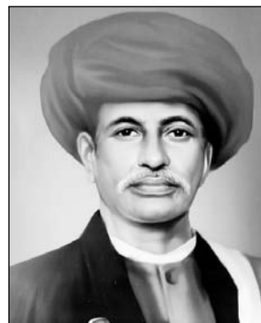
महात्मा ज्योतिबा फुले

हवा। असल में वर्ष 1848 में उनके साथ एक ऐसी घटना घटी जिसने उन्हें झकझोर दिया। वह अपने एक मित्र के विवाह में शामिल होने के लिए गए थे। मित्र उच्च कुल का था और विवाह समारोह में उनके साथ अपमानित व्यवहार हुआ। उन्होंने तभी तय कर लिया जाया कि स्वयं ही इस कुप्रथा को वह जड़ से समाप्त करेंगे। यही बाद में हुआ भी। उन्होंने शुरुआत कहीं और से नहीं अपने ही घर से की। दलितों को अपने घर के कुएं को प्रयोग करने की अनुमति दे दी। दलितों और महिलाओं में अंधविश्वास के कारण उत्पन्न हुई आर्थिक और सामाजिक विसंगतियों को दूर करने के लिए भी उन्होंने आंदोलन चलाया। उनका मानना था कि यदि आजादी, समानता, मानवता, आर्थिक न्याय, शोषणरहित मूल्यों और भाईचारे पर आधारित सामाजिक व्यवस्था का निर्माण करना है तो असमान और शोषक समाज को उखाड़ फेंकना होगा। ज्योतिबा फुले युग से आगे की सोच रखते थे, इसीलिए महिला