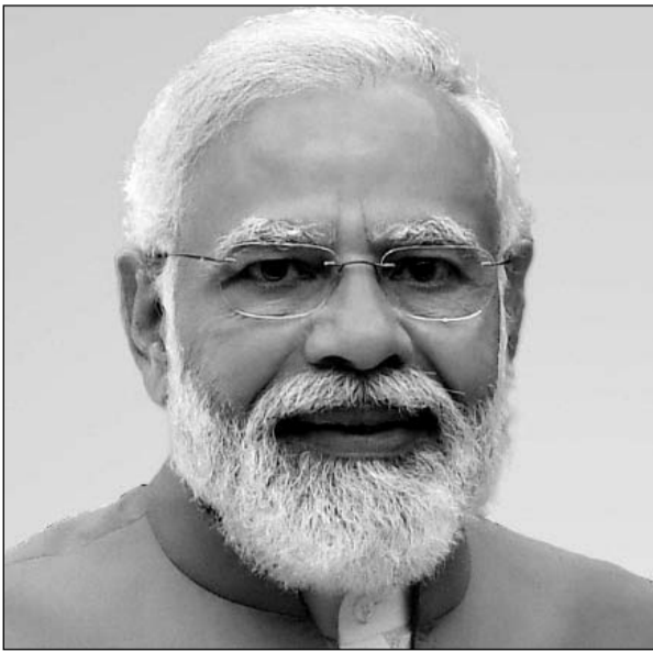
प्रधानमंत्री नरेन्द्र मोदी

महान समाज सुधारक महात्मा फुले का जीवन नैतिक साहस, आत्म चिंतन और समाज के हित के लिए अटूट समर्पण का प्रेरक उदाहरण है