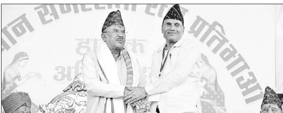
विधानसभाध्यक्ष वासुदेव देवनानी ने राजस्थान दिवस के मौके पर अंतर्राष्ट्रीय समरसता मंच और राष्ट्रीय समता स्वतंत्र मंच के संयुक्त तत्वावधान में आयोजित समरसता सांस्कृतिक समन्वय सम्मेलन को संबोधित किया। इस अवसर पर नेपाल के उपराष्ट्रपति न्यायमूर्ति परमानंद झा भी मौजूद रहे।

जयपुर। विधानसभा अध्यक्ष वासुदेव देवनानी ने कहा है कि भारत और नेपाल सामाजिक सांस्कृतिक समानताओं से जुड़े हैं। खुली सीमाएं और सीमा पर खुले प्रवासन ने दोनों देशों को सांस्कृतिक समझ को समृद्ध किया है। उन्होंने कहा कि तथाकथित सांस्कृतिक अतिक्रमण से नाजुक संतुलन को बनाए रखने का निरंतर प्रयास करना चाहिए। देवनानी ने राजस्थान दिवस के मौके पर आयोजित समारोह को संबोधित किया। अंतर्राष्ट्रीय समरसता मंच और राष्ट्रीय समता स्वतंत्र मंच के संयुक्त तत्वावधान में आयोजित समरसता सांस्कृतिक समन्वय सम्मेलन में नेपाल के उपराष्ट्रपति न्यायमूर्ति परमानंद झा भी मौजूद रहे। इस अवसर पर भारत के 13 राज्य व राजस्थान के सभी जिलों की प्रतिभाओं को सम्मानित किया गया। देवनानी को 22