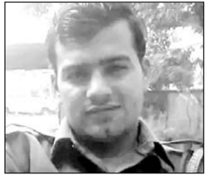
मृतक का फाइल फोटो।

अजमेर/ किशनगढ़, (कासं)। अजमेर पुलिस लाइन से किशनगढ़ के हरमाड़ा चौकी ड्यूटी जाईन करने बाइक पर जा रहे पुलिसकर्मी की देर रात 11 बजे के करीब कार से टक्कर हो जाने पर मौत हो गई। टक्कर से बाइक सवार पुलिसकर्मी सड़क किनारे गड़े में जा गिरा और रातभर घायल अवस्था में गड़े में ही पड़ा-पड़ा तड़पता रहा। रविवार अलसुबह वहां से गुजर रहे स्थानीय लोगों ने देखा तो पुलिस को सूचना दी। सूचना पर मौके पर पहुंची बांदर सिंदरी पुलिस ने शव को कब्जे में लेकर राजकीय यज्ञनारायण अस्पताल में रखवाया। सूचना पर अस्पताल पहुंचे परिजन की उपस्थिति में पुलिस ने पोस्टमार्टम की कार्यवाही कर शव परिजन के सुपुर्द कर दिया। पुलिस मामले की जांच में जुट गई है। मृतक पुलिसकर्मी जयपुर ग्रामीण का रहने वाला है।