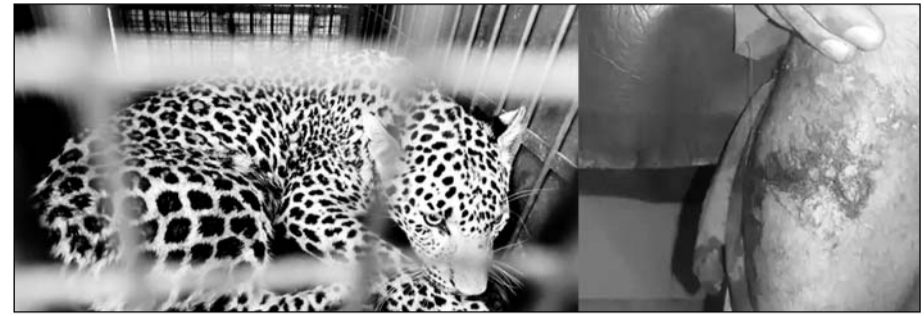
वन विभाग की टीम ने मौके पर पहुंचकर पैंथर को पींजरे में कैद किया।

हिम्मत से बची जान, लोगों के सहयोग से पैंथर को रस्सों से बांधा