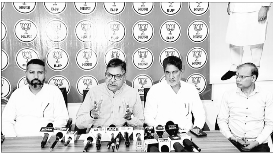
भाजपा हरियाणा के प्रदेश लोकसभा चुनाव प्रभारी डॉ. सतीश पूनिया ने रविवार को पंचकूला स्थित प्रदेश पार्टी कार्यालय पंचकमल में प्रसवार्ताओं को संबोधित किया।

चंडीगढ़/जयपुर। भाजपा हरियाणा प्रदेश लोकसभा चुनाव प्रभारी डॉ. सतीश पूनिया ने कहा कि कांग्रेस और केजरीवाल प्रलोभन की राजनीति करते हैं। भ्रष्टाचार में डूबी कांग्रेस और आम आदमी पार्टी चुनाव के समय में जनता को गुमराह करने की कोशिश करती है, लेकिन जनता इन लोगों को नीयत भांप चुकी है। डॉ. पूनिया ने कहा कि हरियाणा में पूर्व मुख्यमंत्री मनोहर लाल खट्टर से लेकर मुख्यमंत्री नायब सैनी के नेतृत्व में भाजपा सरकार ने करप्शन फ्री और कांग्रेस फ्री सरकार दी है, जो हरियाणा के विकास के लिये समर्पित है।