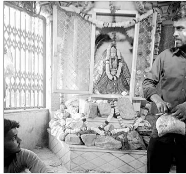
शीतला माता को महिलायें भोग लगाकर परिवार की सुख-समृद्धि की कामना करेंगी।

मान्यता के अनुसार शीतला माता के पूजन और ठंडा भोजन करने से माता प्रसन्न होती है और शीतला जनित रोगों का प्रकोप कम होता है। रविवार को माता को भोग लगाने के लिए घर-घर पकवानों की खुशबू महक रही थी। महिलाएं देर रात तक माता के भोग के लिए कांजी बड़ा, मोहथाल, गुजिया, पेठे, सकरपारे, पूड़ी, पापड़ी, हलुआ, राबड़ी, मक्का की घाट समेत कई व्यंजन बनाने में लगी हुई थी। भोग और पूजन की सामग्री की खरीदारी के कारण सुबह से ही बाजारों में रौनक बनी हुई है। शील की डूंगरी पर सत्संग के साथ दो दिवसीय शीतला माता के मेले