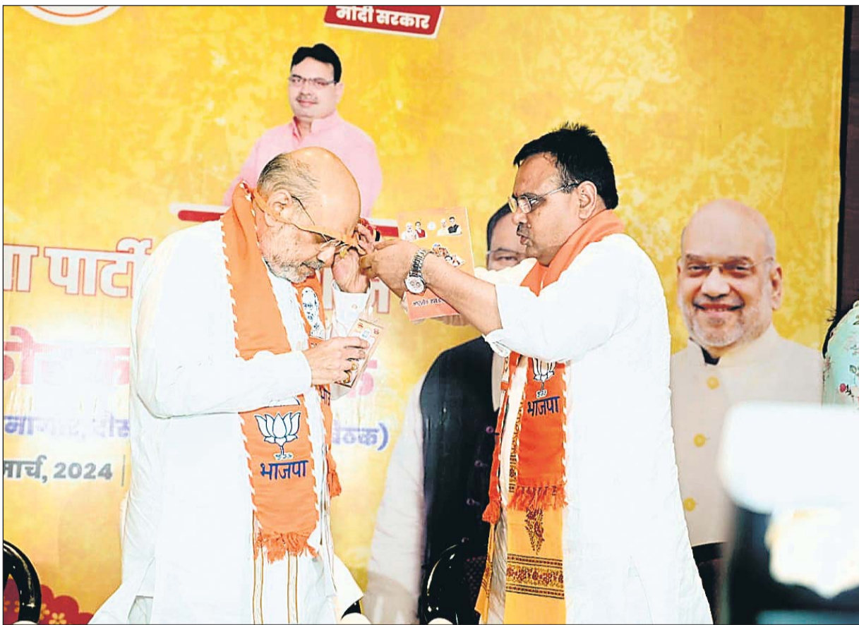
गृह मंत्री अमित शाह ने जयपुर के एक होटल में भाजपा कोर कमेटी सदस्यों की मीटिंग ली। मीटिंग के दौरान अमित शाह ने मुख्यमंत्री भजनलाल शर्मा से बातचीत करके चुनाव प्रचार कार्यक्रमों का फीडबैक लिया।