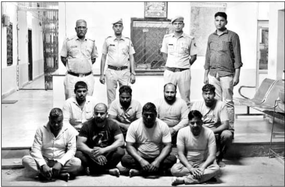
प्रताप नगर थाना पुलिस ने मामले का 24 घंटे में खुलासा कर आठ आरोपियों को गिरफ्तार किया।

कार में सवार सात-आठ व्यक्तियों ने बाइक सवार पर हमला किया था