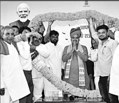
मुख्यमंत्री भजनलाल शर्मा का उनके निवास पर ओड समाज के लोगों ने स्वागत किया।

कार्यक्रम के दौरान मुख्यमंत्री ने पाक विस्थापित ओड समाज के लोगों की हरसंभव सहायता का आश्वासन देते हुए कहा कि राज्य सरकार उनके सामाजिक और शैक्षिक विकास के लिए प्रतिबद्ध है। मुख्यमंत्री ने प्रदेश सरकार द्वारा पेयजल और सिंचाई परियोजनाओं पर किए जा रहे कार्यों का उल्लेख करते हुए कहा कि किसानों