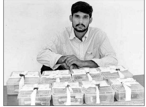
चंदवाजी थाना पुलिस ने अवैध हथियारों के साथ आरोपी को पकड़ा।

■ 4 स्वचालित पिस्टल मय 5 मैगजीन व 4 देशी कट्टे सहित 16 जिन्दा कारतूस जब्त