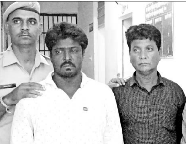
जिला स्पेशल और क्रिश्चियनगंज थाना पुलिस ने संयुक्त कार्यवाही करते हुए नकली सोने की ईंट बेचने वाले तीन शातिर ठगों को गिरफ्तार किया।