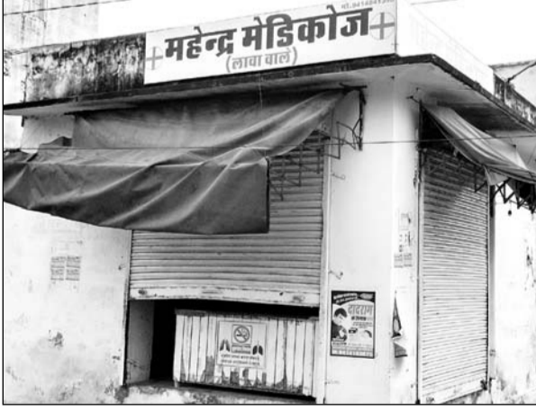
मंगलवार की रात को चोरों ने मालपुरा व लावा थाना क्षेत्रों में आधा दर्जन से अधिक दुकानों के ताले तोड़ चोरी की वारदात की।

शहर के पुराने अस्पताल के बाहर चोर मुख्य बाजार में महेन्द्र मेडिकल की दुकान का शटर तोड़ 10 हजार रुपये की नगदी व दवाईयां चुरा ले गये। दूसरी वारदात जयपुर रोड सरकारी अस्पताल गोबध पथ पन्द्रह दुकानों के पास परचून की दुकान लक्ष्य किरागा स्टोर में दो युवकों ने मध्य रात्रि में शटर तोड़ने का भरकस प्रयास किया था। इसी दौरान चुरा होने पर युवक भाग दूटे। दोनों युवक मुंह पर रुमाल बांधे हुए थे। सारा घटनाक्रम सीसीटीवी कैमरों में कैद हो गया।