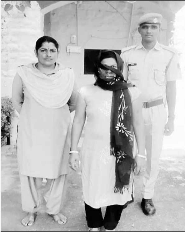
शाहजहांपुर थाना पुलिस ने फ्रॉड महिला को गिरफ्तार किया।