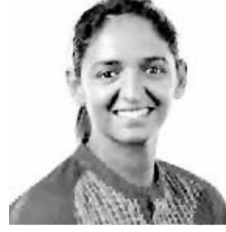
अपने लक्ष्य पर रखना है न कि उन चीजों पर जो हमारे नियंत्रण में नहीं हैं। हरमनप्रीत ने 13 जनवरी 2023 को शुरू होने वाले एफआईएच पुरुष हॉकी विश्व कप 2023 की तैयारी में आगामी खेलों के

बेंगलुरु, 31 अगस्ता। भारतीय पुरुष हॉकी टीम के कप्तान हरमनप्रीत सिंह ने एफआईएच पुरुष हॉकी विश्व कप 2023 के लिये आठ सितंबर को जारी होने वाले ड्राई से पहले कहा कि मुकाबला जिससे भी हो, टीम अपना सर्वश्रेष्ठ प्रदर्शन देगी। एफआईएच पुरुष हॉकी विश्व कप 2023 के लिए पूल ड्रा आठ सितंबर को जारी होंगे, जो यह निर्धारित करेंगे कि पूल स्टेज में कौन सी टीम किसका सामना करेगी। हरमनप्रीत ने बुधवार को ध्यान बयान में कहा, हम विश्व कप के ड्रा पर ज्यादा केंद्रित नहीं कर रहे हैं। हमें मैच खेलना है और अपना सर्वश्रेष्ठ प्रदर्शन करना है, चाहे हम किसी का भी सामना करें। हमें अपना खेल और अपनी ताकत दिखानी होगी और सकारात्मक परिणाम हासिल करने होंगे। हमें अपना ध्यान