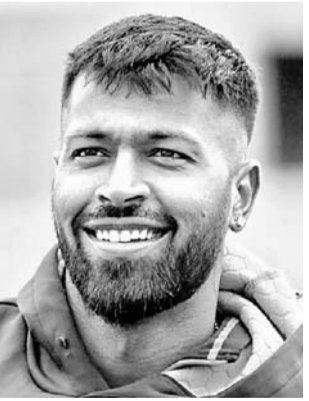
पहले स्थान पर हैं। पांड्या ने पाकिस्तान के खिलाफ गेंद से 25 रन के बाद

दुबई, 31 अगस्ता। भारत के विस्फोटक ऑरेंडारंडर हार्दिक पांड्या ने एशिया कप 2022 में पाकिस्तान के खिलाफ रविवार को शानदार प्रदर्शन की बदौलत आईसीसी रैंकिंग में छलांग लगायी है। आईसीसी द्वारा बुधवार को जारी ताज़ा रैंकिंग के अनुसार ऑरेंडारंडर रैंकिंग में क्रिकेट के कई धुरंधरों ने सुधार किया, परंतु पांड्या आठ पायदान की छलांग लगाकर पांचवें स्थान पर आ गये हैं, जो उनके करियर की सर्वश्रेष्ठ रैंकिंग है। पांड्या इस समय 167 रेटिंग के साथ आईसीसी रैंकिंग में पांचवें पायदान पर हैं, जबकि अफगानिस्तान के कप्तान मोहम्मद नबी 257 रेटिंग के साथ क्रिकेट की खेलाड़ियों के बीच लीड