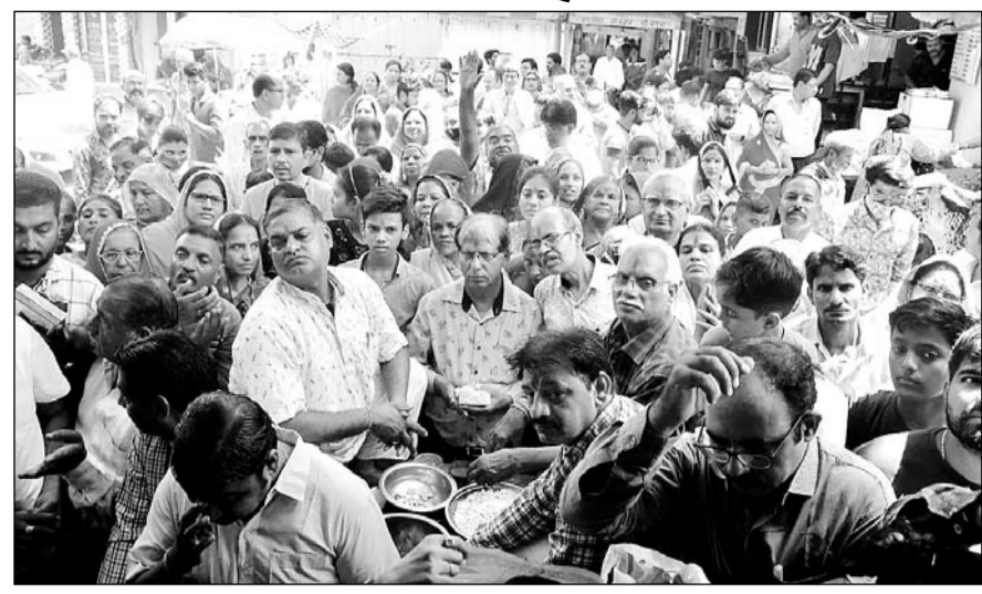
भगवान गणपति का जन्मोत्सव धूमधाम के साथ मनाया गया।