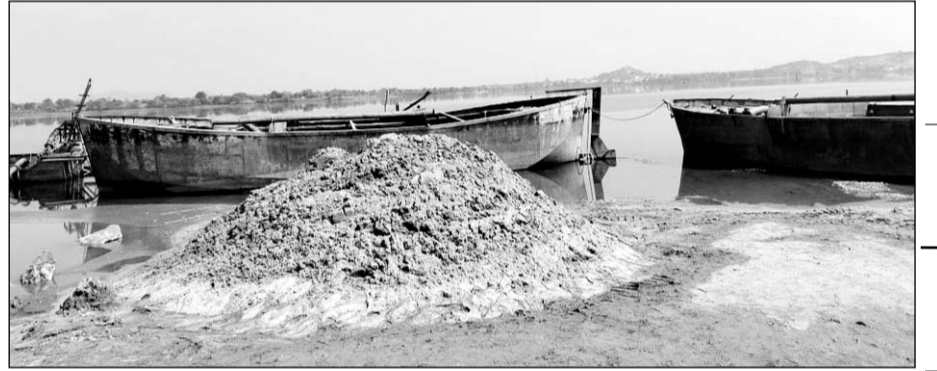
डीएसटी टीम ने अवैध बजरी निकालने पर दो नावों सहित बजरी भी जब्त की।

डुंगरपुर, (निर्सं)। सोम नदी के बैक वाटर एरिया में अवैध बजरी खनन के खिलाफ डीएसटी ने मंगलवार रात को कार्रवाई की। डीएसटी ने बजरी खनन करती हाईटेक नावों के साथ ही डंपर और बुलडोजर को जब्त किया है। अवैध बजरी खनन करने वाले माफिया रात के अंधेरे का फायदा उठाकर मौके से भाग गया।