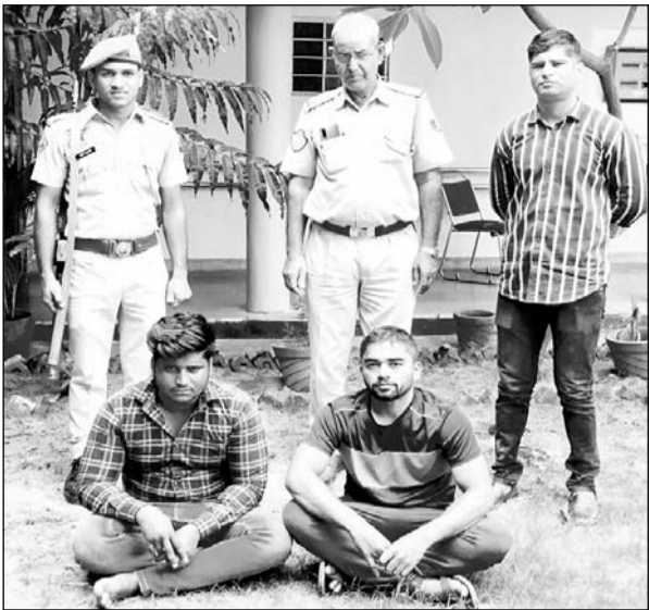
विधाघर नगर पुलिस ने ठगी के आरोपी सीजीएचएस विभाग के एलडीसी और उसके साथी को गिरफ्तार किया।

—कार्यालय संवाददाता— जयपुर। केन्द्रीय कर्मचारियों और पेंशनर्स से आजीवन हैल्थ कार्ड जारी करवाने के नाम पर करोड़ों रूपए की ठगी के खेल का विधाघर नगर पुलिस ने भंडाफोड़ किया है। पुलिस ने गिराह में शामिल सीजीएचएस विभाग के एलडीसी और उसके साथी को गिरफ्तार किया है। पुलिस आरोपियों से पूछताछ में जुटी है। बदमाश अब तक 146 लोगों को ठग चुके हैं, यह गोरखधंधा पिछले कई सालों से चला रहे थे। अब पुलिस सीजीएचएस विभाग में कार्यरत अन्य अफसरों व कार्मिकों की भूमिका जांचने में जुटी है।