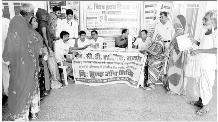
जिला प्रशासन एवं चिकित्सा विभाग जालौर के संयुक्त तत्वावधान में मरीजों के बीपी और शुगर की जांच कर हृदय रोग की जानकारी दी गई।

जालौर, (कासं)। जिला प्रशासन एवं चिकित्सा विभाग जालौर के संयुक्त तत्वावधान में एनसीडी क्लीनिक प्रमुख चिकित्सा अधिकारी सामान्य चिकित्सालय जालौर की ओर से गुरुवार को राष्ट्रीय मधुमेह एवं हृदय रोग, पक्षाघात बचाव नियंत्रण कार्यक्रम के अंतर्गत गुरुवार को विश्व हृदय दिवस पर चिकित्सालय में आने वाले मरीजों के बीपी और शुगर की जांच कर हृदय रोग के बारे में जानकारी दी गई।