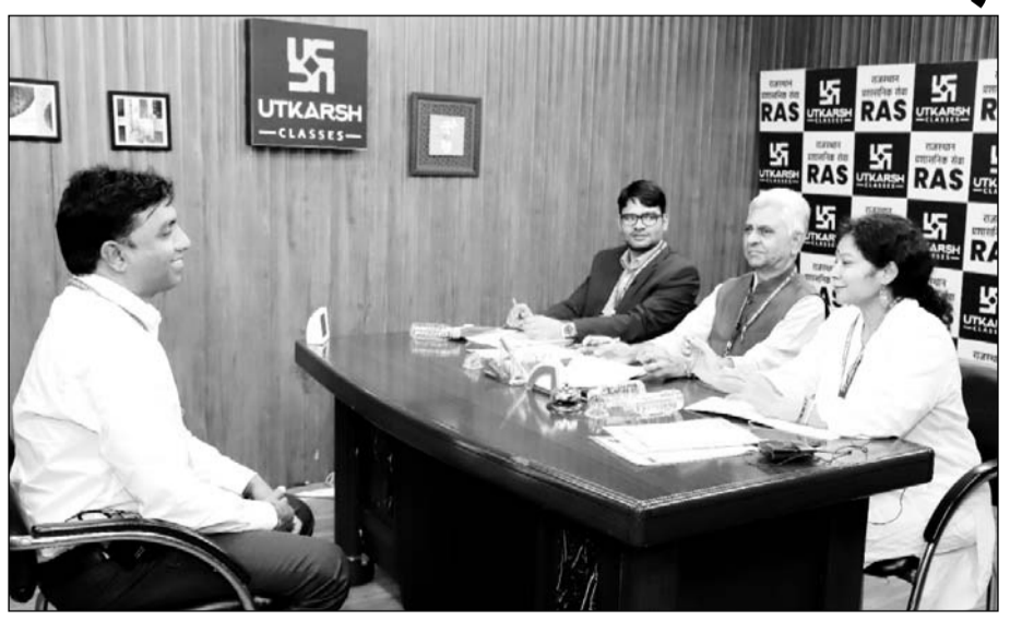
जोधपुर में उत्कर्ष की सात दिवसीय आर.ए.एस. मॉक इंटरव्यू कार्यशाला जारी है।