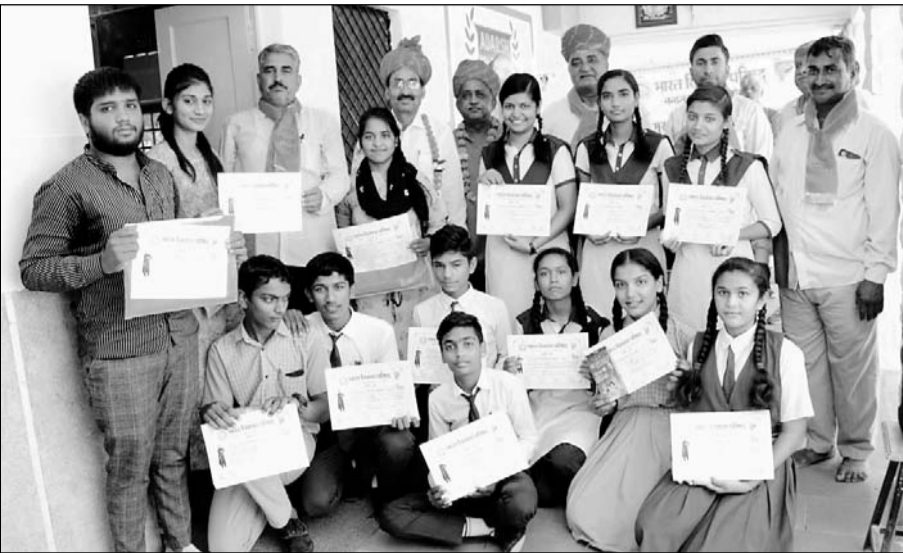
भारत विकास परिषद जोधपुर ने गुरु वंदन छात्र अभिनंदन व भारत जानो प्रतियोगिता का आयोजन किया तथा कक्षा में प्रथम स्थान प्राप्त करने वाले 17 छात्र-छात्राओं को सम्मानित किया गया।

जोधपुर, (कासं)। भारत विकास परिषद जोधपुर द्वारा गुरु वंदन छात्र अभिनंदन व भारत जानो प्रतियोगिता का आयोजन भारत विकास परिषद शाखा नंदनवन द्वारा आदर्श बाल उच्च माध्यमिक विद्यालय चोखा में एक कार्यक्रम आयोजित किया गया जिसमें कक्षा में प्रथम स्थान प्राप्त करने वाले 17 छात्र छात्राओं को सम्मानित किया गया व छात्रों द्वारा अपने गुरुजनों का सम्मान किया गया। तत्पश्चात छात्रों में भारत जानो प्रतियोगिता का आयोजन किया गया।