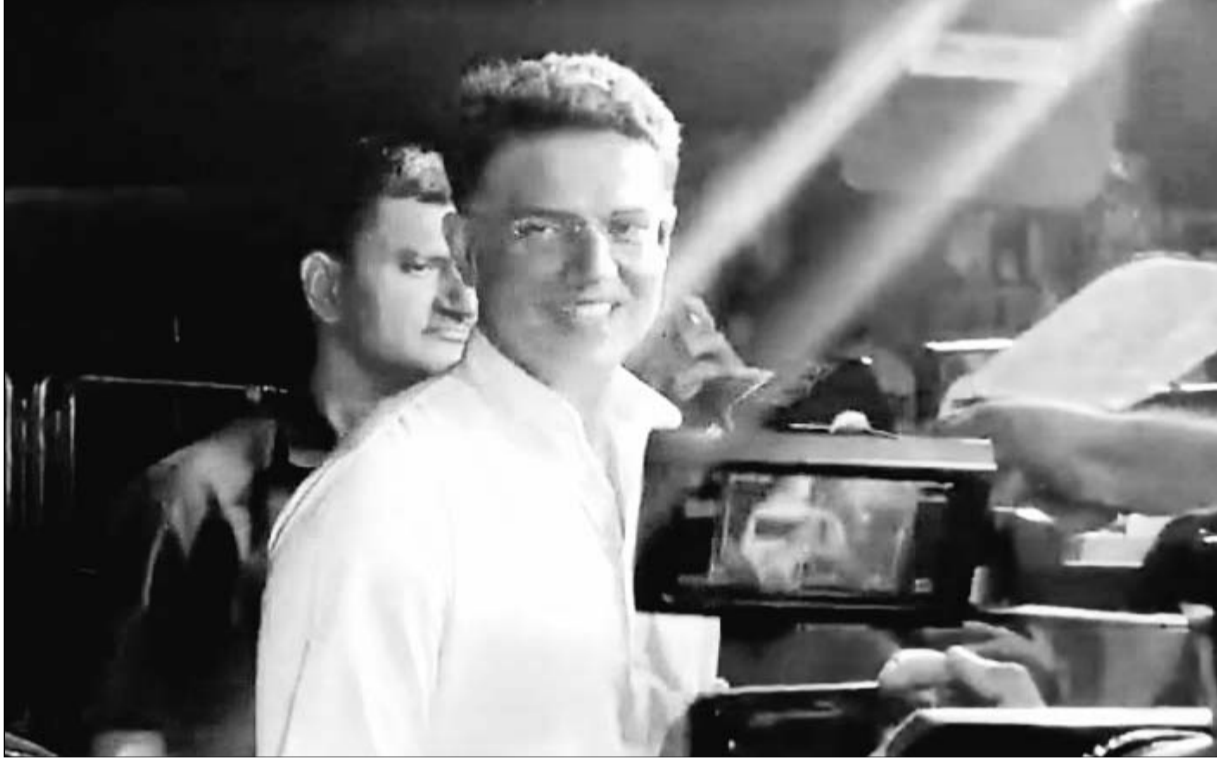
जैसा कि रेणु जी ने कहा है जो शब्दों में वर्णित नहीं हो सकता वह फोटो में अनायास ही जाहिर हो जाता है। सोनिया गांधी से मुलाकात के बाद प्रचारकों से बात करते हुए बेहद प्रफुल्लित नज़र आए सचिन पायलट।