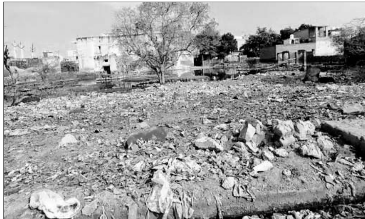
गोविंदगढ़ बस स्टैंड पर फैला कचरा।