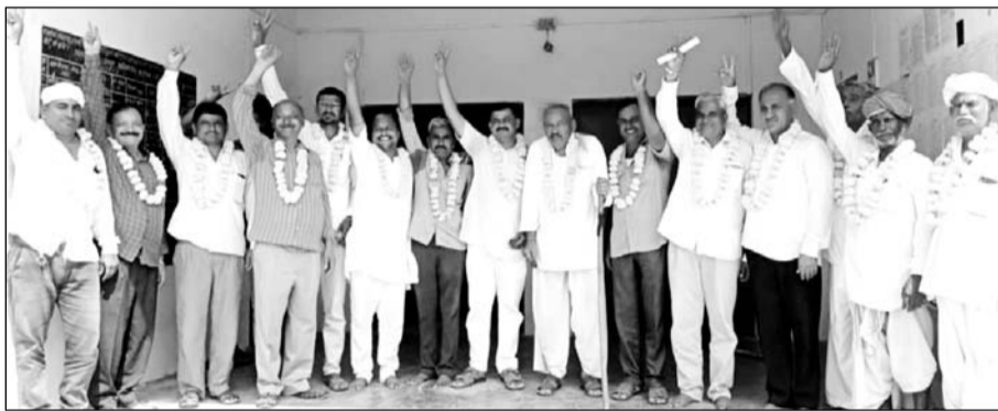
आदर्श ग्राम सेवा सहकारी समिति लिमिटेड रायपुर में अध्यक्ष, उपाध्यक्ष सहित सदस्य निर्विरोध चुने गये।

मंडार, (निसं)। सिरौही जिले में आदर्श ग्राम सेवा सहकारी समिति लिमिटेड रायपुर में अध्यक्ष, उपाध्यक्ष व सभी सदस्य निर्विरोध निर्वाचित चुने गये। गुरुवार को रायपुर आदर्श ग्राम सेवा सहकारी समिति रायपुर में पदाधिकारियों के चुनाव हुए।