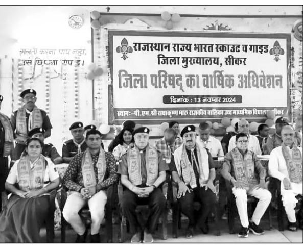
राजस्थान राज्य भारत स्काउट गाइड जिला सीकर में संपन्न हुआ।