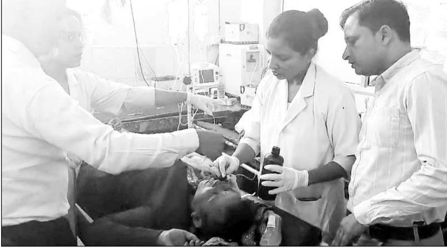
घायल महिलाओं को उपचार के लिए अस्पताल में भर्ती कराया।