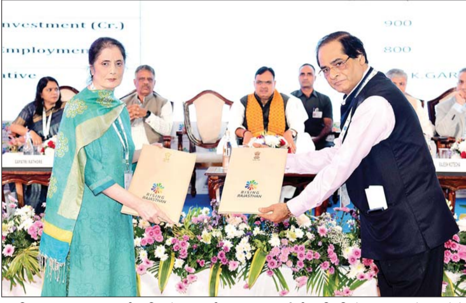
राइजिंग राजस्थान स्वास्थ्य प्री-समिट में मुख्यमंत्री भजनलाल शर्मा की उपस्थिति में 16,176 करोड़ रुपये के एम.ओ.यू. पर हस्ताक्षर हुए।

राइजिंग राजस्थान हैल्थ प्री-समिट में 16,176 करोड़ के एम.ओ.यू. साइन हुए