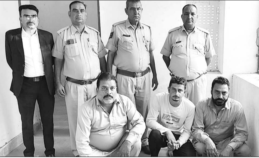
डोडा-पोस्त तस्करी मामले में आरोपियों को कोर्ट ने सजा सुनाई।

सादुलपुर, (निर्स)। अपर जिला सेशन न्यायाधीश क्रम सं.-2 राजगढ़ ने लगभग साढे नौ वर्ष पुराने डोडा-पोस्त चुरा तस्करी मामले में तीन आरोपियों को 7-7 साल कठोर कारावास की सजा से दंडित किया है।