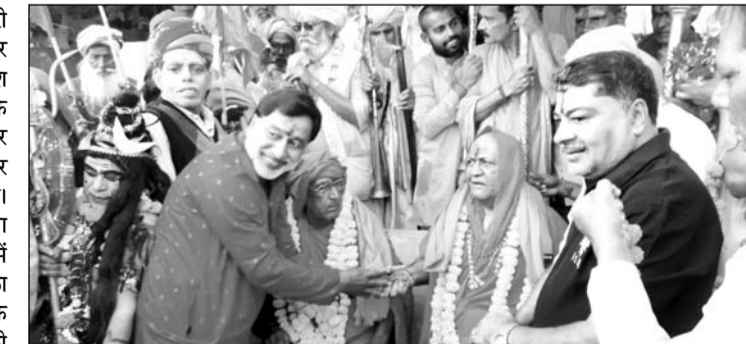
पुष्कर के सप्तऋषि घाट पर संतों ने शाही स्नान किया।

अजमेर/पुष्कर, (कासं)। तीर्थ नगरी पुष्कर में चले रहे अंतर्राष्ट्रीय पुष्कर मेले में गुरुआ चौराहे पर देश भर से आए साधु संतों ने सरोवर के सप्त ऋषि घाट पर शाही स्नान कर सम्पूर्ण मानव जाति के कल्याण और देश में खुशहाली की मनोकामना की। कार्तिक पूर्णिमा के पदम् योग के संयोग में शुक्रवार को पुष्कर सरोवर में महास्नान के साथ धार्मिक मेले का सामपन होगा। पूर्णिमा महास्नान के लिए श्रद्धालुओं का रैला गुस्वार की दोपहर बाद से उमड़ने लग गया। देर शाम तक लाखों श्रद्धालु पुष्कर पहुंच गए और उनके आने का सिलसिला जारी है। शुक्रवार अलसुबह ब्रह्म मुहूर्त में पूर्णिमा पर सरोवर में महास्नान होगा जो पूरे दिन भर चलेगा।