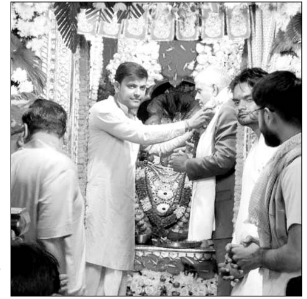
पुष्कर दौरे के दौरान उपराष्ट्रपति ने ब्रह्मा मंदिर में दर्शन किए।

अजमेर, (कास)। उपराष्ट्रपति जगदीप धनखड़ ने गुरुवार को पुष्कर में आयोजित 105वें राष्ट्रीय जाट अधिवेशन में कहा कि किसानों को कृषि उत्पादों के विपणन पर भी ध्यान देना चाहिए। उपराष्ट्रपति धनखड़ ने अपने संबोधन में कहा कि किसान समुदाय को बांटने की साजिश करने के प्रयासों को सब मिलकर रोक सकते हैं। किसान समाज की आत्मा है।