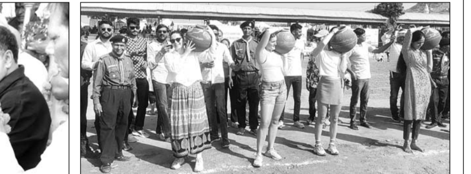
मेला मैदान में खेलकूद प्रतियोगिताओं में देशी-विदेशी पर्यटकों ने दमखम दिखाया।

आरती के दर्शन के लिए श्रद्धालुओं का सैलाब उमड़ गया। स्नान के लिए उमड़ने वाली भीड़ के मद्देनजर जिला एवं पुलिस प्रशासन पूरी तरह से सुस्तैद हो गया। कानून एवं सुरक्षा व्यवस्था के माकूल बंदोबस्त किए गए हैं। ब्रह्माजी मंदिर 52 घाटों एवं मुख्य मंदिरों में सुरक्षा की कामना आला अफसरों को कार्यापालक मजिस्ट्रेट के रूप में सौंपी गई है। इसके अलावा चप्पे-चप्पे पर पुलिस और आरएएस की जवान तैनात किए गए हैं। मुख्य स्थानों पर सशस्त्र जवान