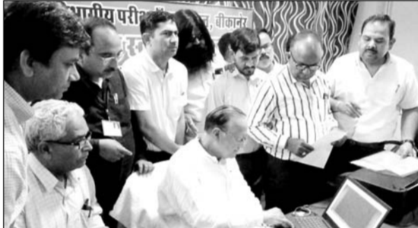
शिक्षा मंत्री डॉ. बी डी कल्ला ने परिणाम जारी किया।

परीक्षा में सर्वाधिक संख्या में परीक्षार्थी 1,28,687 जयपुर जिले से शामिल हुए जबकि न्यूनतम संख्या में परीक्षार्थी 19131 जैसलमेर जिले से शामिल हुए। पांचवीं बोर्ड परीक्षा का परिणाम 97.30 प्रतिशत रहा है, जिसमें छात्राओं ने एक फिर बाजी मारते हुए छात्रों को पछाड़ दिया। छात्राओं का परीक्षा परिणाम 97.50 प्रतिशत रहा, जबकि छात्रों का परीक्षा परिणाम 97.13 प्रतिशत रहा। राजस्थान शिक्षा विभाग के परीक्षा पंजीयक द्वारा पांचवीं बोर्ड की परीक्षा का परिणाम तैयार किया। प्रवेश भर में 14 लाख 60 हजार 130 परीक्षार्थियों ने परीक्षा दी थी। वहीं वर्ष 2022 में 5वीं का परीक्षा परिणाम 93.8 प्रतिशत रहा। कुल सम्मिलित परीक्षार्थियों में से