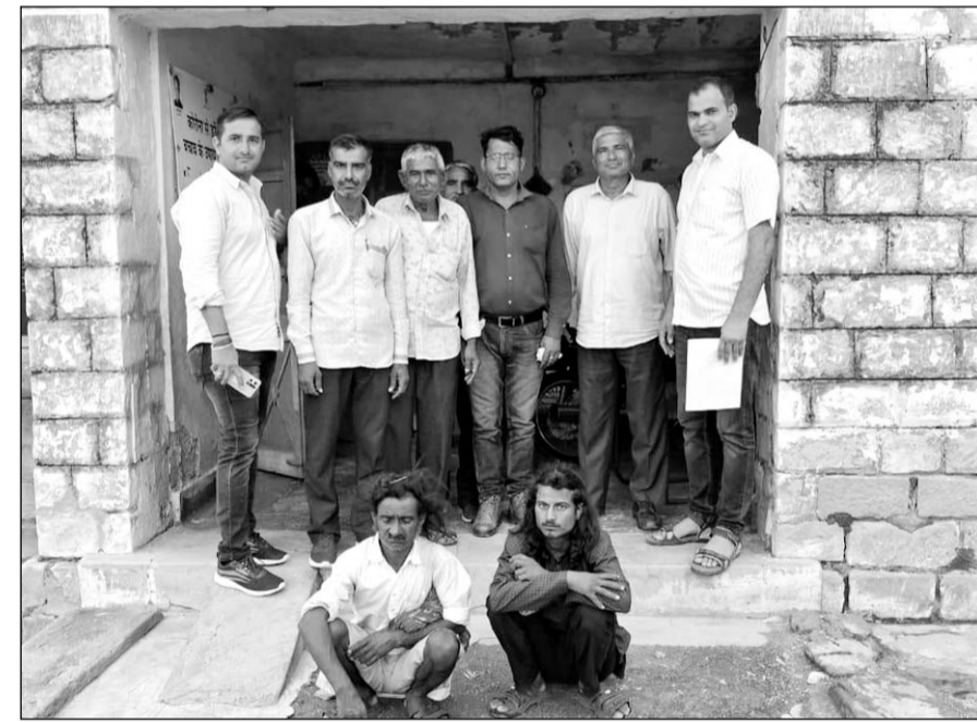
डीडवाना में वन विभाग व पुलिस टीम ने मोर के शिकार के मामले में दो जनों को पकड़ा।