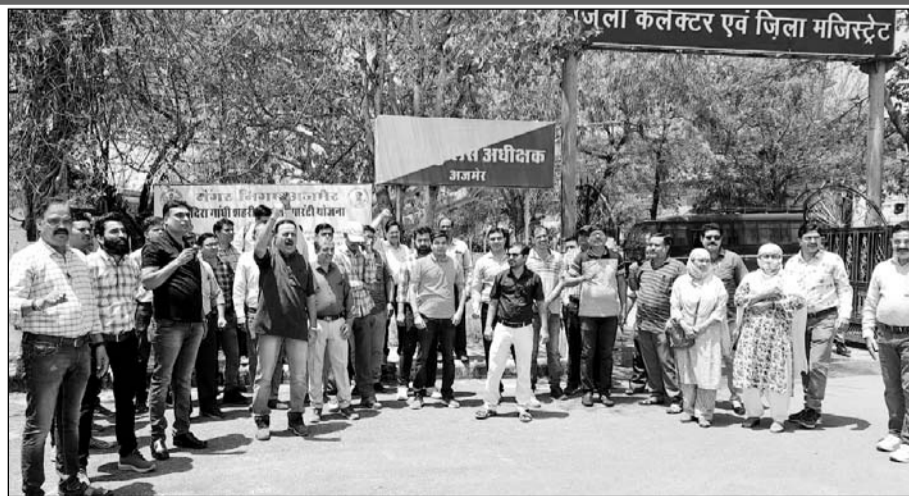
अजमेर में जिला कलेक्ट्रेट पर शिक्षक व संगठनों के पदाधिकारियों ने प्रदर्शन किया।

अजमेर, (कास)। निर्वाचन विभाग द्वारा ग्रीष्मवकाश की छुट्टियों में शिक्षकों से डोर-टू-डोर सर्वे करके मतदाता सूचियों का कार्य करवाने के तुगलकी फरमान को लेकर गुरुवार को राजस्थान शिक्षक संघ सियाराम के बैनर तले शिक्षकों ने जिला कलेक्ट्रेट पर प्रदर्शन कर मुख्य निर्वाचन अधिकारी को ज्ञापन सौंपकर शिक्षकों ने निर्वाचन विभाग के मतदाता सूचियों के अपडेशन के लिए डोर टू डोर सर्वे करने के आदेशों को लेकर विरोध जताया और शिक्षकों से सर्वे को उचित नहीं बताते हुए आदेश को वापस लेने की मांग की गई है।