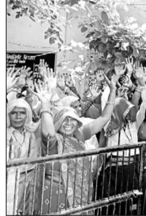
पावटा शहर के ग्राम शिवनगर की महिलाओं ने पानी की समस्या को लेकर प्रदर्शन किया।

के अनुसार पानी की आपूर्ति न होने से परेशानियों का सामना करना पड़ रहा है। इससे जनजीवन प्रभावित हो रहा है। अगर जल्द पानी की किल्लत को दूर नहीं किया गया तो बड़ा आंदोलन व प्रदर्शन करेंगे।