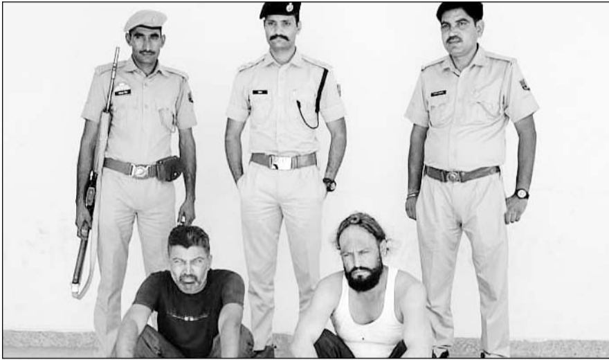
राजगढ़ थाना पुलिस ने डोडा पोस्ट चूरा तस्करी करते हुए दो जनों को गिरफ्तार किया।

प्राप्त जानकारी के अनुसार महानिरीक्षक पुलिस बोकानेर रैंज बोकानेर द्वारा मादक पदार्थों की धरपकड़ हेतु चलाये जा रहे के अभियान के तहत पुलिस टीम ने गोठया बड़ी के पास नाकाबंदी कर राजगढ़ की ओर से आ रहे ट्रक को रूकवाया तथा बन्द बाँड़ी कंटेनर की तलाशी लेने पर 30 किलो डोडा पोस्ट चूरा मिला तथा किसी भी प्रकार का लाईसेंस या परमिट नहीं मिलने पर कन्टेनर को डोडा पोस्ट चूरा सहित