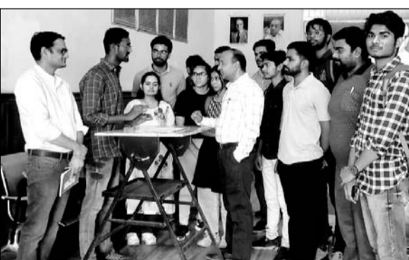
एमपीयूएटी में विश्व दुग्ध दिवस सप्ताह का आयोजन हुआ।