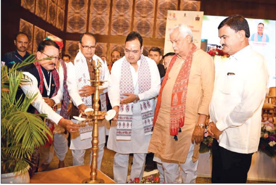
केन्द्रीय कृषि एवं किसान कल्याण मंत्री शिवराज सिंह चौहान व मुख्यमंत्री भजनलाल शर्मा ने मंगलवार को जयपुर में आयोजित पश्चिमी क्षेत्रीय सम्मेलन का उद्घाटन किया।

■ केन्द्रीय कृषि मंत्री शिवराज सिंह ने कहा कि पहला क्षेत्रीय सम्मेलन राजस्थान में हो रहा है। इसमें कृषि क्षेत्र की आवश्यकताओं, चुनौतियों व संभावनाओं को समझने का एक मंच मिलेगा और कृषि क्षेत्र को नई दिशा मिलेगी।