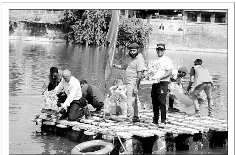
जोधपुर में इको फ्रेंडली गणेश प्रतिमाओं का श्रद्धालुओं ने जलाशय में विसर्जन किया।