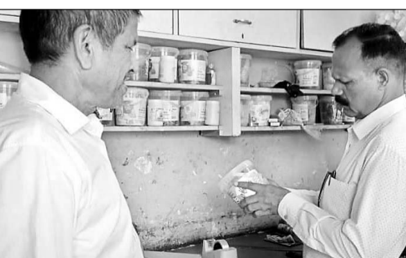
हनुमानगढ़ टाउन में एक बेकरी सेंटर का आकस्मिक निरीक्षण किया।