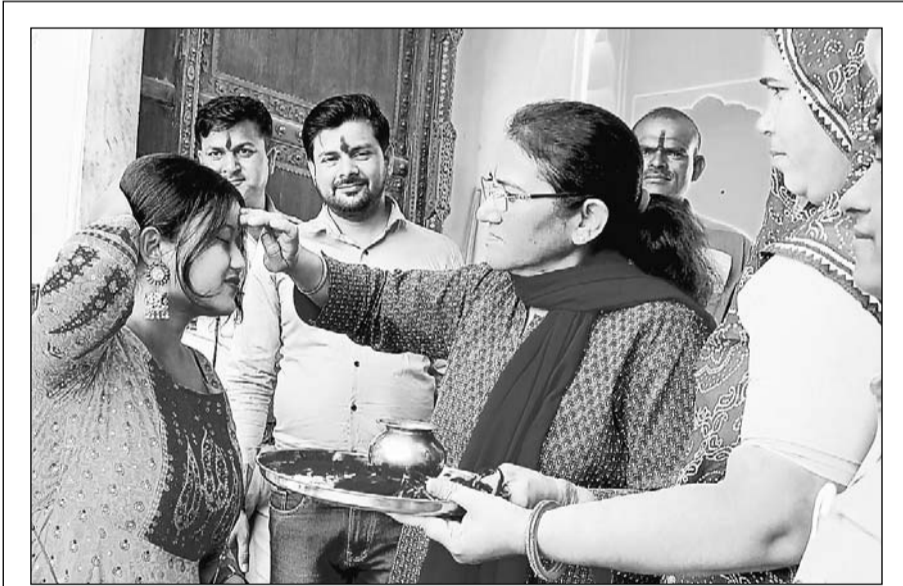
विश्व विरासत दिवस के अवसर पर मंगलवार को हवामहल प्रशासन ने पर्यटकों का तिलक लगाकर स्वागत किया।

करेंगी। पूर्व मुख्यमंत्री वसुंधरा राजे इस दौरान सूरतगढ़ में रात्रि विश्राम करेंगी। 20 अप्रैल को सुबह आमजन और राजनेताओं से मुलाकात करेंगी। दोपहर 1 बजे विश्वेन्द्र सभा समिति के कार्यक्रम में भाग लेंगी। वापसी में 3 बजे रवाना होकर 6 बजे बीकानेर पहुंचेंगी। रात्रि विश्राम बीकानेर में करेंगी और 21 अप्रैल को सुबह 9:30 बजे जयपुर के लिए रवाना होंगी।