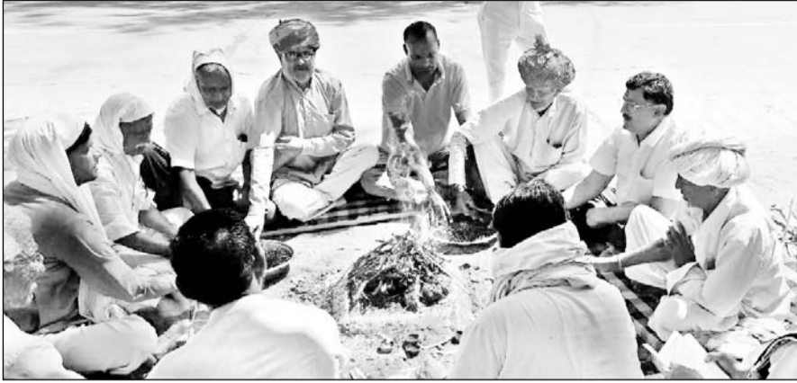
विराटनगर को जयपुर जिले में यथावत रखने के लिए संघर्ष समिति ने हवन यज्ञ किया।

मंगलवार की दोपहर धरना स्थल पर एकत्रित होकर जनप्रतिनिधियों सहित लोगों ने विराटनगर क्षेत्र को जयपुर जिले में यथावत रखने के लिए मंत्रोच्चारण के मध्य हवन में आहुतियां डाली। भगवान से गुहार लगाई कि वह सरकार को सद्वृद्धि दे ताकि सरकार अपने तानाशाह रवैये को छोड़कर विराटनगर क्षेत्रवासियों की मनोस्थिति को समझे और शीघ्रतापूर्वक अपने निर्णय को वापस ले। लोगों ने सरकार को चेतावनी देते हुए कहा कि अभी तो विराटनगर क्षेत्रवासी शांतिपूर्ण प्रदर्शन कर रहे हैं। अगर सरकार ने शीघ्र ही फैसला नहीं बदला तो सरकार के खिलाफ उग्र आंदोलन किया जाएगा।