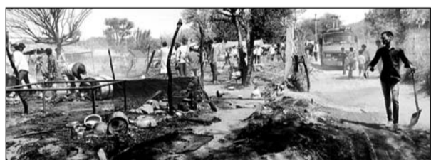
सामोद के पास बंदील स्थित कालबेलिया कच्ची बस्ती में आग लग गई।

चौमू/कालाडैरा, (निसं)। चौमू उपखण्ड के गांव सामोद के पास बंदील स्थित कालबेलिया कच्ची बस्ती में अज्ञात कारणों से मंगलवार को भीषण आग लग गई। आग लगने से कालबेलिया कच्ची बस्ती के लगभग पांच कच्चे छपर जल कर राख हो गए। आग लगने से कच्चे छपरों में रखा खाद्य सामान, कपड़े व धरेलू सामान जलकर राख हो गया। स्थानीय लोगों ने आग बुझाने का प्रयास किया लेकिन आग ज्यादा फेलते देख स्थानीय लोगों ने अग्निशमन अधिकारी को सूचना दी। अग्निशमन अधिकारी अर्जुन लाल