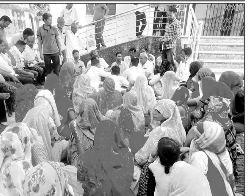
धरने पर बैठे हुए पार्षद व कस्बेवासी।