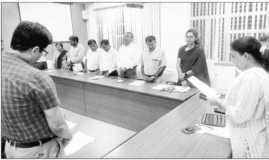
सूचना व प्रसारण मंत्रालय द्वारा 10 से 24 अप्रैल तक मनाये जा रहे स्वच्छता पखवाड़े के अंतर्गत मंगलवार को केंद्रीय संचार ब्यूरो और पत्र सूचना कार्यालय जयपुर द्वारा पत्र सूचना कार्यालय के मीडिया सभागार में स्वच्छता शपथ का आयोजन किया गया।

जयपुर, (का.सं.)। सूचना एवं प्रसारण मंत्रालय द्वारा 10 से 24 अप्रैल 2023 तक मनाये जा रहे स्वच्छता पखवाड़े के अंतर्गत आज मंगलवार को केंद्रीय संचार ब्यूरो और पत्र सूचना कार्यालय जयपुर द्वारा पत्र सूचना कार्यालय के मीडिया सभागार में स्वच्छता शपथ का आयोजन किया गया।