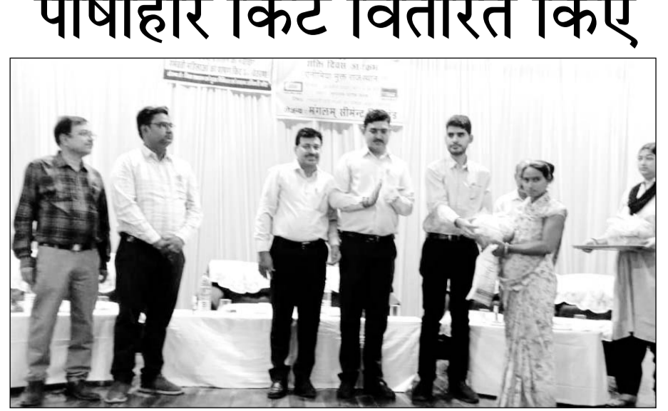
प्रधानमंत्री सुरक्षित मातृत्व दिवस पर गर्भवती महिलाओं को पोषाहार किट वितरित किये।

पिछले कुछ दिनों से रुपए मांगने वाले काफी दबाव बना रहे थे परंतु कहीं से पेमेंट नहीं आने के कारण वह मांगने वालों को पैसे नहीं लौटा पा रहा था कर्ज मांगने वालों को पैसा चुकाने के लिए उसने लूट की झूठी घटना स्वीकार किया है।