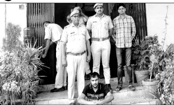
सिंधाना पुलिस ने युवक को गिरफ्तार कर गांजा बरामद किया।

■ पूछताछ में सामने आया कि आरोपी छत्तीसगढ़ से गांजा लेकर आया था