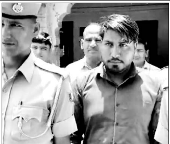
पुलिस ने हत्या के आरोपी को गिरफ्तार किया।