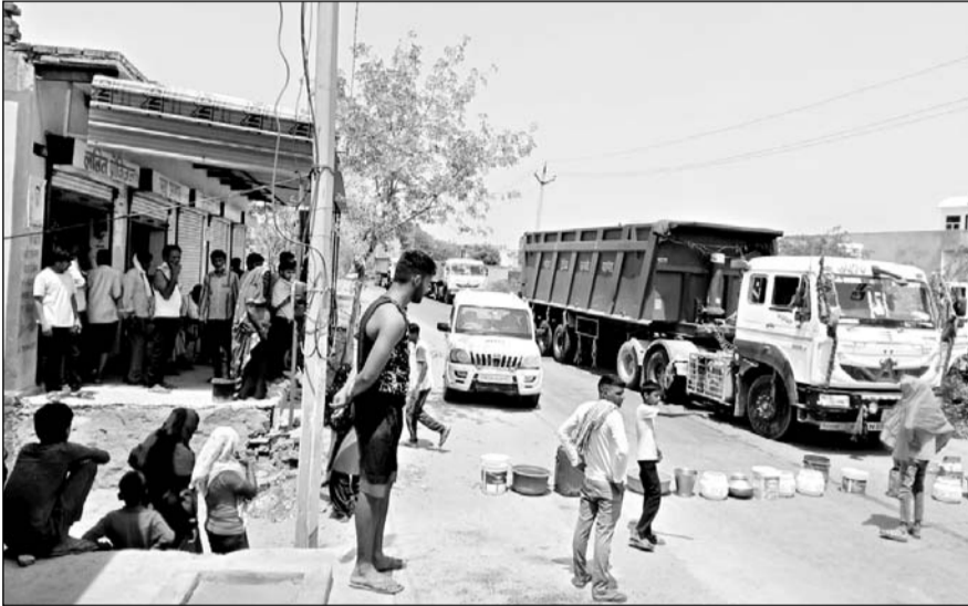
ग्राम मोहनपुर खरखड़ा की महिलाओं ने पानी को लेकर रामपुरा-पाटन सड़क पर खाली बर्तन रख कर जाम लगा दिया।