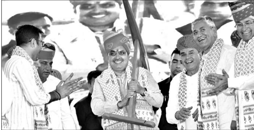
ओसियां में आयोजित कार्यक्रम में मुख्यमंत्री भजनलाल शर्मा का स्वागत किया गया।

इस अवसर पर मुख्यमंत्री ने शिक्षा, स्वास्थ्य, विद्युत, सड़क सहित विभिन्न क्षेत्रों के 416 करोड़ रुपये से अधिक विकास कार्यों का लोकार्पण और शिलान्यास किया। उन्होंने ओसियां उपखण्ड मुख्यालय पर खेल स्टेडियम के निर्माण के साथ ही नेतरा और पिचकीबेरा में 33 केवी के जीएसएस के स्थापना की घोषणा भी की। मुख्यमंत्री ने आह्वान किया कि किसान आधुनिक कृषि तकनीकों को अपनाएं और समृद्ध बनें। इसी कड़ी में