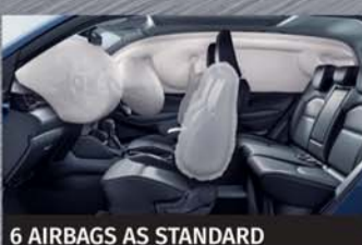
6 AIRBAGS AS STANDARD