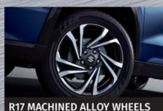
R17 MACHINED ALLOY WHEELS