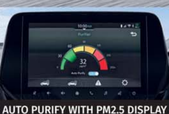
AUTO PURIFY WITH PM2.5 DISPLAY