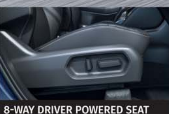
8-WAY DRIVER POWERED SEAT