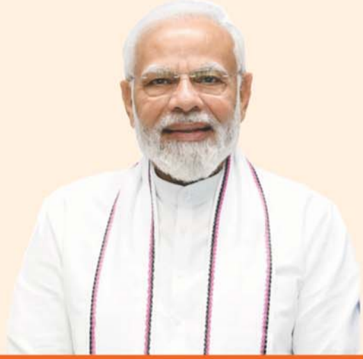
श्री नरेन्द्र मोदी माननीय प्रधानमंत्री