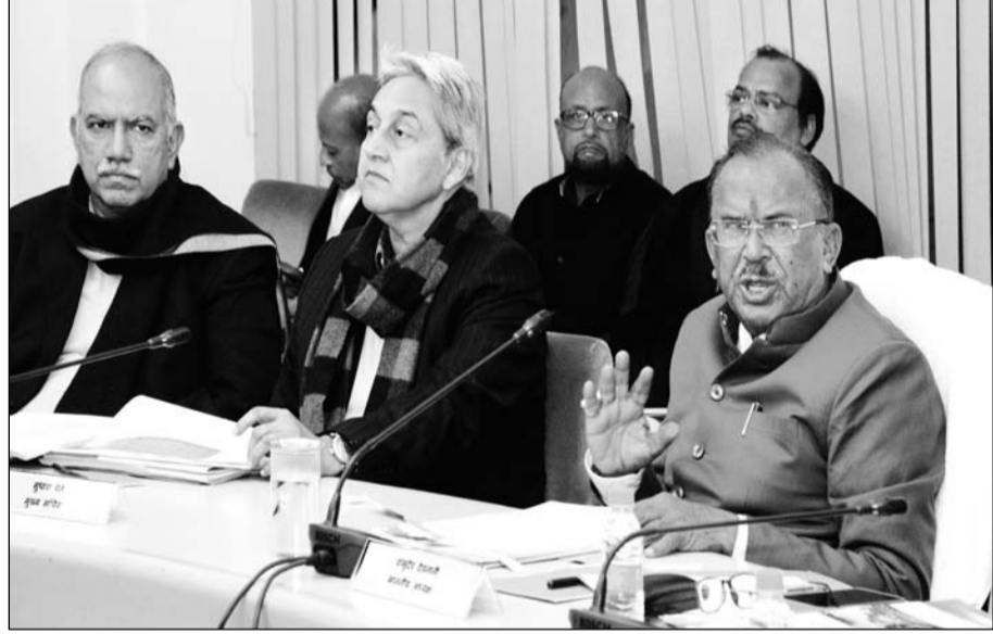
विधानसभा के लम्बित प्रश्नों पर अध्यक्ष देवनानी ने राज्य सरकार के मुख्य सचिव सुधांशु पंत सहित वरिष्ठ अधिकारियों की विधानसभा में उच्च स्तरीय बैठक बुलाई।

जयपुर। विधानसभा अध्यक्ष वामुदेव देवनानी ने कहा कि विधानसभा आमजन की समस्या के समाधान का सशक्त प्लेटफॉर्म है। विधायकों द्वारा जन समस्याओं के संबंध में उठाये गये मुद्दों के निराकरण विधानसभा के पवित्र सदन में होना आवश्यक है। उन्होंने कहा कि राज्य सरकार के अधिकारी समस्याओं के निराकरण करने में सहयोगी बनें और अपनी जिम्मेदारियों का निर्वहन समय सीमा में करना सुनिश्चित करें। देवनानी का मानना था कि मिशन के रूप में कार्य करने से ही राज्य सरकार द्वारा किये जा रहे कार्यों का परिणाम धरातल पर दिखाई दे सकेगा। देवनानी ने कहा कि विधानसभा से संबंधित प्रश्नों के जवाब के मामले में उल्लेखनीय सुधार हुए हैं, लेकिन अभी और अधिक बेहतर किये जाने की आवश्यकता है। देवनानी शुक्रवार को यहाँ विधानसभा में लम्बित प्रश्नों, ध्यानाकर्षण प्रस्तावों, विशेष उल्लेख प्रस्तावों, आश्वासनों एवं याचिकाओं के संबंध में राज्य सरकार के मुख्य सचिव, अतिरिक्त मुख्य सचिव सहित वरिष्ठ अधिकारियों की उच्च स्तरीय बैठक की अध्यक्षता कर रहे थे। देवनानी ने कहा कि प्रश्नों के जवाब लम्बे समय तक विधानसभा को प्राप्त नहीं होना चिन्ता का विषय है। उन्होंने अधिकारियों को सख्त निर्देश दिये कि विधानसभा के प्रश्नों के जवाब समय सीमा में भेजा जाना सुनिश्चित करें। यह महत्वपूर्ण कार्य है। सोलहवीं राजस्थान विधानसभा के तीसरे सत्र से पहले 20 जनवरी तक सभी प्रश्नों के जवाब विधानसभा को आवश्यक रूप से भेजे। देवनानी ने चिकित्सा एवं स्वास्थ्य, स्वायत्त शासन विभाग, शिक्षा विभाग, ऊर्जा विभाग, नगरीय विकास विभाग और गृह विभाग का नाम प्रमुखता से लेकर कहा कि इन विभागों में विधानसभा के प्रकरण अधिक संख्या में लम्बित हैं।