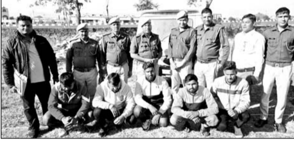
पुलिस ने हमला करने के आरोपियों को गिरफ्तार किया।