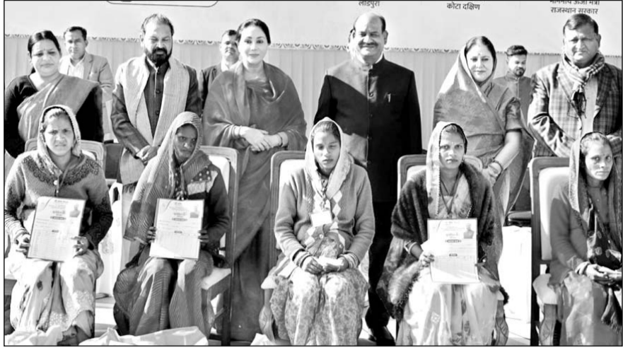
कोटा में "सुपोषित मां" अभियान के तहत लोकसभा अध्यक्ष ओम बिरला और उपमुख्यमंत्री दिया कुमारी ने गर्भवती महिलाओं को पोषण किट दिये।

मुख्य अतिथि लोकसभा अध्यक्ष ओम बिरला ने उपस्थित महिलाओं को संबोधित करते हुए कहा कि समाज की आने वाली पीढ़ी स्वस्थ हो एवं गर्भवती महिलाओं को पर्याप्त पोषण मिल सके, इस उद्देश्य से "सुपोषित मां" अभियान शुरू किया गया था। गरीब एवं वंचित वर्ग की गर्भवती महिलाओं को चिन्हित कर नौ माह तक उनकी नि:शुल्क जांच एवं पोष्टिक आहार का इंतजाम करना इस अभियान की पहली प्राथमिकता है। उन्होंने उपस्थित लोगों का आभार किया कि उनके मोहल्ले, गांव-वाणी में कहीं भी ऐसी गर्भवती महिला मिले जिसे गरीबी के कारण पोष्टिक आहार नहीं मिल पा रहा हो उनकी जानकारी उपलब्ध कराएँ, ताकि "सुपोषित मां" अभियान के तृतीय चरण में उनके