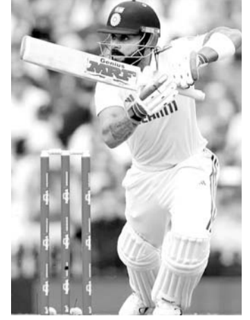
लगाई और गेंद पर उछाला। मार्नस लाबुशेन ने कैच किया। थर्ड अंपायर को लगा कि स्मिथ

सिडनी, 3 जनवरी। भारत और ऑस्ट्रेलिया के बीच 5वां टेस्ट मैच खेला जा रहा है। सिडनी टेस्ट के पहले दिन भारत का टॉप ऑर्डर एक बार फिर फेल हुआ। विराट कोहली का बल्ला एक बार फिर नहीं चला। वह 69 गेंद पर 17 रन बनाकर आउट हो गए। स्कॉट बोलैंड ने उन्हें चौथी बार आउट किया। 123 मैच के करियर में कोहली पहली बारी इतनी गेंद खेलने के बाद बगैर बाउंड्री लगाए आउट हुए हैं। भारतीय टीम को पहला झटका 5वें ओवर में लगा। उस दौरान केएल राहुल 4 रन बनाकर मिचेल स्टार्क की गेंद पर आउट हुए। इसके बाद 8वें ओवर की चौथी गेंद पर यशस्वी जायसवाल आउट हुए। स्कॉट बोलैंड ने अगली ही गेंद पर विराट कोहली को लागभ आउट कर दिया था। बल्ले का किनारा लेकर गेंद स्लिप में गई। स्टीव स्मिथ ने डाइव