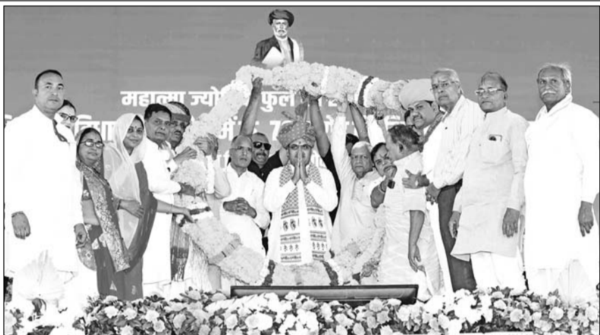
मुख्यमंत्री भजनलाल शर्मा ने शनिवार को कोटा के हिण्डोली में 70 करोड़ के विकास कार्यों का शिलान्यास-लोकार्पण किया। इस मौके पर स्थानीय पदाधिकारियों और आम जनता ने मुख्यमंत्री का गर्मजोशी से स्वागत किया।

बूंदी/जयपुर। मुख्यमंत्री भजनलाल शर्मा ने रामसागर झील के द्वितीय चरण के पर्यटन एवं विकास कार्य तथा महात्मा ज्योतिबा फुले एवं सावित्री बाई फुले की जीवनी पर आधारित पेनोरमा और पुस्तकालय बनाने की घोषणा की। उन्होंने रामसागर झील पर सीपेज की समस्या के समाधान के लिए भी आश्वासन दिया। उन्होंने कहा कि रामसागर झील के किनारे भगवान श्रीराम की 21 फीट ऊंची प्रतिमा बनाने पर यह आस्था का भी केन्द्र बनेगा। शर्मा शनिवार को महात्मा ज्योतिबा फुले जयंती के अवसर पर बूंदी के हिण्डोली में विकास कार्यों के शिलान्यास एवं लोकार्पण समारोह को सम्बोधित कर रहे थे। समारोह में मुख्यमंत्री भजनलाल शर्मा ने हिण्डोली में 70 करोड़ रुपये की लागत के 24 विकास कार्यों का शिलान्यास एवं लोकार्पण किया। इस दौरान जन स्वास्थ्य एवं अभियांत्रिकी मंत्री कन्हैयालाल चौधरी, ऊर्जा राज्य मंत्री (स्वतंत्र प्रभार) हीरालाल नागर, सांसद दामोदर अग्रवाल, विधायक गोपीचंद मीना मौजूद थे।