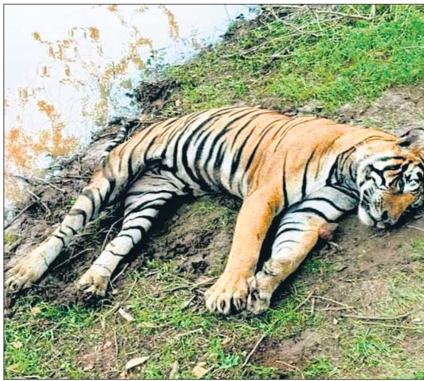
रणथम्भौर अभयारण्य में रविवार को बाघ टी-58 की मौत हो गई। रविवार शाम 6 बजे टाइगर हिंदवाड के पास फलोदी रेंज में टाइगर मृत पाया गया। बाघ टी-58, बाघिन 26 शमीली का बेटा है, जिसकी उम्र 13 साल थी।

6 बजे टाइगर हिंदवाड के पास फलोदी रेंज में मृत पाया गया। शव को राजबाग वन्य जीव मोचरी में रखवाया गया। जिसकी मौत के कारणों का सोमवार पोस्टमार्टम के बाद ही पता चल पाएगा। टाइगर की मौत बाघ संरक्षण एवं वन्य जीव प्रेमियों के लिए बड़ी दुःखद खबर है।