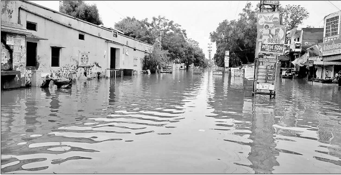
तारानगर में मूसलाधार बरसात होने से बाजारों में पानी भर गया।