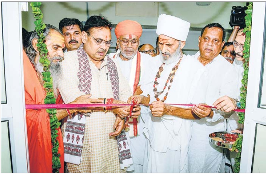
मुख्यमंत्री भजनलाल शर्मा ने जयपुर में राजपुरोहित छात्रावास का उद्घाटन किया। इस सार्वजनिक कार्यक्रम में संतजनों की भी उपस्थिति रही।

जयपुर, 7 जुलाई (का.सं.)। मुख्यमंत्री भजनलाल शर्मा ने रविवार को जयपुर में संतजनों की उपस्थिति में राजपुरोहित ग्लोबल सेंटर ऑफ़ ऐक्सिलेंस (राजपुरोहित छात्रावास) का फीता काटकर उद्घाटन किया। इस अवसर पर आयोजित समारोह को संबोधित करते हुए उन्होंने कहा कि राजपुरोहित समाज शिक्षा के क्षेत्र में अग्रणी भूमिका निभा रहा है। इस छात्रावास का निर्माण शिक्षा के क्षेत्र में समर्पण और सामाजिक सरोकार की सच्ची मिसाल है। यह छात्रावास युवाओं को गुणवत्तापूर्ण शिक्षा प्राप्त करने के लिए मजबूत आधार प्रदान करेगा। मुख्यमंत्री ने कहा कि छात्रावास में विभिन्न क्षेत्रों के विद्यार्थी साथ रहते हैं, जिससे बेहतर संवाद स्थापित होता है और उनका आत्मविश्वास बढ़ता है। मुख्यमंत्री ने छात्रावास परिसर का अवलोकन भी किया।