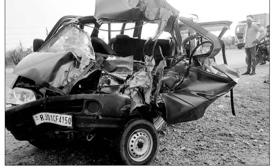
दुर्घटना इतनी भीषण थी कि कार के आगे का हिस्सा चकनाचूर होकर कबाड़ में तब्दील हो गया।

मृतक की पत्नी के अलावा सात घायल, अजमेर रेफर