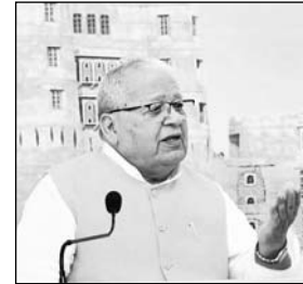
मिश्र ने इंडियन हेरिटेज होटल्ल एक्सोसिएशन के 9वें वार्षिक सम्मेलन का उद्घाटन किया

जयपुरा राज्यपाल कलराज मिश्र ने पर्यटन में स्थानीय लोगों की भागीदारी बढ़ाते हुए इसे जन उद्योग के रूप में विकसित किए जाने का आभयान किया है। उन्होंने पर्यटन को अर्थव्यवस्था का महत्वपूर्ण घटक बताते हुए इससे रोजगार के अधिकाधिक सृजन की संभावनाओं पर कार्य किए जाने की आवश्यकता जताई।