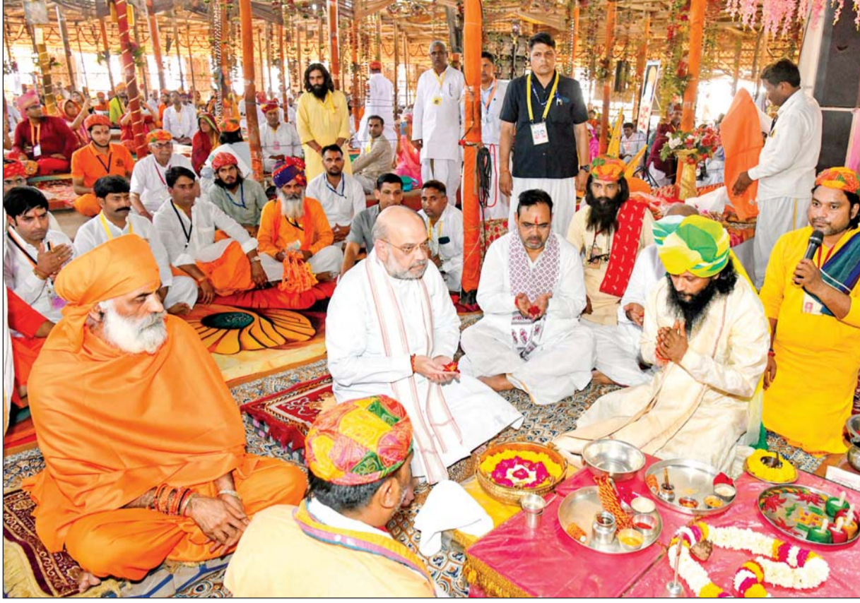
केन्द्रीय गृह और सहकारिता मंत्री अमित शाह व मुख्यमंत्री भजनलाल शर्मा ने रविवार को कोटपूतली-बहरोड़ जिले के पावटा में 108 कुण्डाय महायज्ञ रूद्र महायज्ञ की महापूर्णाहुति एवं सनातन सम्मेलन में भाग लिया। इससे पहले उन्होंने श्री श्री 1008 सिद्ध योगी बाबा बालनाथ जी की समाधि के दर्शन किए।