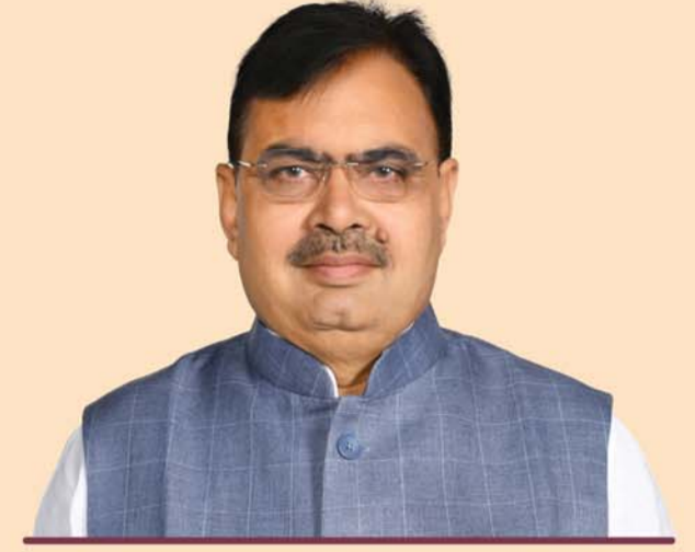
श्री भजनलाल शर्मा माननीय मुख्यमंत्री