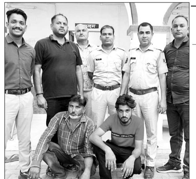
पुलिस ने अवैध मादक पदार्थ सहित दो तस्करों को गिरफ्तार किया।

रामगंजमंडी, (निर्स)। रामगंजमंडी पुलिस द्वारा अवैध मादक पदार्थ एवं तस्करों के खिलाफ विशेष अभियान चलाया जा रहा है, जिसके तहत मोड़क के बाद टीम थाना रामगंजमंडी द्वारा भी एक कार्रवाई को अंजाम दिया गया, जिसमें पुलिस ने अवैध मादक पदार्थ तस्करी के खिलाफ कार्रवाई करते हुए 20 किलो 160 ग्राम अवैध मादक