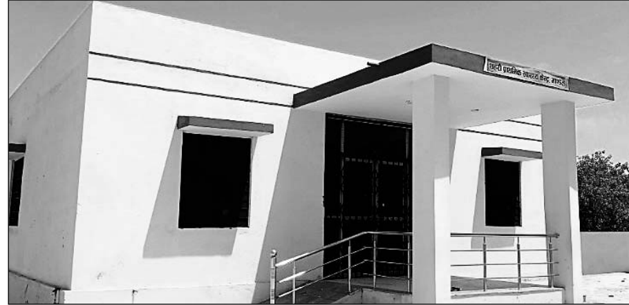
माण्डेता स्थित अस्पताल का नव निर्मित भवन।