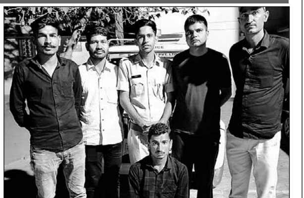
पुलिस ने नकली विग लगाकर परीक्षा देने वाले को गिरफ्तार किया।

■ आरोपी की गिरफ्तारी के बाद नकल के कई मामलों का खुलासा होने की उम्मीद