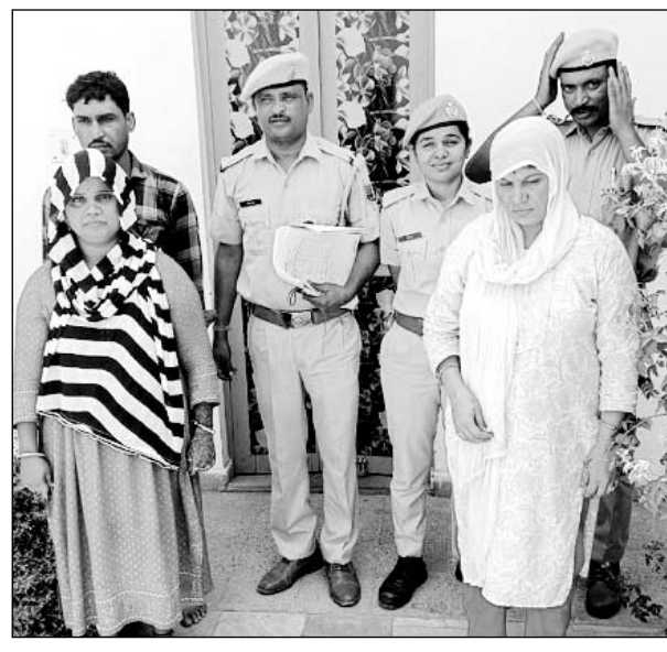
घाटोल थाना पुलिस की गिरफ्त में शादी का झांसा देकर रुपये ऎंठने वाली महिला व दलाल।