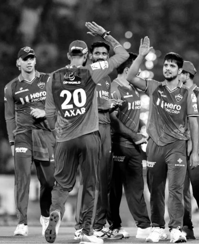
रनों का लक्ष्य दिया है। आज यहां अरुण जेटली स्टेडियम में राजस्थान रॉयल्स के कप्तान संजू सैमसन ने टॉस जीतकर पहले गेंदबाजी करने का फैसला किया।

नयी दिल्ली, 7 मई। दिल्ली कैपिटल्स ने इंडियन प्रीमियर लीग-2024 के 56वें मैच में राजस्थान रॉयल्स को 20 रन से हरा दिया। इसी के साथ टीम ने पिछले मुकाबले में मिली हार का हिसाब बराबर कर लिया। इतना ही नहीं, कैपिटल्स ने रॉयल्स के प्लेऑफ में पहुंचाने का इंतजार भी बढ़ा दिया है। को प्लेऑफ में पहुंचने के लिए अब भी एक और जीत की जरूरत है। दिल्ली ने होमग्राउंड पर टॉस हारकर पहले बैटिंग करते हुए 20 ओवर में 7 विकेट पर 221 रन बनाए। जवाब में राजस्थान 20 ओवर में 8 विकेट पर 201 रन ही बना सकी। खलील अहमद, मुकेश कुमार और कुलदीप यादव ने दो-दो विकेट लिए। से संजू सैमसन ने 46 बॉल पर 86 रन की पारी खेली। रियान पराग ने 27 और शिवम दुबे ने 25 रन बनाए। दिल्ली से ओपनर जैक फ्रेजर-मैगर्क (50 रन) और अभिषेक पारेल (65 रन) ने अर्धशतक जमाए। ट्रिस्टन स्टक्स ने 41 रन बनाए। राजस्थान से रविचंद्रन अश्विन ने 3 विकेट चटकाए। युजुवेंद्र चहल, संदीप शर्मा और ट्रेट बोल्ट को एक-एक विकेट मिला। अभिषेक पारेल (65) और जैक फ्रेजर-मकाक (50) रनों की बेहतरीन पारियों के दम पर दिल्ली कैपिटल्स ने मंगलवार को इंडियन प्रीमियर लीग (आईपीएल) के 56वें मुकाबले में राजस्थान रॉयल्स को जीत के लिए 222