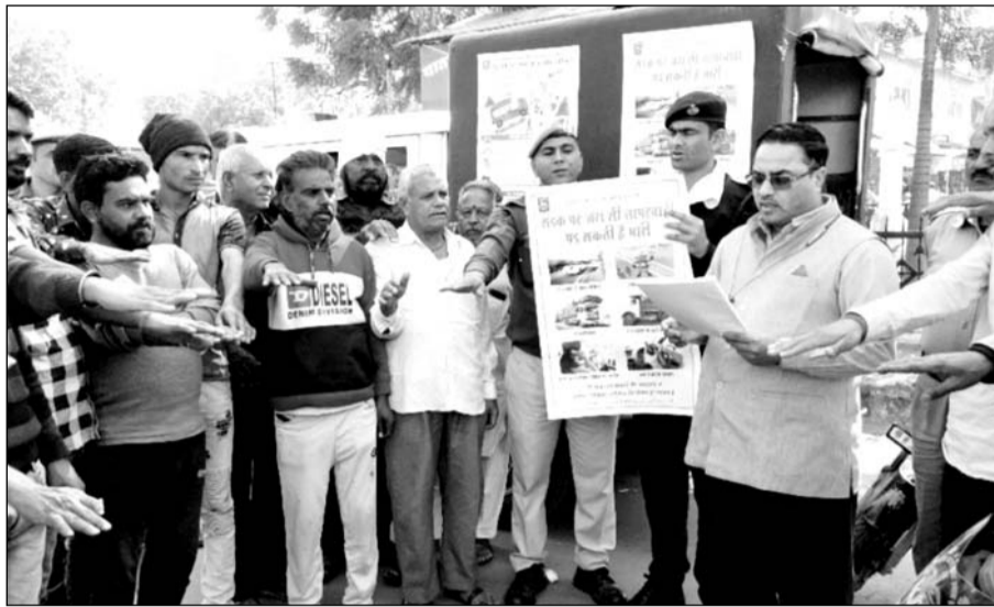
32 वां राष्ट्रीय सड़क सुरक्षा सप्ताह-2023 की शुरुआत हुई।

जाणकारी दी तथा सुरक्षा नियमों का पालन करने अपील करते हुए बताया कि शिखरधर में सबसे ज्यादा एक्सिडेंट भारत में होते हैं। एक्सिडेंट्स रिपोर्ट के अनुसार विश्व भर में 12 एक्सिडेंट भारत में होते हैं। इसका कारण वाहनों को चलाने में लापरवाही है। ट्रैफिक नियमों की पालना नहीं होती है। देश में