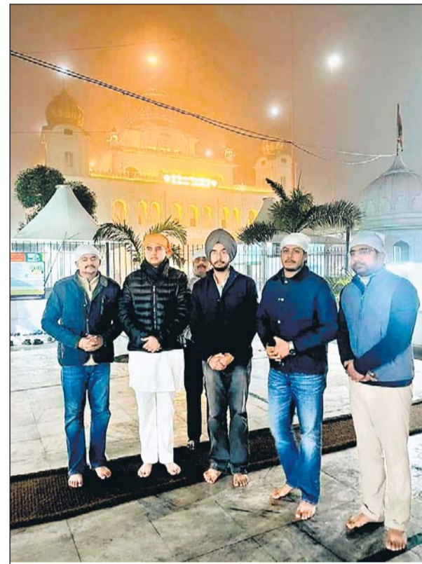
पूर्व उप मुख्यमंत्री सचिन पायलट इन दिनों भारत जोड़ो यात्रा में शामिल होने के लिए पंजाब गये हुये हैं। मंगलवार को उन्होंने गुरुद्वारा फतेहगढ़ साहिब में ली गई एक तस्वीर ट्विटर पर शेयर की। पायलट ने कैप्शन में लिखा, "आज पंजाब में भारत जोड़ो यात्रा में शामिल होने से पहले हमने गुरुद्वारा फतेहगढ़ साहिब में मध्याह्न टिक कर अपनी यात्रा की शुरुआत की है।"