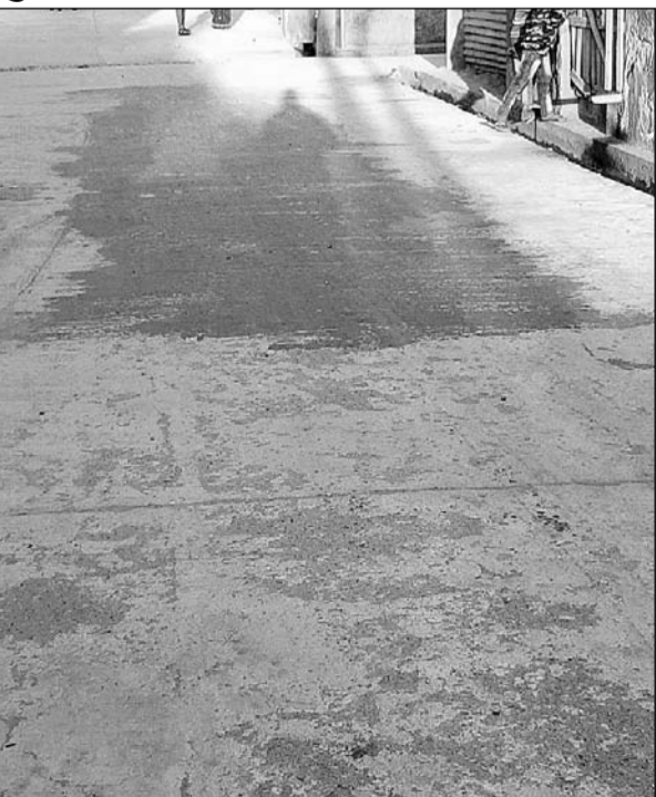
सुजानगढ़ सी.सी. सड़क पर खानापूर्ति के लिए लगाया गया डामर।