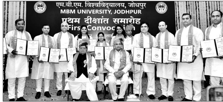
राज्यपाल कलराज मिश्र ने समारोह में विद्यार्थियों को गोल्ड मेडल प्रदान किए।

जोधपुर, (कांस)। राज्यपाल और कुलाधिपति कलराज मिश्र ने कहा कि प्रौद्योगिकी शिक्षा के तहत विश्वविद्यालय युवाओं को नवाचारों से जोड़ते हुए शोध की मौलिक भारतीय दृष्टि से संपन्न करें। उन्होंने कहा कि तकनीकी शिक्षा का उद्देश्य छात्रों में निहित अद्वितीय क्षमताओं को पहचान कर उन्हें भविष्य के अवसरों के लिए तैयार करना है। उन्होंने विद्यार्थियों से आह्वान किया कि वे अर्जित ज्ञान का उपयोग राष्ट्र और समाज के विकास के साथ ही मानवता के कल्याण में करें। राज्यपाल मिश्र जोधपुर स्थित एम.बी.एम. विश्वविद्यालय के प्रथम दीक्षांत समारोह को संबोधित कर रहे थे। समारोह में राज्यपाल कलराज मिश्र ने 19 विद्यार्थियों को गोल्ड मेडल प्रदान किए, जिसमें 13 गोल्ड मेडल यूजी के विद्यार्थियों को, 4 गोल्ड मेडल पीजी के विद्यार्थियों को एवं 2 गोल्ड मेडल एमएससी के विद्यार्थियों को प्रदान किए गए। साथ ही वर्ष 2022 एवं 2023 में उत्तीर्ण 680 विद्यार्थियों को स्नातक में उपाधियां प्रदान की। इसी प्रकार कुल 167 विद्यार्थियों को स्नातकोत्तर में, 28 विद्यार्थियों को बी.आर्किटेक्चर में, 52 विद्यार्थियों को एमएससी में एवं 11 विद्यार्थियों को पी.एच.डी की उपाधि प्रदान की गई। समारोह को संबोधित करते हुये राज्यपाल ने कहा कि शिक्षण संस्थान में गुणवत्तापूर्ण शिक्षा का प्रबंधन करना हमारी प्राथमिकता है। इस