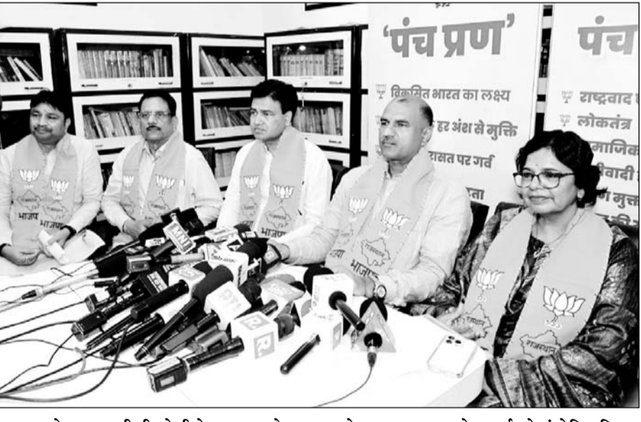
भाजपा प्रदेशाध्यक्ष सी.पी. जोशी ने शुक्रवार को भाजपा प्रदेश मुख्यालय पर प्रेसवार्ता को संबोधित किया।

जयपुर। भाजपा प्रदेशाध्यक्ष सीपी जोशी ने भाजपा प्रदेश मुख्यालय पर प्रेसवार्ता को संबोधित करते हुए कहा कि शनिवार को सुबह 9 बजे से जयपुर के सीतापुर स्थिति जेईसीसी सभागार में ऐतिहासिक वृहद कार्यसमिति का आयोजन किया जाएगा। यह कार्यसमिति ऐसे अवसर पर हो रही है जब देश में तीसरी बार प्रधानमंत्री के रूप में नरेन्द्र मोदी ने शपथ ली है, और प्रदेश में भाजपा की सशक्त भजनलाल सरकार है। कार्यसमिति में पंचायत राज के जनप्रतिनिधि, निकाय जनप्रतिनिधि, सांसद, विधायक, मंत्री मुख्यमंत्री और प्रदेश पदाधिकारियों सहित आठ हजार से ज्यादा भाजपा कार्यकर्ता भाग लेंगे। वहीं केंद्र की ओर से एमपी के पूर्व मुख्यमंत्री एच कृष्ण मंत्री शिवराज सिंह चौहान और भाजपा के राष्ट्रीय महासचिव दुष्यंत गौतम उपस्थित रहेंगे।