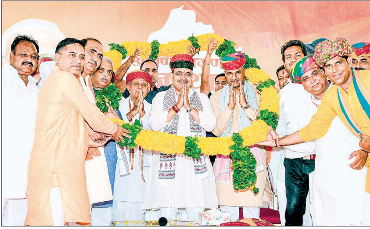
बजट पर मुख्यमंत्री भजनलाल शर्मा का आभार जताने के लिए प्रदेश भर से किसान मु.मंत्री निवास पर इकट्ठा हुये। किसानों ने बजट के प्रति प्रसन्नता जाहिर की और मुख्यमंत्री का माला पहनाकर अभिनन्दन किया।