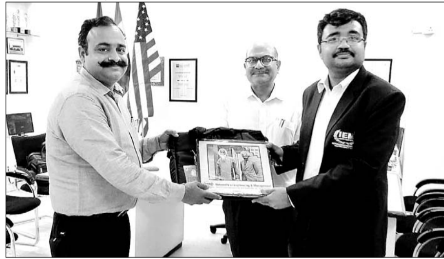
क्रीटी टेक्नोलॉजीज, बैंगलोर ने यूनिवर्सिटी ऑफ इंजीनियरिंग एंड मैनेजमेंट (यूईएम), जयपुर के साथ मिलकर भारत का पहला एलीक्सिस् लैब स्थापित किया है।