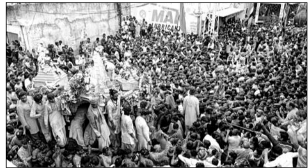
रथयात्रा में श्रद्धालुओं की भीड़ उमड़ी।

इस मौके पर हाथी घोडा पालकी जय कन्हैया लाल की के उद्देश्य से सर्वत्र वातावरण कृष्ण भक्ति में ओत प्रोत हो गया। इस मौके पर लावाँ श्रद्धालु रथ उपस्थित थे। रथयात्रा में गुलाब की पंखुडियों व गुलाब, अंबी की वर्षा से मंदिर परिसर एवं समूचा कस्बा महक उठा। रथयात्रा में भक्त भगवान के चंवर डुलाते, भजन कीर्तन करते, नाचते गाते, ढोल नगाडों की थाप पर झूमते हुए जयकारे लगाते हुए चल रहे थे। रथयात्रा