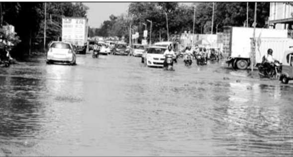
झोटवाड़ा थाने के सामने से निवारू रोड की तरफ जाने वाले मार्ग पर सोमवार सुबह हल्की सी बारिश में पानी भर गया।

झोटवाड़ा सर्किल, चौमू पुलिया सर्किल और निवारू रोड पर हालात खराब