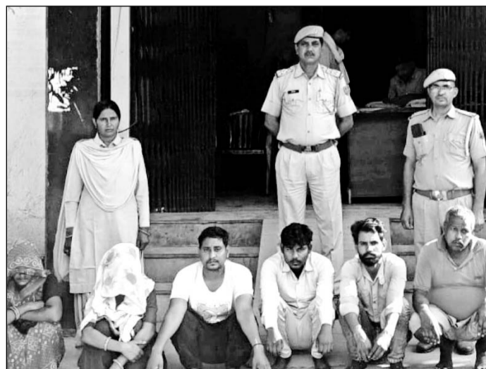
पुलिस ने दो महिलाओं सहित छह आरोपियों को गिरफ्तार किया है।