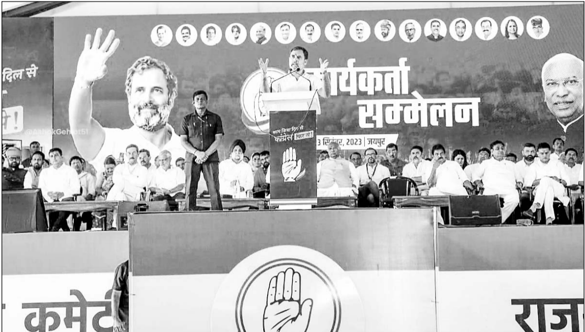
कहते हैं तस्वीरें शब्दों से ज्यादा सटीक बात कहती हैं। कांग्रेस कार्यकर्ता सम्मेलन में लगा पोस्टर भी ऐसा ही कुछ कहता नजर आया कि, प्रदेश में केन्द्रीय नेतृत्व सभी नेताओं को एक समान स्तर पर रख रहा है किसी को विशेष तलवज्जो नहीं मिलेगी। शहर भर में लगे तमाम होर्डिस व पोस्टर से में ‘लार्जर दैन लाइफ’ नजर आने वाले मु. मंत्री गहलोत कार्यकर्ता सम्मेलन के पोस्टर में प्रदेश के अन्य नेताओं के समकक्ष नजर आए।