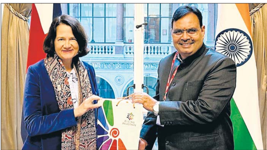
मुख्यमंत्री भजनलाल शर्मा, उप मुख्यमंत्री दीया कुमारी और राजस्थान सरकार के उच्चस्तरीय प्रतिनिधिमंडल ने ब्रिटेन सरकार की मंत्री (इण्डो पैसिफिक क्षेत्र) कैथरीन वेस्ट के साथ मुलाकात की और लंदन के पैलेस ऑफ वेस्टमिंस्टर में ब्रिटेन की संसद का दौरा किया।

लंदन, 17 अक्टूबर। यूरोप की सबसे बड़ी अर्थव्यवस्था जर्मनी में निवेशकों के साथ सफल संपर्क के बाद, मुख्यमंत्री भजन लाल शर्मा, उपमुख्यमंत्री दिया कुमारी और राजस्थान सरकार के उच्च स्तरीय प्रतिनिधिमंडल के अन्य सदस्यों ने आज