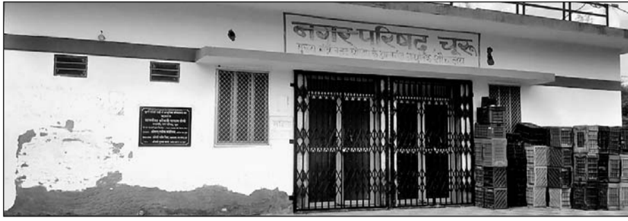
शौचालय के दरवाजे पर ताला लगा दिया गया है। यहां शौचालय का बिजली का कनेक्शन काट दिया गया है। पिछले दिनों नगरपरिषद के लोग आए और वहां लगी 4 एसी को लेकर चले गए।

चूक, (कासं.)। मुख्यमंत्री बजट घोषणा अंतर्गत निर्मित आधुनिक शौचालयों में लगे एसी गायब हो गए हैं। पड़ताल करने पर सामने आया कि आधुनिक शौचालयों के एसी चोरी नहीं हुए हैं, वे एसी तो नगरपरिषद के कमरों को ठंडा कर रही हैं। लोकेशन नंबर-11 सिंगल्स एवं डबल्स दोनों वर्ग में आनंद नंबर-13 डबल्स में जीते गोल्ड, हैप्पी कुमारी का बोर्ड की अंडर-19 महिला चैलेंजर ट्राफी के लिए एमएलए जयशंकर के अनुसार 19 जनवरी 2020 को मुख्यमंत्री बजट घोषणा अंतर्गत निर्मित आधुनिक शौचालयों को शुरू किया गया था। योजना के अनुसार उनमें एसी भी लगाए गए थे। कलेक्टर के आगे स्थित आधुनिक शौचालय में लगी 4 एसी गायब हो गईं। इसी प्रकार कृषि