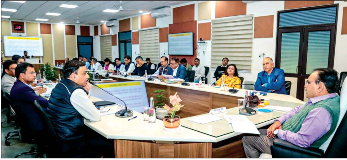
मुख्यमंत्री भजनलाल शर्मा ने मुख्यमंत्री निवास पर भरतपुर व डीग जिले के विकास कार्यों की समीक्षा की। उन्होंने कहा, राज्य सरकार विकास कार्यों के रोडमैप के जरिए भरतपुर व डीग जिले का चहुमुंखी विकास सुनिश्चित कर रही है।