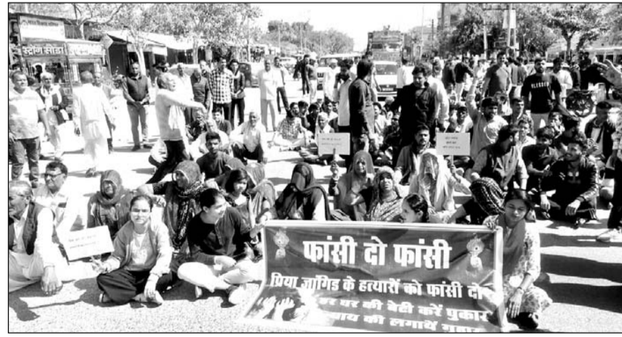
लाम्बाहरिसिंह में नाबालिग छात्रा की संदिग्ध मौत मामले में जांगिड़ समाज के लोगों ने प्रदर्शन किया।

शनिवार को छात्रा हत्याकाण्ड मामले को लेकर गांधी पार्क में जांगिड़ समाज की बैठक आयोजित हुई। बड़ी संख्या में मौजूद समाज के महिला-पुरुषों ने नाबालिग छात्रा व उसके परिवार को न्याय दिलाने के लिये सड़कों पर उतर प्रशासन पर दबाव बनाने का निर्णय लेकर गांधी पार्क से आक्रोश जताते हुये कोर्ट परिसर पहुंचे। शनिवार का कार्यक्रम अवकाश होने के चलते कार्य पर कोई जिम्मेदार अधिकाारी नहीं मिला तो लोगों का गुस्सा फूट पड़ा। गुस्साये लोगो ने तकरीबन आधा घंटे तक कोर्ट परिसर में धरना दिया। ज्ञापन लेने के लिये किसी भी सक्षम अधिकारी