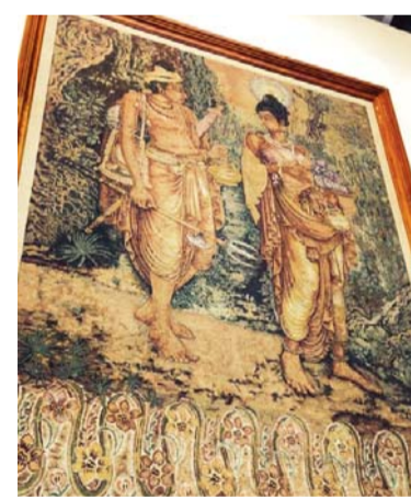
Princess Hemamali and her husband, Prince Dantha. Princess Hemamali carried Gautam Buddha's tooth relic, hidden in her hair, to Sri Lanka. At that time,

In the 4th Century AD, the last Indian ruler to possess the Tooth relic was Guhasiva of Kalinga. Guhasiva, in order to prevent its possession by his enemies, who made war, sent the tooth to Sri Lanka through his daughter Princess Hemamali and her husband, Prince Dantha. Princess