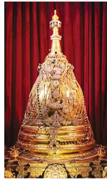
Preserved Tooth Relic.

I got the wonderful opportunity to visit the temple. As I entered the hall of the main shrine, I was captivated to see the old wooden architecture. From the hall, two separate staircases go upstairs (from left and right directions), where Buddha's original left upper canine tooth has been preserved. The sacred tooth is conserved in the inner chamber of the upper floor of the two-storied Sri Dalada Maligawa temple. The temple is designed in traditional style, with a decoration of uniquely built 128 lotus gold flowers on the roof. Two large elephant tusks are placed in front of the shrine. The Lotus flower has great significance in Kandy: When I walked to the upper floor, people were offering lotus flowers in front of the sacred tooth chamber to fulfill their wishes.