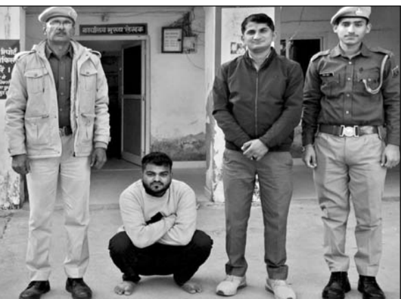
पुलिस ने गबन के मामले में फरार आरोपी को गिरफ्तार किया।