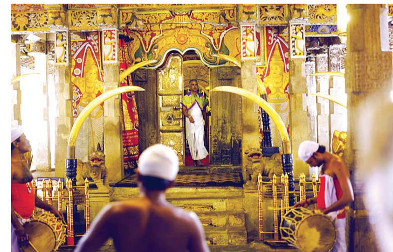
Elephant tusks outside the Preserved Tooth.