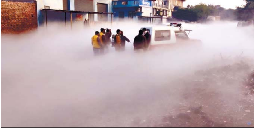
राजधानी जयपुर के विश्वकर्मा इंडस्ट्रियल एरिया में मंगलवार को ऑक्सीजन प्लांट में टैंकर का बॉल्व टूटने से हडकंप मच गया।

जयपुर। राजधानी जयपुर के विश्वकर्मा इंडस्ट्रियल एरिया में मंगलवार को ऑक्सीजन प्लांट में टैंकर का बॉल्व टूटने से हडकंप मच गया। कार्बन डाई ऑक्साइड गैस लिकेज के कारण जैसे ही पूरे इलाके में धुंआ फैला तो लोगों में दहशत का माहौल बन गया। सूचना पाकर मौके पर पहुंची विश्वकर्मा थाना पुलिस ने मेन वॉल्व बंद करवाकर लीकेज को बंद करवाया। गैस की वजह से दृश्यता कम होने के चलते वाहनों को धीमी गति से निकाला गया।