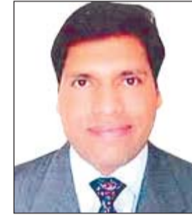
आई.ए.एस. देबाशीष पृष्ठी।