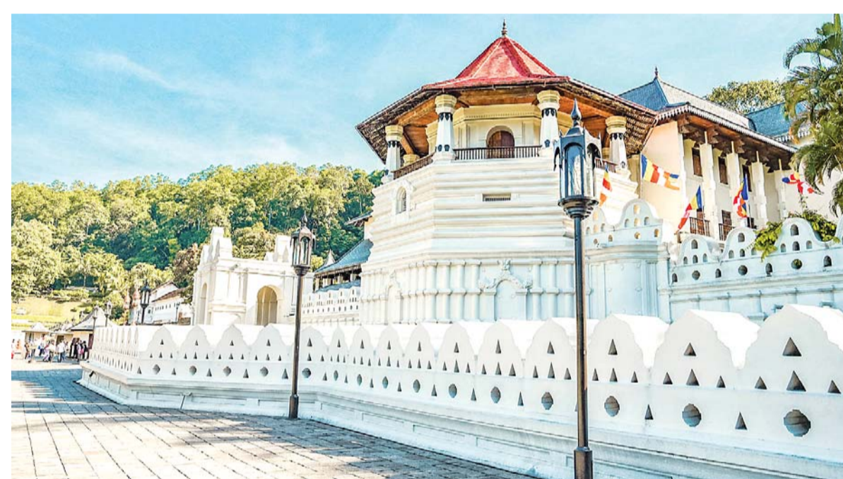
Temple of the Tooth, Sri Lanka.