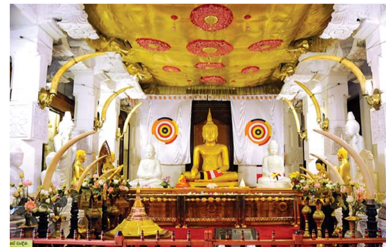
Temple Sacred Tooth Relic, Kandy, Sri Lanka.