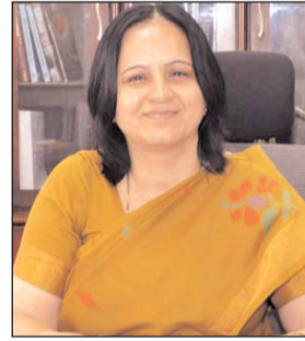
आई.ए.एस. मंजू राजपाल।