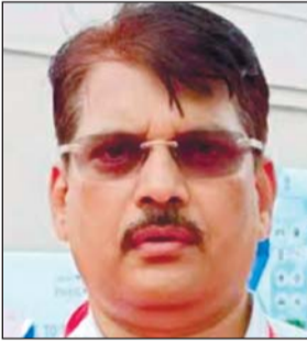
आई.ए.एस. भास्कर ए. सावंत।