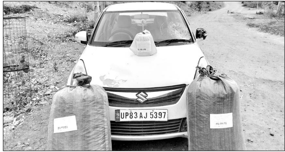
ग्रामीण पुलिस की विशेष टीम व मंडाना पुलिस टीम ने कार व अवैध मादक पदार्थ जब्त किया।