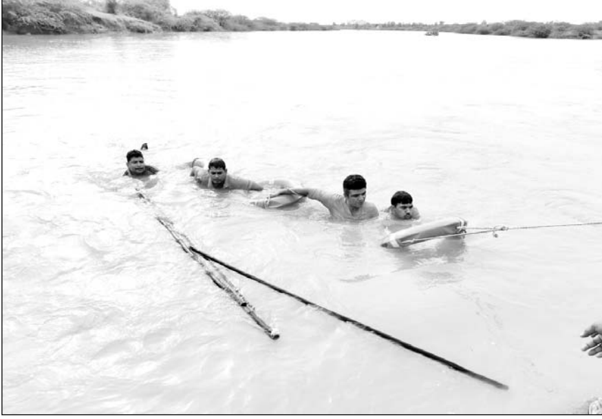
एसडीआरएफ टीम ने बांडी नदी में डूबे 35 वर्षीय व्यक्ति के शव को बरामद किया।

पुलिस थाना सदर पाली के अन्तर्गत ग्राम आकेली के समीप नदी की रफट पर एक व्यक्ति स्नान करने के दौरान डूब गया था, व्यक्ति के शव