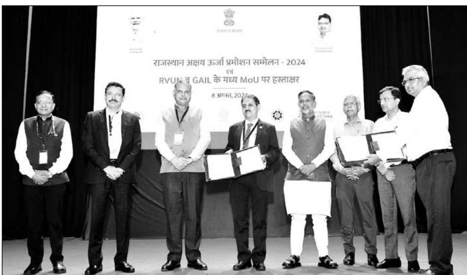
राजस्थान इंटरनेशनल सेंटर में आयोजित राजस्थान अक्षय ऊर्जा बिजनेस प्रमोशन समिट-2024 में राजस्थान राज्य विद्युत उत्पादन निगम तथा गेल इंडिया के बीच 4200 करोड़ रु. के एमओयू पर हस्ताक्षर किये गए।

जयपुर। ऊर्जा मंत्री हीरालाल नागर ने कहा कि राज्य सरकार अक्षय ऊर्जा को बढ़ावा देकर प्रदेश के किसानों को वर्ष 2027 तक दिन में बिजली देने के लिए तत्परता से कार्य कर रही है। मुख्यमंत्री भजनलाल शर्मा के नेतृत्व में हमारी सरकार ने मात्र 7 माह की अल्पावधि में कुसुम सी योजना में 4386 मेगावाट के प्रोजेक्ट्स के एलओआई जारी कर दिए हैं। इन अक्षय ऊर्जा परियोजनाओं को धरातल पर मिशन मोड में क्रियान्वित किया जा रहा है। उन्होंने कहा कि केंद्र और राज्य सरकार के ऊर्जा उपक्रमों की मजबूत साझेदारी से राजस्थान जल्द ही ऊर्जा के क्षेत्र में न केवल आत्मनिर्भर बनेगा बल्कि अन्य राज्यों को बिजली उपलब्ध कराने में भी महत्वपूर्ण भूमिका निभाएगा।