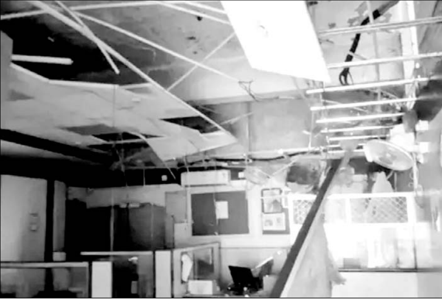
बोरावड़ के यूको बैंक भवन की छत और फॉल सीलिंग अचानक गिर गई।

सभी लोग सुरक्षित बाहर निकलने के बाद फॉल सीलिंग पूरी तरह से गिर गई। घटना की सूचना उच्च अधिकारियों को दी गई और सुरक्षा को ध्यान में रखते