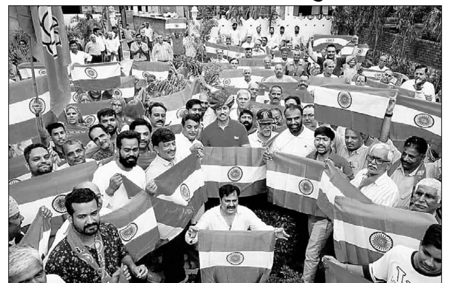
कैबिनेट मंत्री व झोटवाड़ा विधायक कर्मल राज्यवर्धन राठौड़ ने अपने विधानसभा क्षेत्र में जनता के साथ राष्ट्रीय ध्वज तिरंगा फहरा कर 'हर घर तिरंगा अभियान' का शुभारंभ किया। वार्ड 48 की पार्षद कुमकुम शक्तावत के वार्ड कार्यालय पर आयोजित इस कार्यक्रम में जनसैलाब उमड़ा।

जयपुर। कैबिनेट मंत्री व झोटवाड़ा विधायक कर्मल राज्यवर्धन राठौड़ ने गुरुवार को अपने विधानसभा क्षेत्र में जनता के साथ राष्ट्रीय ध्वज तिरंगा फहरा कर 'हर घर तिरंगा अभियान' का शुभारंभ किया। वार्ड 48 की पार्षद कुमकुम शक्तावत के वार्ड कार्यालय पर आयोजित इस कार्यक्रम में जनसैलाब उमड़ा।