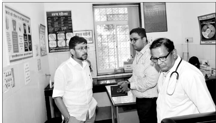
जिला कलेक्टर ने रा. शहरी प्राथमिक स्वास्थ्य केन्द्र चपरासी कॉलोनी, गायत्री नगर का निरीक्षण किया।

कंसल्टेंसी रूम बनाने का प्रस्ताव भिजवाने के निर्देश