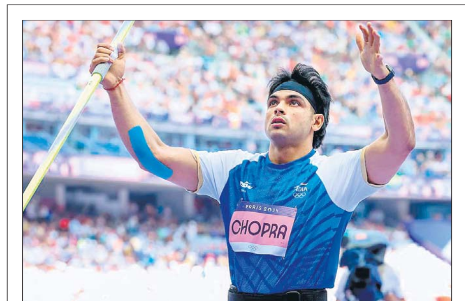
पैरिस ओलंपिक्स में जबरदस्त प्रदर्शन करते हुये जैवलिन श्रो में नीरज चोपड़ा ने सिल्वर मैडल जीत लिया है। नीरज चोपड़ा 89.45 मीटर का शो फेंककर प्रतियोगिता में दूसरे पायदान पर रहे और भारत के लिए सिल्वर मैडल पक्का किया। नीरज चोपड़ा ने दूसरे प्रयास में अपना सर्वश्रेष्ठ प्रदर्शन दिखाते हुये 89.45 मीटर दूर भाला फेंका। नीरज ने क्वालिफिकेशन राउंड में 89.34 मीटर दूर भाला फेंका था। नीरज इकलौते भारतीय खिलाड़ी हैं जिनके नाम ओलंपिक्स में दो मैडल दर्ज हो गये हैं।

पीठ ने शीर्ष विधि अधिकारियों अर्दोनी जनरल और सॉलिसिटर से कहा, हम जिला न्यायापालिका के संरक्षक होने के नाते आपसे ऐसा करने (हल) का आग्रह करते हैं। शीर्ष अदालत ने कहा कि पेंशन संबंधी शिकायतों को लेकर जिला न्यायाधीशों द्वारा न्यायालय के समक्ष कई याचिकाएं दायर की जा रही हैं। अर्दोनी जनरल वेंकटरमणी और सॉलिसिटर जनरल मेहता ने केंद्र का पक्ष रखते हुए पीठ से जिला न्यायालय के न्यायाधीशों के पेंशन संबंधी पहलुओं से संबंधित मामले पर बहस करने के लिए कुछ समय देने की गुहार लामोड़ी पीठ ने कहा कि जिला न्यायाधीशों को पेंशन के रूप में केवल 15,000 रुपये मिल रहे हैं। पीठ ने आगे कहा, जिला न्यायाधीश उच्च न्यायालयों में आते हैं। आमतौर पर उन्हें 56 और 57 वर्ष की आयु में उच्च न्यायालयों में पदोन्नत किया जाता है।