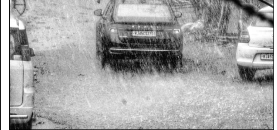
राजधानी जयपुर में शुक्रवार शाम तेज बारिश के साथ ओले भी गिरे।

-कार्यालय संवाददाता- जयपुर। पश्चिम विक्षोभ के असर से शुक्रवार को जयपुर सहित 18 शहरों में बारिश हुई। बीकानेर, जैसलमेर, श्रीगंगानगर, जयपुर, अलवर सहित अन्य कुछ शहरों में ओलावृष्टि देखने को मिली। इससे रबी की फसलों का भारी नुकसान हुआ है। रैगिस्तानी इलाकों में ओलावृष्टि से कश्मीर देखा दृश्य बन गया।