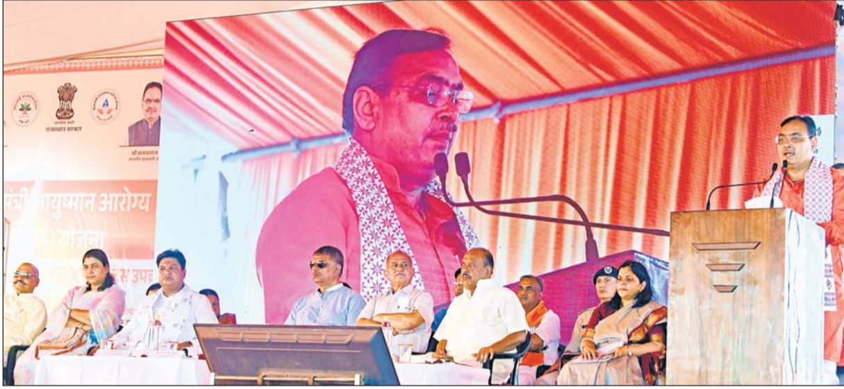
मुख्यमंत्री भजनलाल शर्मा प्रधानमंत्री के वर्युअल शिलान्यास कार्यक्रम में भरतपुर के आर.बी.एम. अस्पताल से वीडियो कॉन्फ्रेंस के जरिए शामिल हुए।