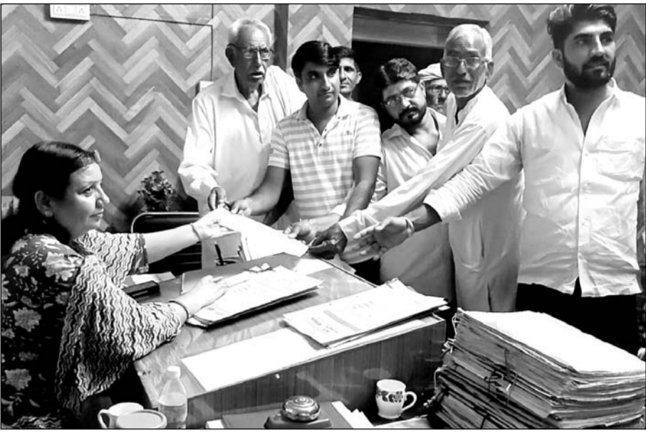
पेयजल संकट के विरोध में एसडीएम को ज्ञापन देते रडवा गांव के ग्रामीणजन।