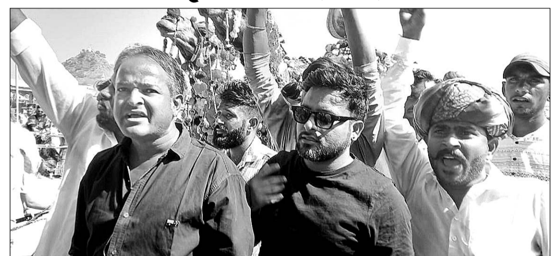
पुष्कर मेले में काफी संख्या में देशी व विदेशी पर्यटकों का आना जारी है।

पुष्कर 10 नवंबर। पुष्कर के सालाना मेले में राजस्थान सहित देश के विभिन्न राज्यों से श्रद्धालु पहुंच रहे हैं वहीं सात समुन्दर पार से विदेशी मेहमानों के आने से ब्रह्मजी की पावन नगरी पूर्व पश्चिम संस्कृति की स्थली में तब्दील हो गई। सैलानियों को मेले में आ रहे ठामाँग महिला पुरुष श्रद्धालुओं के साथ उठ व घोड़े चोड़ियों करतब लुभा रहे हैं। पशुओं की मंडी में पशुपालक खरीद फरोख्त में मशगूल है।