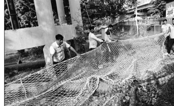
पानी की टंकी पर चढ़े दो बरोजगारों को सुरक्षित उतारने की कवायद में जुटे आपदा प्रबंधन के कर्मचारी।