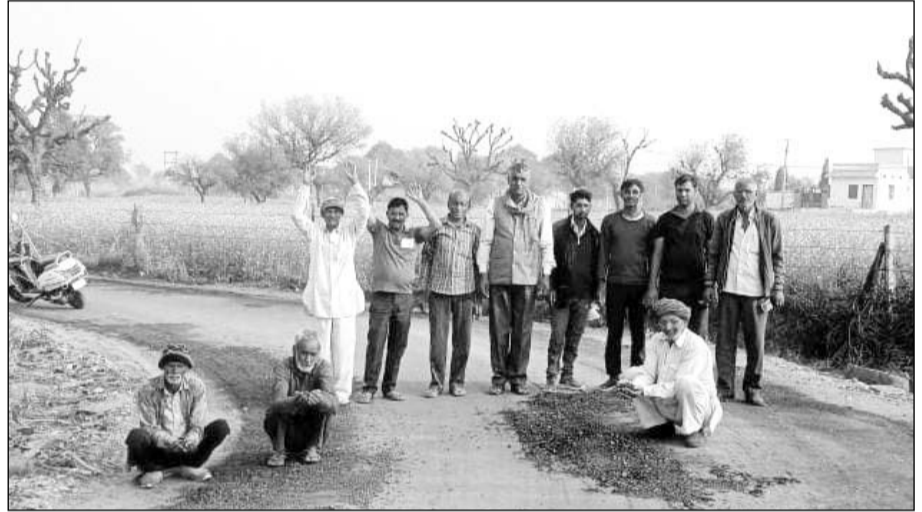
ग्रामीणों ने घटिया सामग्री का आरोप लगाते हुए विरोध प्रदर्शन किया।