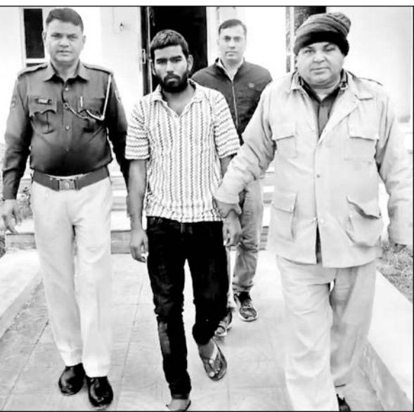
पाटन पुलिस ने चोरी के आरोपी को गिरफ्तार किया।