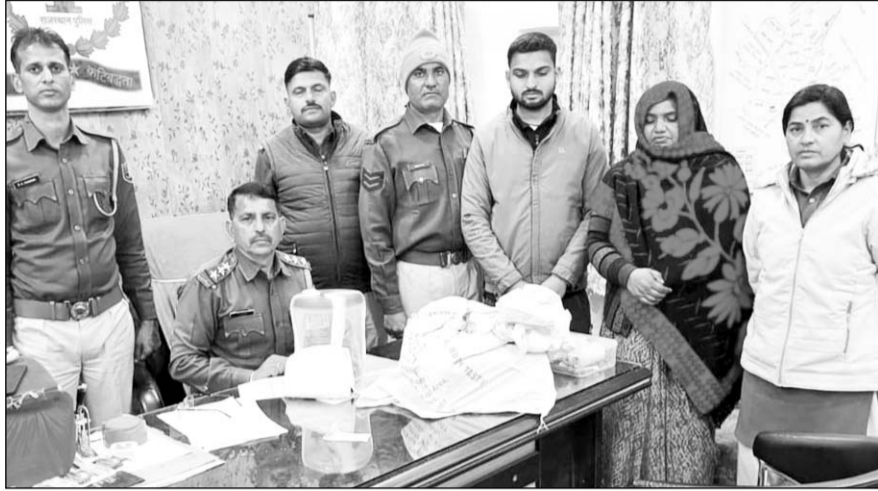
पुलिस ने एक महिला और एक पुरुष तस्कर को गिरफ्तार किया।