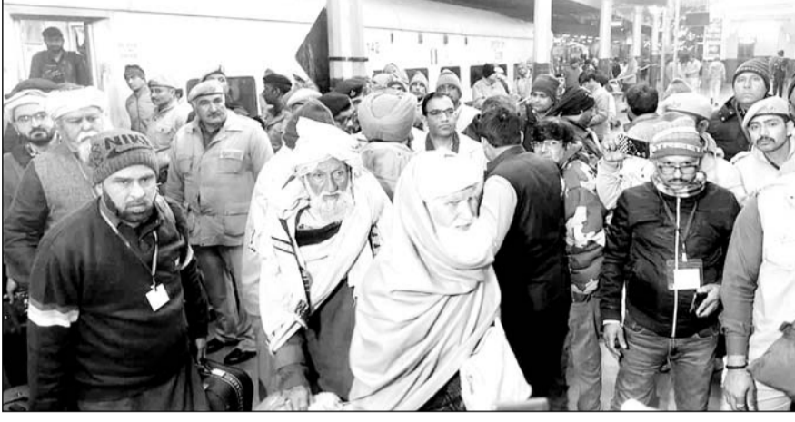
मंगलवार अल सुबह अजमेर रेलवे स्टेशन पहुंचे पाक जायरीन।

मंगलवार अलसुबह पाक जायरीन के अजमेर पहुंचने से पहले जिला पुलिस, खुफिया तंत्र, जीआरपी और आरपीएफ के जवानों ने प्लेटफार्म नंबर सुरक्षा घेरे में लिया। ट्रेन जैसे ही रेलवे स्टेशन पर रुकी तो पाकिस्तान से आए जायरीन की आंखों में खुशी के आंमु छलक उठे। ट्रेन के कोच से उतरते ही जायरीन ने अजमेर की सरजमीं को चूमते हुए खाजा साहब का शुकिया अदा किया। रेलवे स्टेशन के बाहर मीडिया के सबालों का जवाब देते हुए भारत सरकार की ओर से किए गए इंतजामों की सराहना की, उन्होंने कहा कि दोनों देशों के बीच