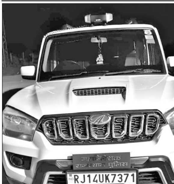
पुलिस थाने में जब्त गाड़ी।

बजरी के वाहनों से अवैध वसूली कर रहा था, लाल बत्ती लगी गाड़ी जब्त