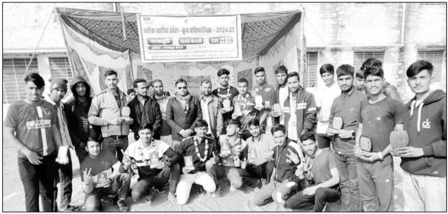
गंगापु सिटी। खेलकूद प्रतियोगिता में विजेता खिलाड़ी।