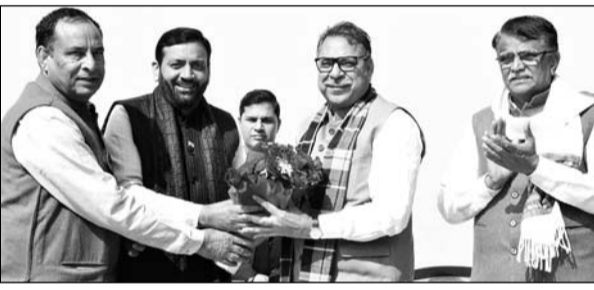
हरियाणा के पंचकूला पार्टी कार्यालय में भाजपा प्रदेश प्रभारी डॉ. सतीश पुनिया को पुष्पगुच्छ भेंट किया।