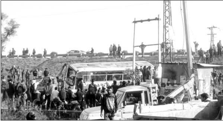
हादसे के बाद मौके लोगों की भीड़ जमा हो गई।

चौमू/कालाडेरा, (निर्स)। चौमू शहर के बायपास से गुजरने वाले जयपुर-सीकर हाइवे-52 पर स्थित वीर हनुमान मार्ग पुलिया के पास बुधवार को टारगेट करियर इंस्टीट्यूट (टी.सी.आई.) की बस पुलिया से अनियंत्रित होकर नीचे गिर गई। इस हादसे में एक छात्रा की मौत हो गई, जबकि नौ बच्चे गंभीर रूप से घायल हो गए। बस हादसे में सभी घायलों को हॉस्पिटल पहुंचाया गया, जहां डॉक्टर लगातार घायल छात्र-छात्राओं को स्वास्थ्य पर नजर बनाए हुए हैं। जानकारी के अनुसार हादसा बस का ब्रेक फेल होने के कारण हुआ है। बस में करीब 30 बच्चे सवार थे। घटना के बाद मौके से ड्राइवर फरार हो गया।