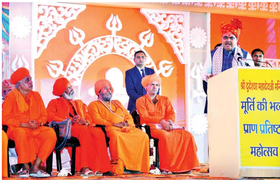
मुख्यमंत्री भजनलाल शर्मा ने जालौर के नरसाणा में दुदेश्वर महादेव मंदिर मूर्ति प्राण प्रतिष्ठा समारोह को संबोधित किया। उन्होंने कहा कि, हमारी सरकार प्रदेश में सांस्कृतिक एवं आध्यात्मिक विकास के लिए निरंतर काम कर रही है।

मुख्यमंत्री भजनलाल शर्मा ने जालौर के नरसाणा में दुदेश्वर महादेव मंदिर की प्राण प्रतिष्ठा में भाग लिया