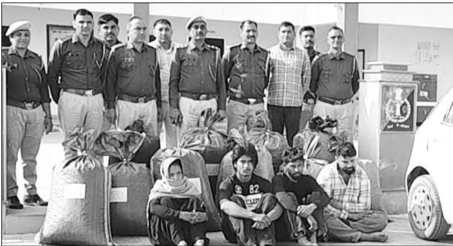
राजगढ़ थाना पुलिस ने अवैध डोडा-पोस्त छिलका तस्करी करते पति-पत्नी व एस्कोर्ट कर रहे दो अन्य आरोपियों को गिरफ्तार किया।