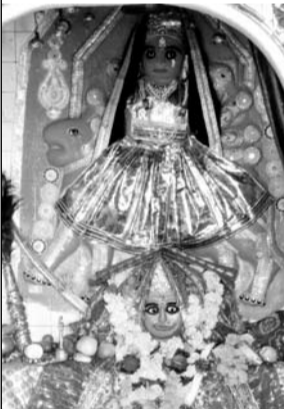
गुगोर स्थित बीजासन माता।

छबड़ा, (निर्सं)। कस्बे से आठ किलोमीटर दूर राजस्थान एवं मध्यप्रदेश की सीमा पर गांव गुगोर स्थित मां बीजासन मंदिर दोनों राज्यों के भक्तों का आस्था का केंद्र है। यूं तो कस्बे सहित जिलेवर्ष में कई धार्मिक स्थल हैं, लेकिन बीजासन माता मंदिर प्रमुख धार्मिक स्थल है। भक्त यहां सच्ची श्रद्धा से जो भी मन्त्र मांगते हैं, वो बीजासन माता के आशीर्वाद से पूरी हो जाती है। नवरात्र पर इन दिनों यहां दूर-दूर से श्रद्धालु माता के दर्शन करने के लिए पहुंच रहे हैं।