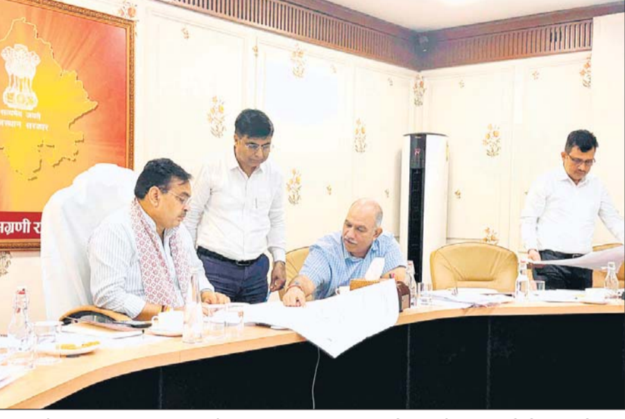
मुख्यमंत्री भजनलाल शर्मा ने मुख्यमंत्री कार्यालय में जलसंसाधन, इंद्रिया गांधी नहर एवं सिंचित क्षेत्र विकास व जल उपयोगिता विभाग से संबंधित विभिन्न परियोजनाओं एवं कार्यों की समीक्षा बैठक की अध्यक्षता की।

जयपुर, 7 अक्टूबर। मुख्यमंत्री भजनलाल शर्मा ने कहा कि प्रदेश में पेयजल एवं सिंचाई के लिए जल उपलब्धता राज्य सरकार की सर्वोच्च प्राथमिकताओं में से एक है। उन्होंने कहा कि प्रदेश में इन्स्ट्रास्टेंट नदियों को जोड़ने का कार्य व्यापक स्तर पर किया जाए एवं जन सहभागिता के माध्यम से जल संचय को बढ़ावा दिया जाए। जल संसाधन से जुड़ी परियोजनाओं की नियमित मॉनिटरिंग एवं क्रिया-व्ययन समयबद्ध रूप से सुनिश्चित किया जाए। शर्मा सोमवार को मुख्यमंत्री कार्यालय में जल संसाधन, इंद्रिया गांधी नहर एवं सिंचित क्षेत्र विकास एवं जल उपयोगिता विभाग से संबंधित विभिन्न परियोजनाओं एवं कार्यों पर आयोजित समीक्षा बैठक की अध्यक्षता कर रहे थे। उन्होंने कहा कि परियोजनाओं के कार्य में अनावश्यक देरी करने वाले ठेकेदारों एवं अधिकारियों पर सख्त कार्रवाई की जाए।