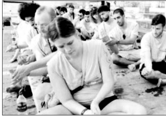
इजरायली पर्यटकों के 23 सदस्यीय दल ने पुष्कर सरोवर का पूजन व तर्पण कर प्रार्थना की।

पुष्कर/अजमेर, (कासं)। एक वर्ष पूर्व आज ही के दिन, यानी 7 अक्टूबर 2023 को आतंकी संगठन हमास द्वारा इजरायल पर किए गए आतंकी हमले में मारे गए इजरायलियों की आत्मा की शांति के लिए उनके परिवारजान और मित्रों ने शनिवार को पुष्कर सरोवर का पूजन व तर्पण कर प्रार्थना की। इस मौके पर विदेशी पर्यटकों की ओर से सरोवर की महाआरती का भी आयोजन किया गया।