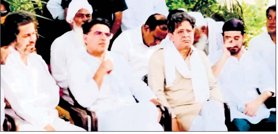
एक दिवसीय टोंक दौरे पर पूर्व उपमुख्यमंत्री सचिन पायलट ने पत्रकार वार्ता में पूरे आत्मविश्वास से कहा कि जम्मू-कश्मीर व हरियाणा में कांग्रेस की सरकार बनने जा रही है।

टोंक में पत्रकारों से बात करते हुए उन्होंने विश्वास जताया कि जम्मू-कश्मीर, हरियाणा में कांग्रेस सरकार बनेगी