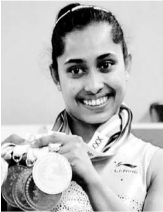
मेरे जीवन का केंद्र रहा और मैं उतार-चढ़ाव

नई दिल्ली, 7 अक्टूबर। भारत की स्टार जिम्नारिस्ट दीपा कर्माकर ने अचानक संन्यास लेकर सबको चौंका दिया है। दीपा 2016 के रियो ओलंपिक में पदक से चूक गई थीं, उन्होंने पांचवां स्थान हासिल किया था। 31 वर्षीय दीपा ओलंपिक में हिस्सा लेने वाली भारत की पहली महिला जिम्नारिस्ट बनीं थीं। उनका रियो ओलंपिक के वर्ल्ड इवेंट में महज 0.15 पॉइंट से ओलंपिक में मेडल जीतने का सपना अधूरा रह गया था।