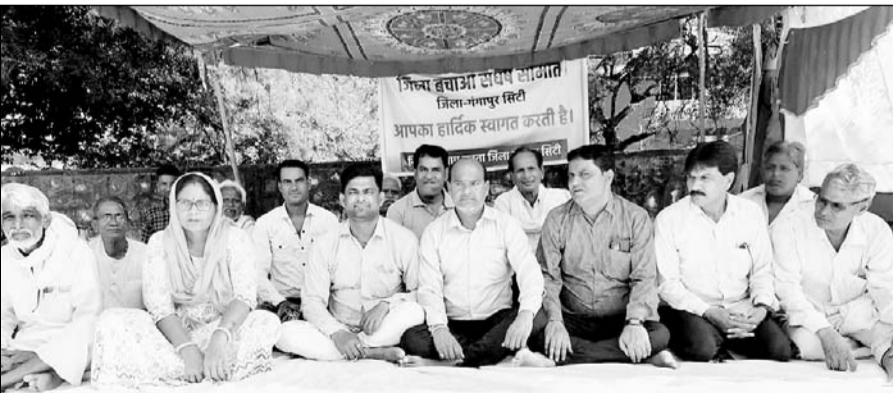
कलेक्ट्री के बाहर धरने पर बैठे जनप्रतिनिधि व आमजन।

गंगापुर सिटी। जिला बचाओ संघर्ष समिति द्वारा गंगापुर जिले में पुलिस अधीक्षक को नियुक्ति करने, जिला स्तर के किसी भी अधिकारी का ट्रांसफर नहीं करने एवं जिले को स्थाई स्वरूप देने की मांग को लेकर सांकेतिक धरना जिला कलेक्टर कार्यालय के सामने लगातार दसवें दिन जारी रहा, जिसमें नगर परिषद के वार्ड 29, 30, 31 एवं 32 के जनप्रतिनिधि, आमजन