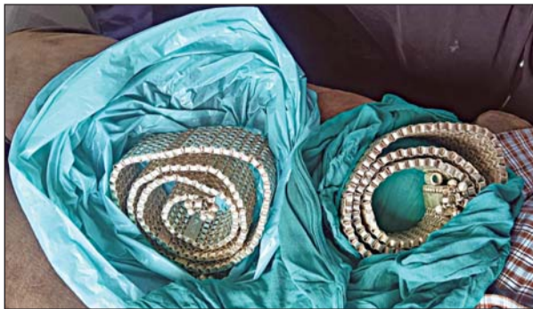
दोगुना करने का झांसा देकर ठगी करने वाले गिरोह से पुलिस ने दो किलो चांदी बरामद की।

हाथी थाना थाना डिग्गी में रिपोर्ट दर्ज कराकर बताया गया कि कुछ अज्ञात व्यक्तिवर्ग ने उन्हें एक दुर्लभ कछुए के नाम पर भारी मुनाफा कमाने का लालच दिया। आरोपियों ने दावा किया कि यदि