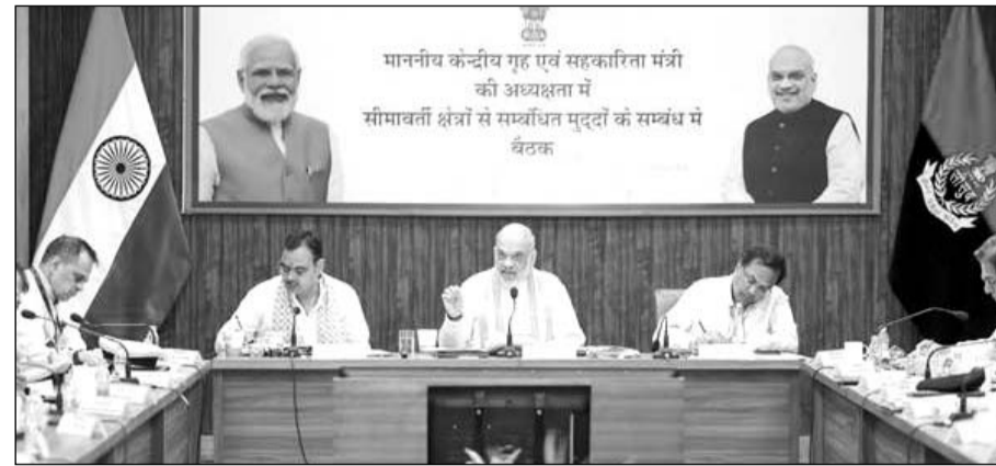
केन्द्रीय गृह मंत्री अमित शाह ने मुख्यमंत्री भजनलाल शर्मा के साथ बीकानेर में कलेक्टर्स और पुलिस अधीक्षकों की सुरक्षा बैठक करी।

केन्द्रीय गृह मंत्री अमित शाह ने बीकानेर में सुरक्षा बैठक लेकर निर्देश दिए