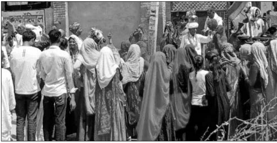
निवाड़ी उपखण्ड के ग्राम पहाड़ी व अन्य गांवों में ग्रामीणों ने नहर की मांग को लेकर जल यात्रा के माध्यम से आन्दोलन का आगाज किया।

टोंक/निवाड़ी। निवाड़ी उपखण्ड के ग्राम पहाड़ी व अन्य गांवों में किसान महापंचायत व ग्रामीणों ने नहर की मांग को लेकर जल यात्रा के माध्यम से आन्दोलन का आगाज करते हुए कलश यात्रा निकाली गई। इस कलश यात्रा ने वर्तमान में चल रहे नौपा की भीषण