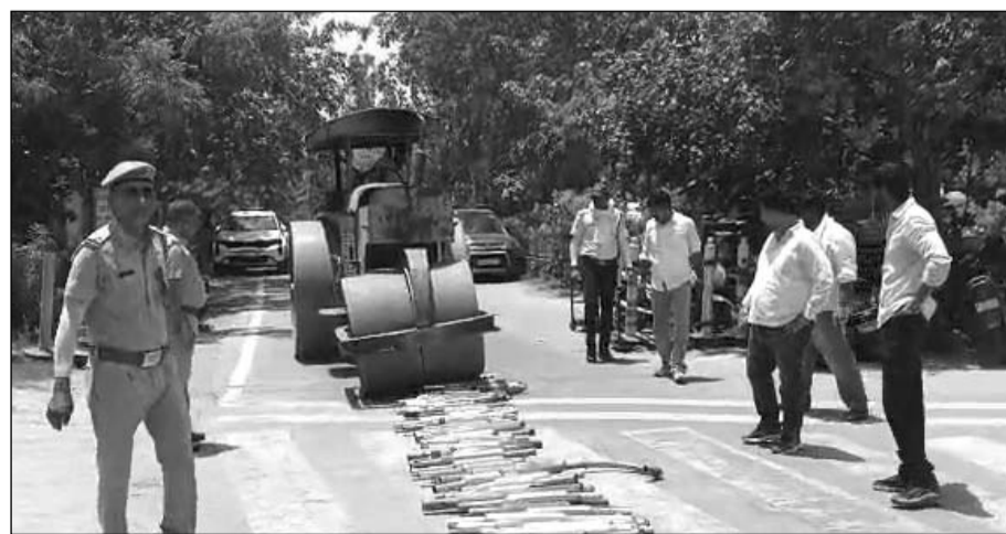
यातायात पुलिस ने जब्त किए साइलेंसरों को बुलडोजर से नष्ट कराया।

भरतपुर, (निसं)। शहर में तेज आवाज और पटाखे जैसी ध्वनि निकालने वाले माँडिफाइड साइलेंसर लगाने वालों के खिलाफ यातायात पुलिस ने बड़ी कार्रवाई करते हुए जब्त किए गए 142 साइलेंसरों को बुलडोजर से नष्ट कर