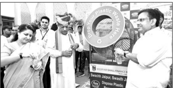
गोपालन मंत्री जोराराम कुमावत ने बुधवार को सरस पार्लर पर प्लास्टिक वेस्ट कलेक्शन बिन का शुभारम्भ किया।

जयपुर। पशुपालन, गोपालन एवं देवस्थान मंत्री जोराराम कुमावत ने कहा है कि पूरी की पूरी सृष्टि जल पर आधारित है और वर्तमान भी जल है तो भाविष्य भी। सृष्टि के लिये जल है तो ही अगला पल है। उन्होंने कहा कि राज्यभर की सहकारी डेयरियों में जल संरक्षण को बढ़ावा दिया जा रहा है। कुमावत बुधवार को सरस संकुल ऑडिटोरियम में राज्य स्तरीय डेयरी जल संरक्षण अभियान के उद्घाटन के अवसर पर आयोजित संगोष्ठी में बतौर मुख्य अतिथि संबोधित कर रहे थे।