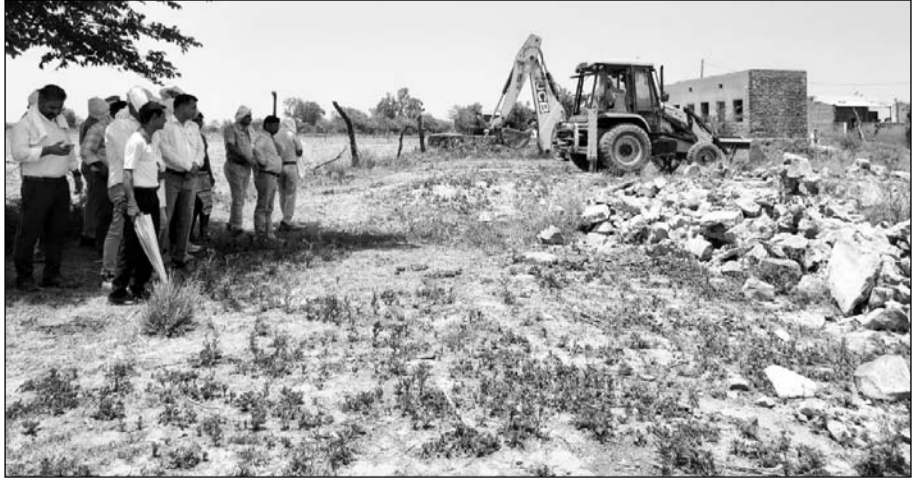
भरतपुर विकास प्राधिकरण ने अवैध कॉलोनियों को जेसीबी से तोड़ने की कार्रवाई की।

भरतपुर, (निर्स)। भरतपुर विकास प्राधिकरण (बीडीए) ने अवैध कॉलोनियों के खिलाफ बड़ी कार्रवाई करते हुए बुधवार को ग्राम खडेर और सेवर कला में विकसित की जा रही दो अवैध कॉलोनियों को ध्वस्त कर दिया। कार्रवाई के दौरान करीब 10 हेक्टेयर