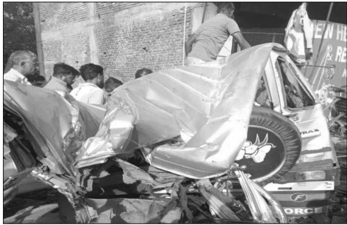
हादसे के बाद टेम्पो क्रूजर गाड़ी होटल में घुस गई।

जानकारी के अनुसार दुर्घटना बुधवार सुबह करीब सात बजे चौमूं शहर से गुजरने वाले