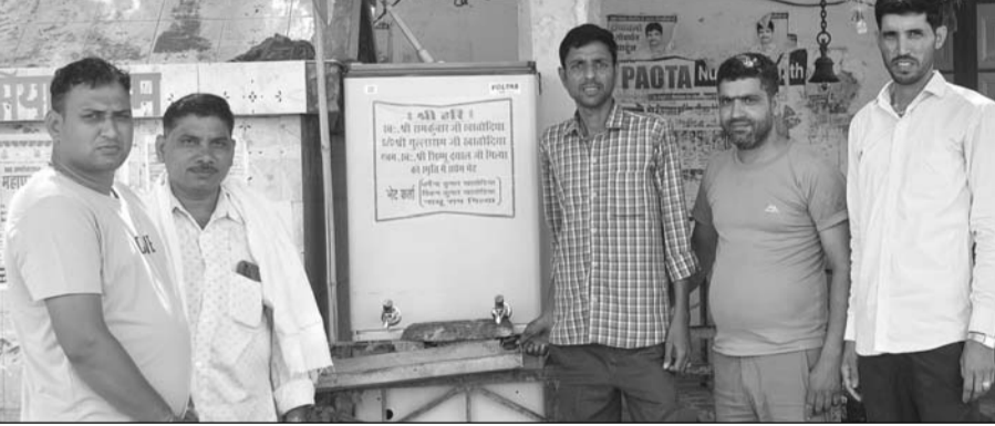
ठीकरिया स्टैंड पर आमजन की सुविधा के लिए वाटर कूलर स्थापित किया गया।

पावटा। भीषण गर्मी और लगातार बढ़ते तापमान के बीच ग्राम पंचायत ठीकरिया स्टैंड पर आमजन की सुविधा के लिए वाटर कूलर स्थापित किया गया। बुधवार को ग्रामीणों की मौजूदगी में सामाजिक सरोकार की इस पहल का लोकार्पण किया गया।