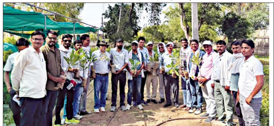
कोटपुतली में वंदे गंगा जल संरक्षण जन अभियान के तहत विविध गतिविधियों का आयोजन किया।

कोटपुतली-बहरोड,। राज्य सरकार के निर्देशानुसार संचालित वंदे गंगा जल संरक्षण जन अभियान-2026 के अंतर्गत बुधवार को जिलेभर में विभिन्न विभागों द्वारा जल संरक्षण, पर्यावरण संवर्धन एवं जनजागरूकता से संबंधित विविध गतिविधियों का आयोजन किया गया। अभियान के माध्यम से आमजन को जल संरक्षण एवं प्राकृतिक संसाधनों के संरक्षण के प्रति जागरूक किया गया। इसी क्रम में सूचना एवं जनसंपर्क विभाग द्वारा जिले के पत्रकारों को वंदे