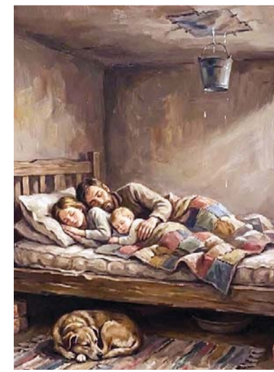
Be grateful, Sleep peacefully and stay blessed forever.