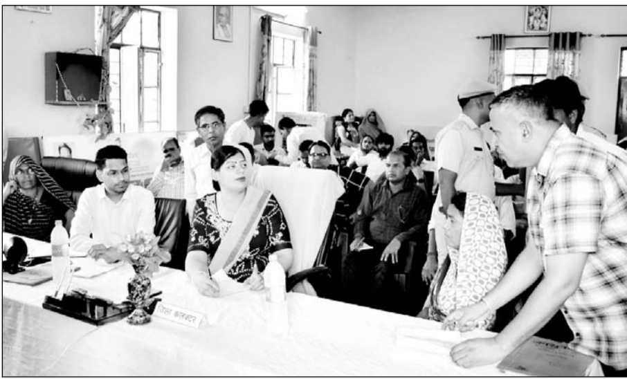
आमजन से संबंधित समस्याओं के निस्तारण हेतु प्रत्येक माह के प्रथम गुरुवार को ग्राम पंचायत स्तरीय जनसुनवाई कार्यक्रम का आयोजन हुआ।

जिला कलेक्टर ने प्रत्येक परिवारी की समस्या को बड़ी गंभीरता के साथ सुना और मौके पर उपस्थित संबंधित विभाग के अधिकारी को बुलाकर परिवारी की समस्या का समाधान करने