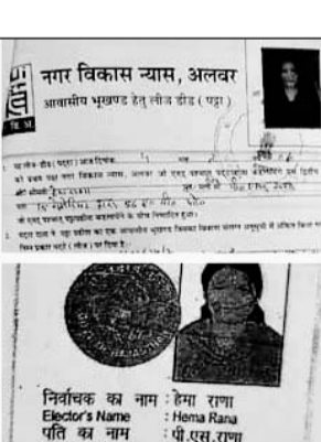
कई लोगों के प्लॉट, मकान व फ्लैट के फर्जी कागज तैयार कर फर्जी लोन उठाया

में खरीदे गए प्लॉट के समय की है। जो यूआईटी से चुराई गई। बिना यूआईटी के कर्मचारियों की मिलीभगत के यह सब संभव नहीं है। साल 2006 में ईटाराणा आर्मी के अलवर में कर्नल राणा की द्यूटी थी। जिन्होंने यूआईटी से ऑक्शन में अम्बेडकर नगर रकमी में पत्नी के नाम से के-30 प्लॉट खरीदा था। बाद में कर्नल राणा का ट्रांसफर हो गया। अब असम में द्यूटी है। 2020 में कर्नल राणा ने प्लॉट बेच भी दिया। जिसने प्लॉट खरीदा उसने मकान भी बना लिया। साल 2022 में इंडियन बैंक ने मकान पर नोटिस चिपका दिया। ये नोटिस लोन बकाया होने का था। पता