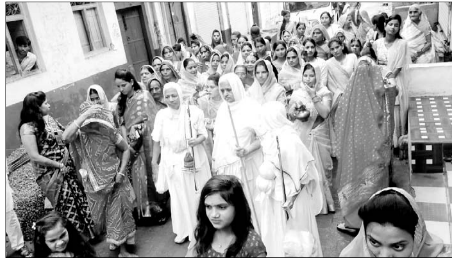
डग के समीप मध्यप्रदेश सीमा पर स्थित दुधालिया नगर में पू सा कमल प्रभा श्रीजी मसा आदि ठाणा का भव्य चातुर्मासिक मंगल प्रवेश हुआ।

डग (निस)। डग के समीप मध्यप्रदेश सीमा पर स्थित दुधालिया नगर में आज पू सा कमल प्रभा श्रीजी मसा आदि ठाणा का भव्य चातुर्मासिक मंगल प्रवेश हुआ।