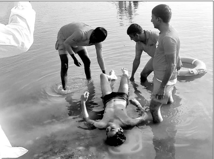
एसडीआरएफ की टीम ने कड़ी मशक्कत के बाद दोनों के शवों को नदी में से निकाला।