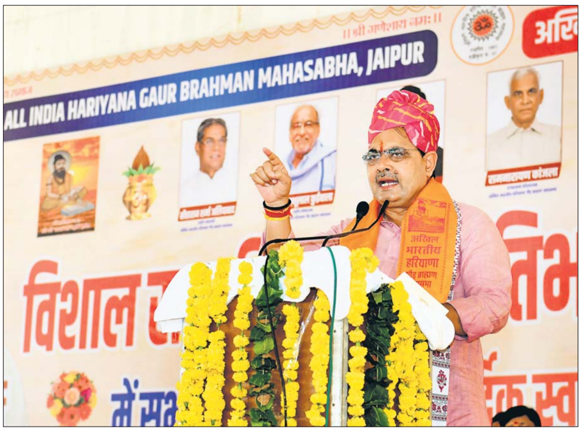
मुख्यमंत्री भजनलाल शर्मा ने अखिल भारतीय हरियाणा गौड़ ब्राह्मण महासभा के समारोह में भाग लिया। इस अवसर पर उन्होंने कहा कि ऐसे आयोजकों से प्रतिभाओं को प्रोत्साहन मिलता है।