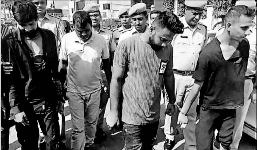
पुलिस ने अपहरण के मामले में चारों आरोपियों की अजमेर शहर में परेड कराई।