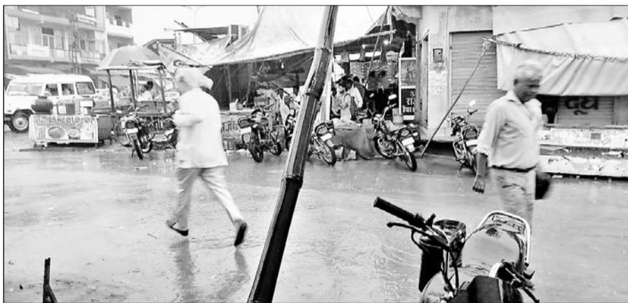
चाकसू कस्बे में बारिश के बाद आवागमन रूक-सा गया।

चाकसू, (निर्सं)। कस्बा समेत आस-पास के ग्रामीण अंचलों में शुकुवार देर शाम को झामझम बारिश हुई। उपखंड क्षेत्र में करीब 1 घंटे तक जमकर बादल बरसे जहां बारिश से ग्रामीणों की गर्मी व उमस से निजात मिली वहीं भीषण गर्मी से झुलस रही फसलों को जीवनदान मिलने से किसानों के चेहरे खिलखिला उठे। बारिश होने से मौसम सुहाना हो गया तथा मौसम में