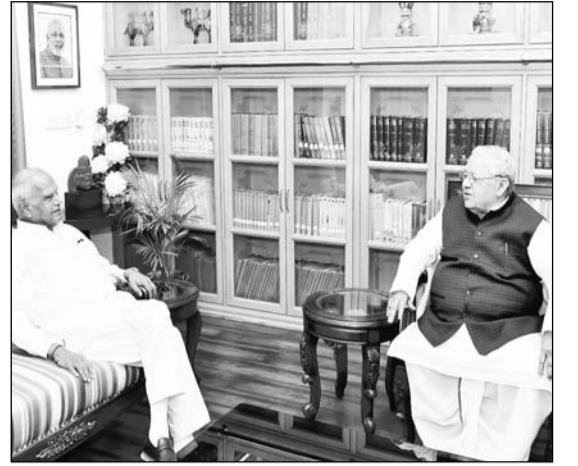
राज्यपाल कलराज मिश्र से पंजाब के राज्यपाल बनवारीलाल पुरोहित ने शुक्रवार को राजभवन में मुलाकात की। राज्यपाल मिश्र से उनकी यह शिष्टाचार भेंट थी।