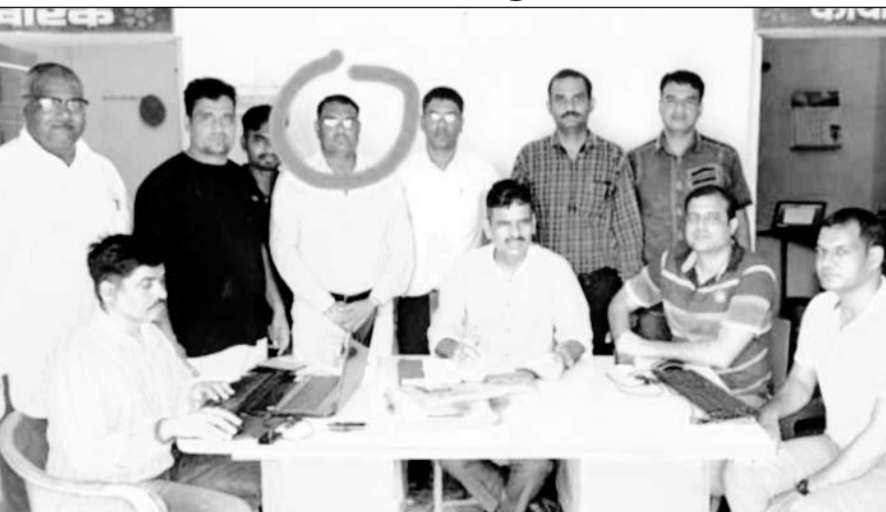
कोटा एसीबी ने बारां शहर की हाउसिंग बोर्ड पुलिस चौकी में कारवाई की।