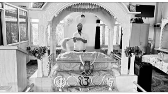
विजयनगर में गुरु श्री रामदास साहिब महाराज का प्रकाश पर्व श्रद्धा के साथ मनाया।