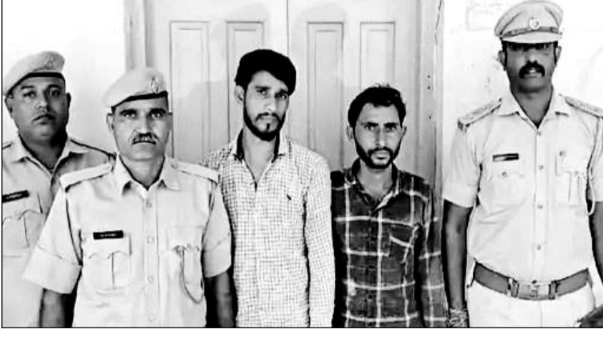
सरिस्का के बफर ज़ोन में करंट लगाकर शिकार करने वाले दो शिकारियों को गिरफ्तार किया।