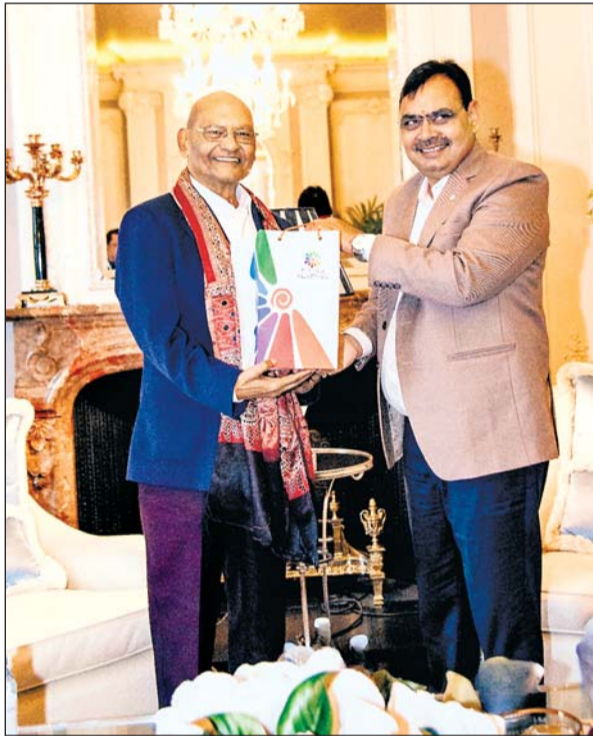
लंदन में मुख्यमंत्री भजनलाल से आज वेदांता समूह के चेयरमैन अनिल अग्रवाल ने मुलाकात की और राजस्थान में एक लाख करोड़ रु. के निवेश के लिए अपनी प्रतिबद्धता दोहराई।

मुख्यमंत्री और अनिल अग्रवाल के बीच "पुंछरी का लौठा" (गोवर्धन परिक्रमा से संबंधित एक महत्वपूर्ण