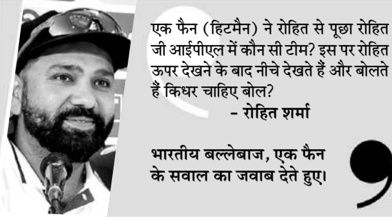
एक फैन (हिटमैन) ने रोहित से पूछा रोहित जी आईपीएल में कौन सी टीम? इस पर रोहित ऊपर देखने के बाद नीचे देखते हैं और बोलते हैं किधर चाहिए बोल? - रोहित शर्मा