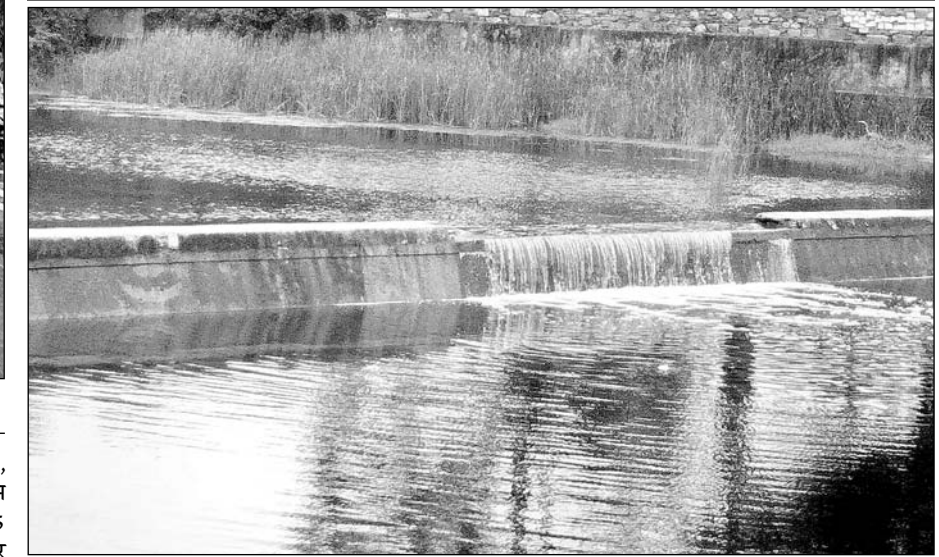
राजसमंद में मोही कस्बे के बनास नदी एनीकट पर चादर चलने से बहता पानी।

जिले में केचमेंट सहित कई जगहों पर अच्छी बारिश, झीलों में पानी की आवक शुरू होने की आस बंधी