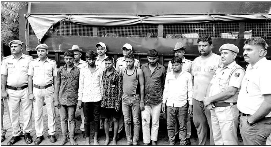
जालोर कोतवाली पुलिस ने चोरी व नकबजनी के मामले में छह जनों को गिरफ्तार किया।