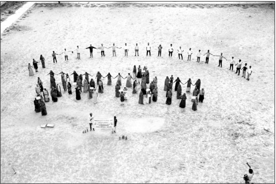
जालोर में सघन पौधारोपण अभियान के तहत मानव श्रृंखला बनाई।