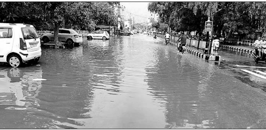
जालोर में बारिश के बाद कलेक्ट्रेट गेट के आगे पानी भर गया।

जालोर शहर के कई निचले इलाकों में बारिश के चलते पानी नजर आने लगा