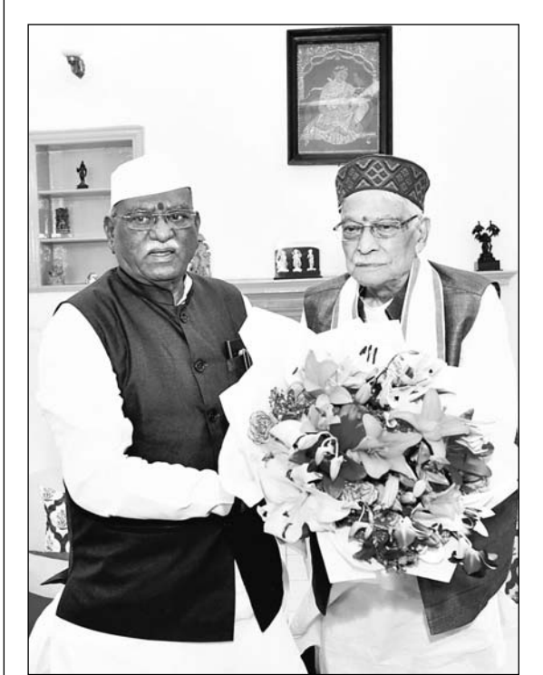
राज्यपाल हरिभाऊ किसनराव बागडे ने शनिवार को दिल्ली में पूर्व केंद्रीय मंत्री मुरली मनोहर जोशी के आवास पहुंचकर उनसे मुलाकात की। उन्होंने उनसे विभिन्न विषयों पर संवाद किया। राज्यपाल बागडे की जोशी से यह शिष्टाचार भेंट थी।

जयपुर, (का.सं.)। राज्यपाल हरिभाऊ किसनराव बागडे ने शुक्रवार और शनिवार को राष्ट्रपति भवन में राष्ट्रपति द्रौपदी मुर्मु की अध्यक्षता में आयोजित राज्यपालों के सम्मेलन में भाग लिया। बागडे राष्ट्रपति भवन में आयोजित इस सम्मेलन में एक भारत श्रेष्ठ भारत, 'एक वृक्ष मां के नाम' और प्राकृतिक खेती अभियान, राज्यपालों का जनता से सतत संपर्क, राज्यपालों की भूमिका और विभिन्न केंद्रीय एजेंसियों के बीच बेहतर समन्वय स्थापित करने में राज्यपालों की भूमिका जैसे विषयों के विभिन्न सत्रों में शामिल हुए। उल्लेखनीय है कि इस सम्मेलन में राष्ट्रपति द्रौपदी मुर्मु, उपराष्ट्रपति जगदीप धनञ्जय, प्रधानमंत्री नरेंद्र मोदी, केंद्रीय गृह मंत्री अमित शाह आदि ने संबोधित किया।