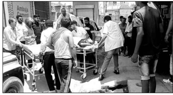
घायल लोगों को एंबुलेंस की सहायता से अस्पताल पहुंचाया।

कार में सवार लोग अमृतसर पंजाब से श्याम बाबा के दर्शनों के लिए खादूश्यामजी आ रहे थे