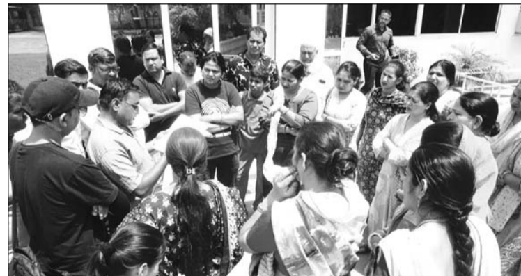
राजधानी जयपुर के श्याम नगर इलाके में “ट्री हाऊस हाई स्कूल” तीसरे दिन गुरुवार को भी बंद रहा, जिसे लेकर अभिभावकों ने कड़ई नाराजगी जताई।