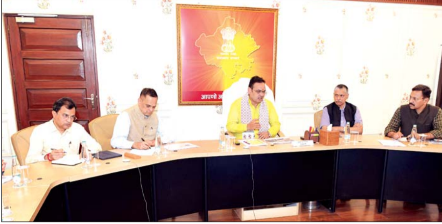
मुख्यमंत्री भजनलाल शर्मा ने गुरुवार को मुख्यमंत्री कार्यालय में जयपुर मेट्रो रेल परियोजना की प्रगति को लेकर अधिकारियों की बैठक ली।

(मानसरोवर-अजमेर रोड चौराहा) की परियोजनाओं को गति देने के भी निर्देश दिए।