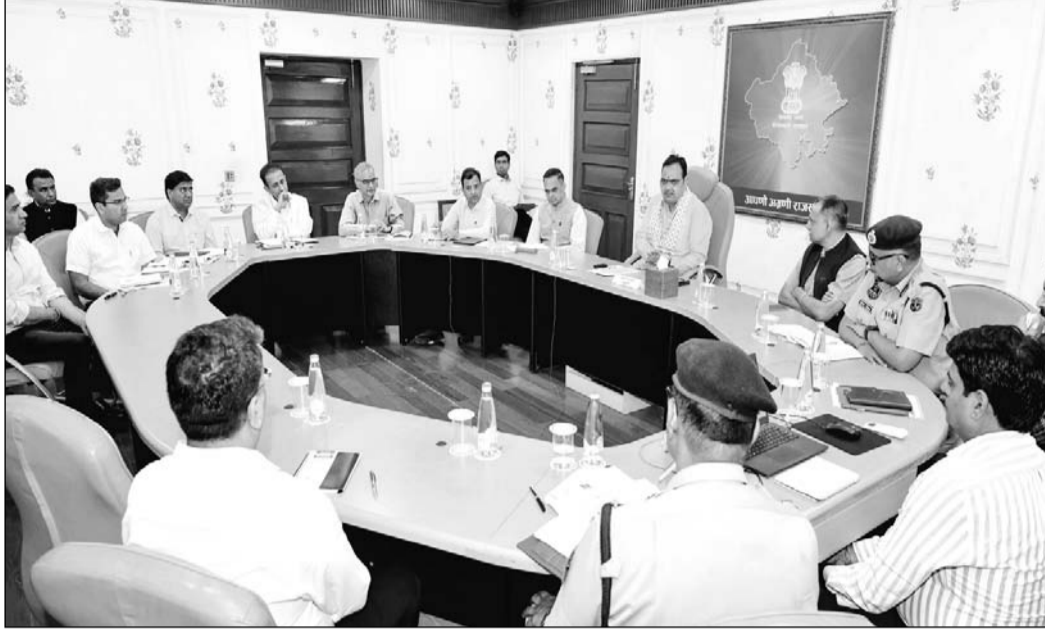
मुख्यमंत्री भजनलाल शर्मा ने गुरुवार को जयपुर शहर के यातायात सुधार के लिए अधिकारियों की उच्चस्तरीय बैठक ली।

उन्होंने जेडीए की सीबीआई फाटक, सालिग्रामपुरा फाटक एवं सिविल लाइन फाटक आरओबी, गोपालपुरा एलिबेटेड रोड, सांगानेर एलिबेटेड रोड के काम को गति प्रदान करने एवं पूर्ण गुणवत्ता से पूरा करने के लिए निर्देशित किया। साथ ही, उन्होंने जेलएन मार्ग पर यातायात प्रबंधन का प्रभावी प्लान बनाने के भी निर्देश दिए।