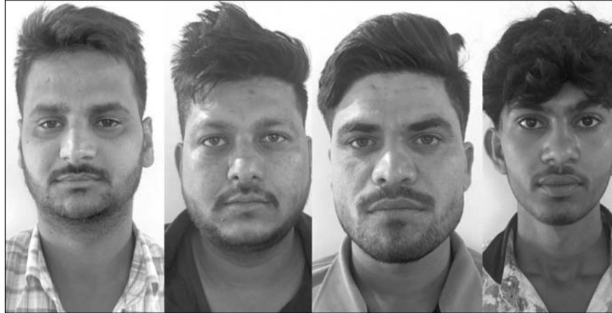
बरोनी पुलिस ने अपहरण करने के आरोपियों को गिरफ्तार किया।