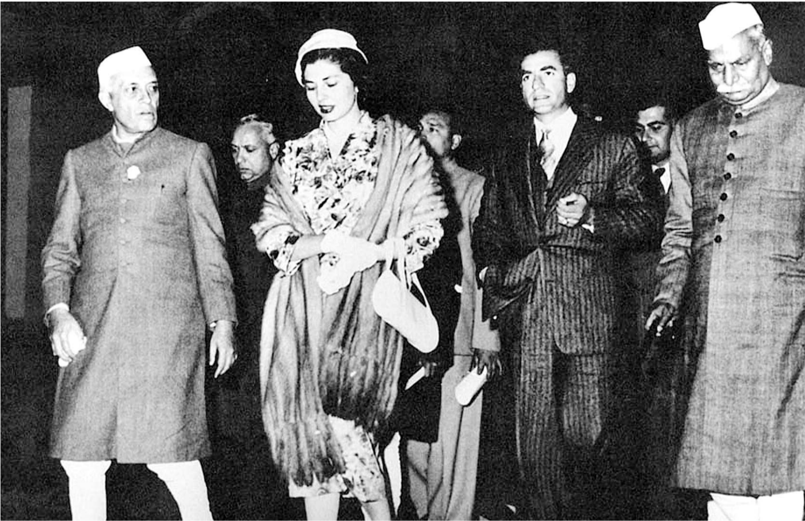
Prime Minister Jawaharlal Nehru with H.M. Queen Soraya and H.I.M. Emperor Shah Mohammad Reza Pahlavi of Iran.

invited him to join in, and the Shah happily played cricket with them for over an hour.