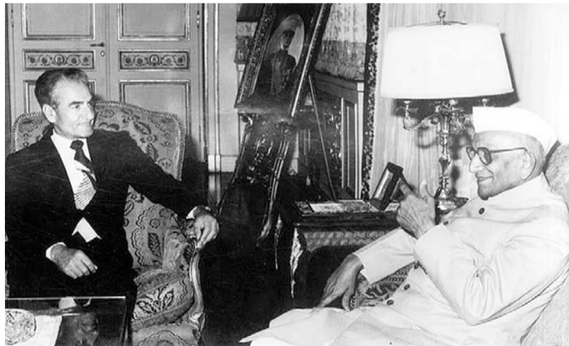
Prime Minister Morarji Desai with His Imperial Majesty, Shahenshah of Iran at Niavaran Palace in Tehran on June 5, 1978.

One of the most memorable moments of their friendship occurred during the Shah's visit to India in 1956. At the time, Nehru was in the midst of a major political crisis, with several of his ministers resigning from his cabinet. The Shah, recognizing the importance of Nehru's leadership for both India and the wider world, offered his