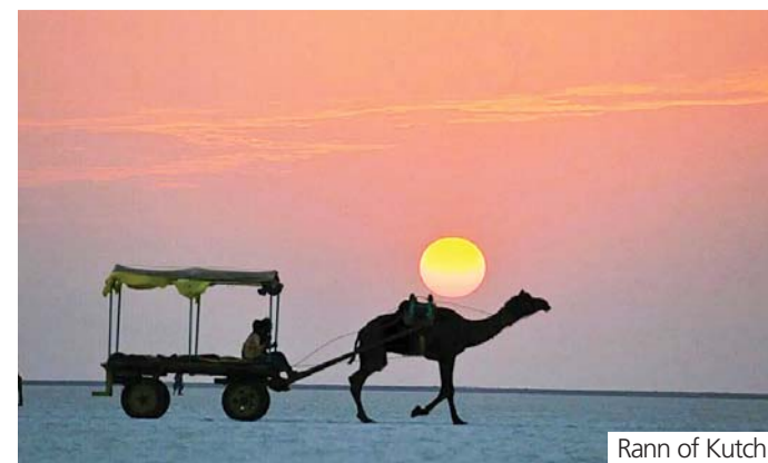
Rann of Kutch,

Rann of Kutch is another gorgeous sunset destination of India. Sunset at the Rann of Kutch makes the visitors feel like enjoying a beautiful natural wonder in the desert. At the White Rann of Kutch, the phenomenon offers spectacular views to the visitors. There is nothing more beautiful than seeing the setting of sun on an