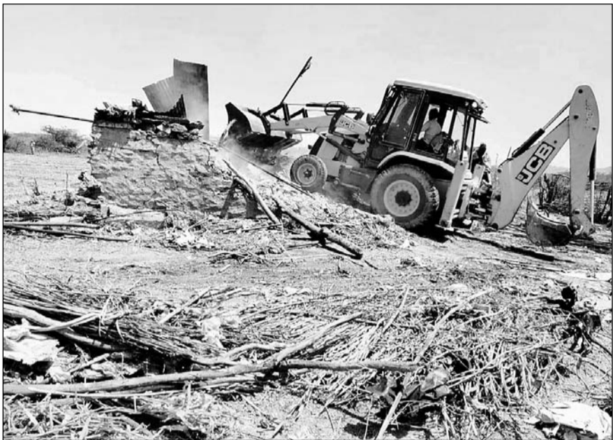
चौथ का बरवाड़ा उपखंड में वन विभाग व स्थानीय पुलिस ने संयुक्त कार्रवाई कर अवैध अतिक्रमण को ध्वस्त किया।

बामनवास, (कासं)। चौथ का बरवाड़ा उपखंड क्षेत्र में वन विभाग एवं स्थानीय थाना पुलिस द्वारा संयुक्त कार्रवाई करते हुए वन विभाग की करीब 316 बीघा जमीन पर अवैध अतिक्रमण को ध्वस्त किया गया। वन भूमि पर कुल 14 अतिक्रमियों द्वारा अवैध रूप से खेत बनाकर कच्चे व पक्के मकान अमरुदों के बगीचे लगाकर अतिक्रमण कर रखा था। जिसको मंगलवार को वन विभाग व पुलिस विभाग द्वारा कार्रवाई करते हुए मशीनों आदि की सहायता से भूमि को अतिक्रमण से मुक्त कराया गया व मौके पर उक्त कार्यवाही पर जेसीबी मशीन द्वारा खाई खुदवा कर भूमि को सरकारी कब्जे में लिया गया।