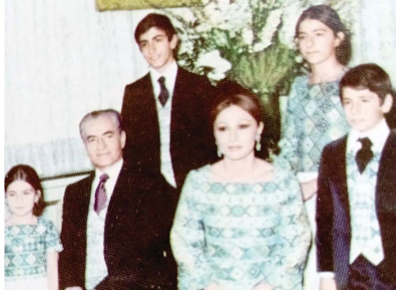
Iranian royal family.