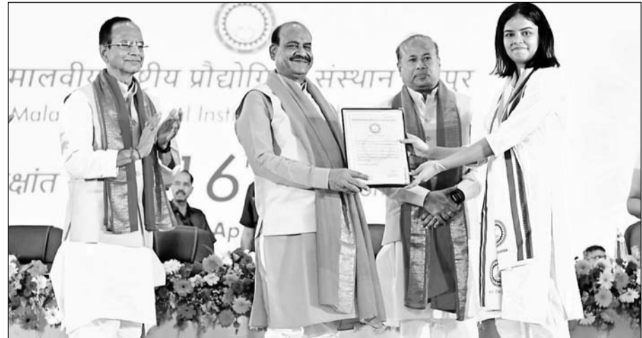
लोकसभा अध्यक्ष ओम बिरला ने समारोह में छात्रों को सम्मानित किया।

■ प्रौद्योगिकी की दौड़ में मानव कल्याण की भावना को खोना नहीं चाहिए : लोकसभा अध्यक्ष ■ लोकसभा अध्यक्ष ने एमएनआईटी, जयपुर के 16वें दीक्षांत समारोह और आईआईआईटी, कोटा के दूसरे दीक्षांत समारोह को संबोधित किया