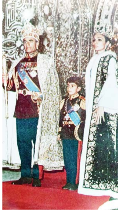
The Shah of Iran, Mohammad Shah Pahlavi, poses with his son, Prince Reza, and wife, Farah, following his coronation in 1967.