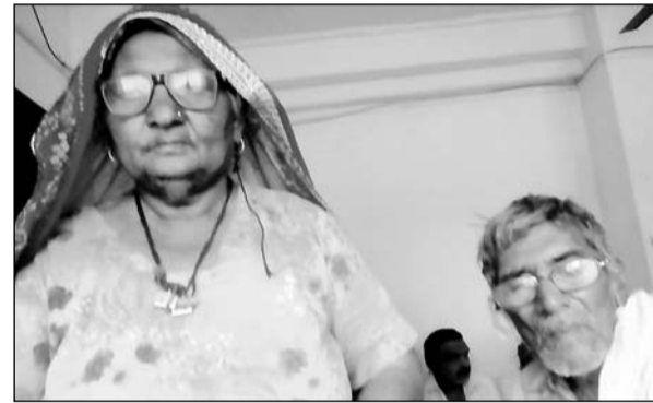
बुजुर्ग दंपति ने एस.पी. से न्याय की गुहार लगाई।