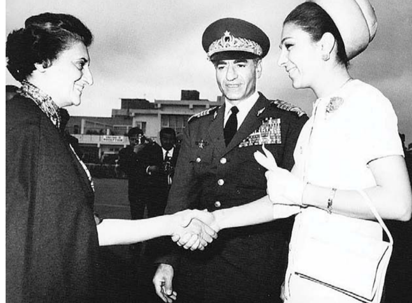
Pahlavis meet Indira Gandhi in India, 1970.